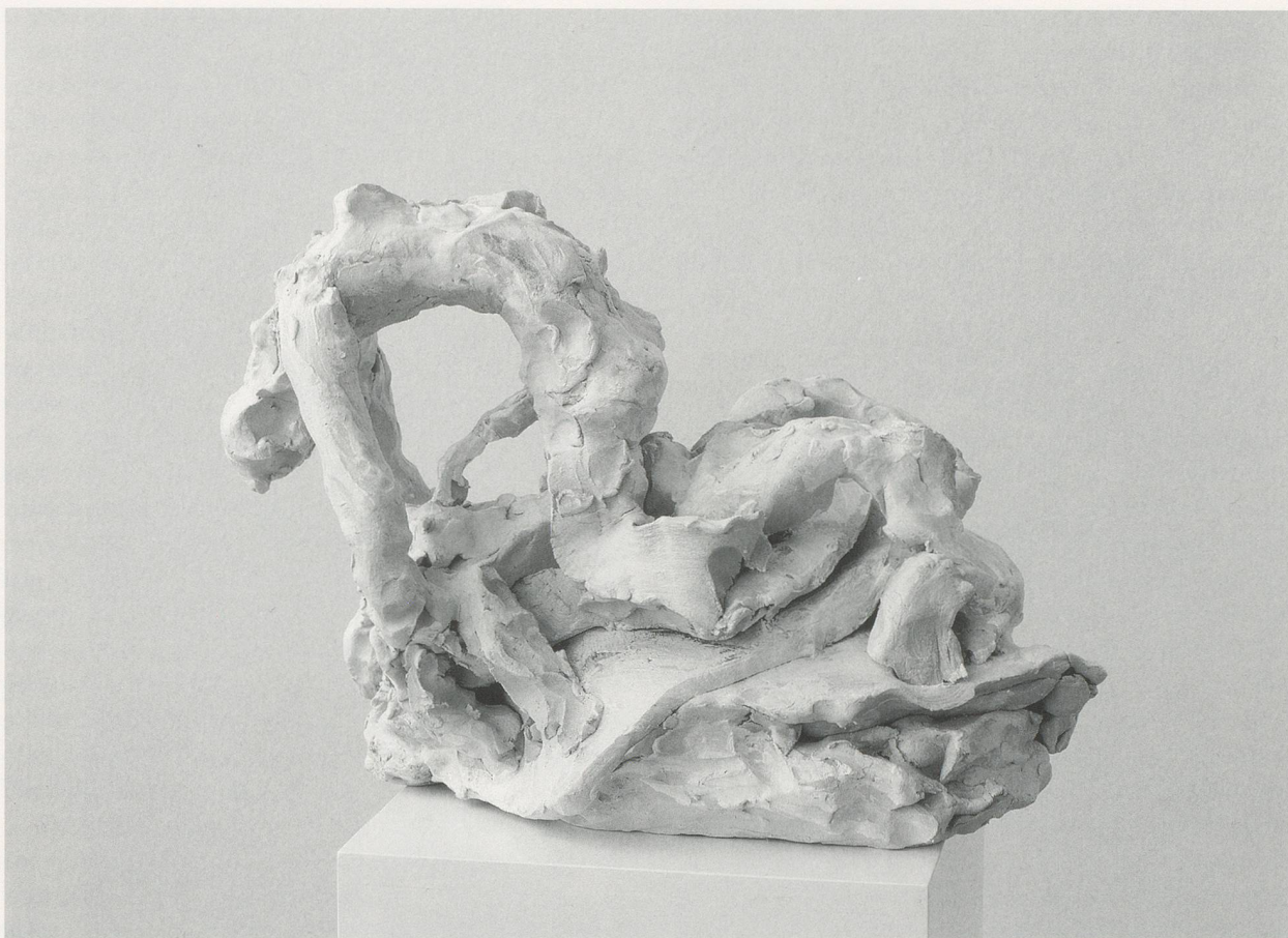
REBECCA WARREN, THE PEARLS OF SWITZERLAND , 2004, reinforced clay, acrylic paint, 14 5 / 8 x 15 3 / 4 x 9 1 / 2 " / DIE PERLEN DER SCHWEIZ, verstärkter Ton, Acrylfarbe, 37 x 40 x 24 cm.

gänger. Doch im oberen Teil ist die Figur merklich damenhafter geworden, ungeachtet des über die Brust gelegten Tuchs aus Schottenstoff. Sie trägt eine Schleife im gefärbten Haar; das erweckt, genau wie das hinzugefügte Stoffteil, den Eindruck eines formalen Tabubruchs. Sie ist um eine Nuance graziöser als BOBO, aber noch immer ein Wrack.