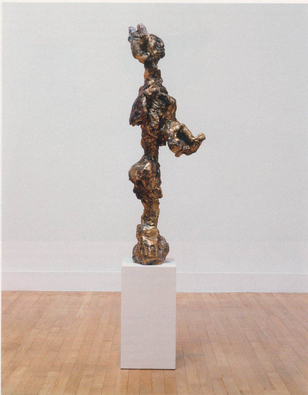
REBECCA WARREN, DOU DOU CHÉ , 2006, bronze, 47 1/4 x 15 3/4 x 17 3/4" / Bronze, 126 x 43 x 37 cm.