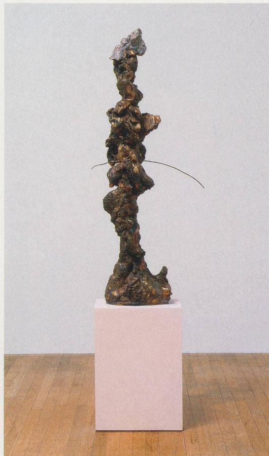
REBECCA WARREN, BOBO, 2006, bronze, acrylic paint, branch, 51 1/8 x 14 1/8 x 13" / Bronze, Acrylfarbe, Ast, 130 x 36 x 33 cm.

from the past, it is that moment: the electric frisson of the modern in its nascence, transliterated here through the most irreducible aspects of the contemporary—a potent cocktail of ugly female strength, formal grotesquery, radical ambivalence of attitude, and generalized inconclusiveness—and leading to fundamental uncertainty punctuated by awkward laughter. To echo that moment and ensure that it reverberates for as long as possible remains an exhilarating problem—for her, and for us.