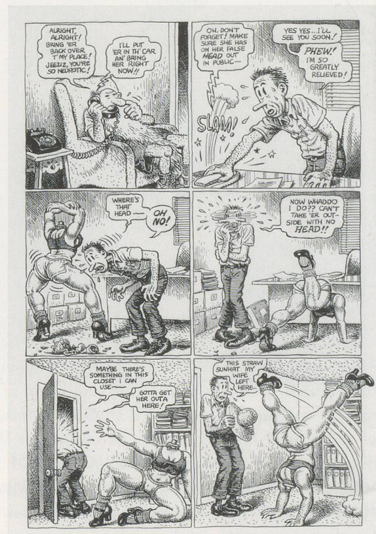
ROBERT CRUMB, from A Bitchin' Bod! / Ein Hurenstück!, 1992.

You don't know, as you never really know with Warren, what this work expresses about her feelings on any of its reference points, or on gender politics, but you can sense her own current not-knowing and desire for clarification, perhaps aided by making such an obtuse object. A work such as this is, on one level, a hand raised, requesting forbearance while she works it out. In the meantime, Warren places you in the midst of flux and provisionality. In 1914, Sigmund Freud (whose photograph appeared on the cover of her Kunsthalle Zurich catalogue in 2004, and who is not only one of many looming father figures in her art but also, of course, formulator of the Oedipus Complex) characterized his psychoanalytic method in terms of "remembering, repeating, and working through." This doesn't seem irrelevant to Warren's reactive, performative methodology. For a