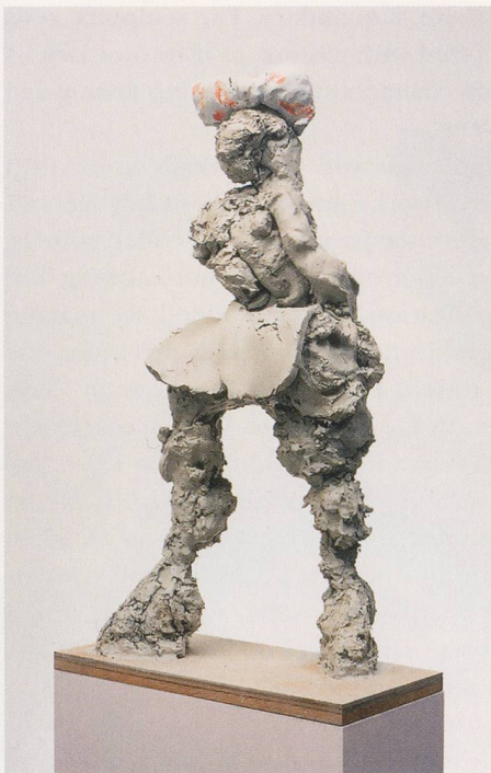
REBECCA WARREN, PONY , 2003, reinforced clay, acrylic paint, plinth, 37 x 10 5 / 8 x 22 1 / 2 " / Verstärkter Ton, Acrylfarbe, Sockel, 94 x 27 x 57 cm.

long time, her work has involved something resembling an inquisitive inhabiting of artistic practices of the past—trying them on for size and often trying several on at once, as if rifling through a dress-up box found in a dusty attic.