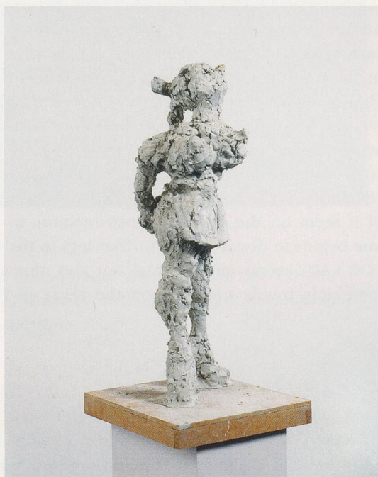
REBECCA WARREN, BUNNY , 2002, reinforced clay, plinth, 28 7 / 8 x 15 x 13 5 / 8 " / Verstärkter Ton, Sockel, 73,5 x 38 x 34,5 cm.

But this is also a model of layering which the work consequently performs in terms of tone: Spend time with BITCH MAGIC ... and a mood of protectiveness and sympathy towards its constituents comes through; you can imagine Warren having somehow saved them from oblivion, irrelevance, lack of use,