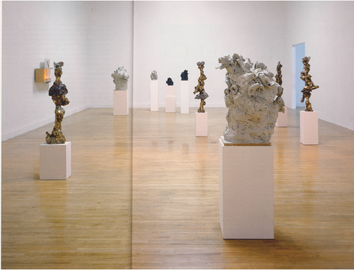
REBECCA WARREN, The Turner Prize , exhibition view, Tate Britain, 2005 / Ausstellungsansicht, Turner-Preis.