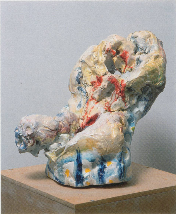
REBECCA WARREN, DER TOTSCHLÄGER ( The Manslayer ), 2002, self-firing, painted clay, plinth, 12 1/4 x 12 1/4 x 8 5/8 " / selbsttrocknender, bemalter Ton, Sockel, 31 x 31 x 22 cm.

Commedia illustrieren sollten. In ungefähr fünf Jahren hatte er rund zweihundert Figuren beisammen, die Baudelaires erotischen, dekadenten Liebenden immer ähnlicher sahen. Ein Besucher des Ateliers an der Rue de l'Université hätte einen vom Geist der spontanen Kreation Besessenen, ja Vergifteten erblickt. Ein «unermessliches Heer todgeweihter Frauen wurde zum Leben erweckt und wand sich in seinen Händen. Einige lebten ein paar Stunden, bevor sie wieder in die Masse des stetig neu verarbeiteten Tons eingingen.» 3) Dennoch wurden in diesem gut organisierten Atelier, in dem eine Reihe technischer Spezialisten zu Gange waren, viele Figuren in Gips gegossen und Negativformen manchmal wieder mit frischem Ton gefüllt, obwohl Rodin sämtliche Originale und Variationen für den Rest seines Lebens bei sich behielt.