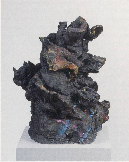
REBECCA WARREN, LOULOU, 2006, painted reinforced clay, plinth, 16 1/2 x 13 3/4 x 13" / bemalter verstärkter Ton, Sockel, 42 x 35 x 33 cm.