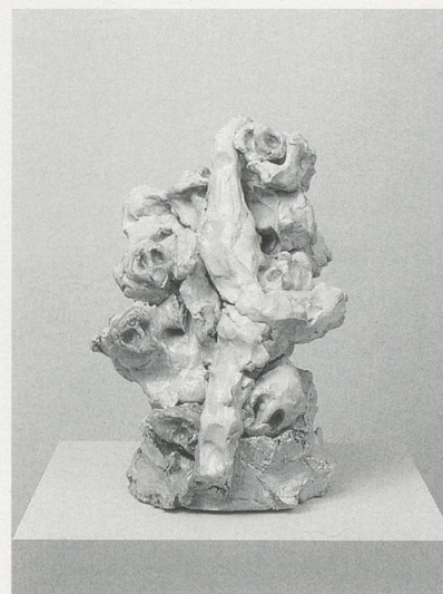
REBECCA WARREN, MADDER ROSE , 2003, self-firing, painted clay, plinth, 14 5 / 8 x 11 x 10 5 / 8 " / VERRÜCKTERE ROSE, selbsttrocknender Ton, Sockel, 37 x 28 x 27 cm.

13) Lizzie Carey-Thomas, Turner Prize 2006 , Broschüre der Tate Britain, 2006.