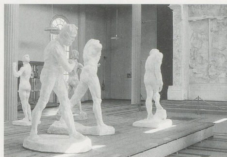
AUGUSTE RODIN, standing figures and THE GATE OF HELL, Musée Rodin, Meudon / Skulpturen und HÖLLENTOR. (PHOTO: COURTESY OF IVOR HEAL)