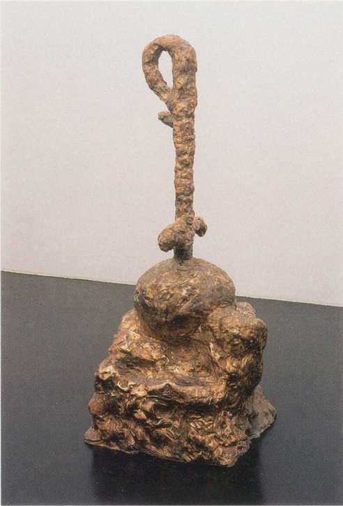
REBECCA WARREN, P.E. , 2005, bronze, 62 1/4 x 26 3/8 x 24 3/4" / Bronze, 158 x 67 x 63 cm.