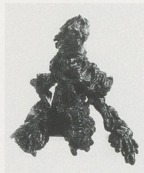
WILLEM DE KOONING, LARGE TORSO, 1974, bronze, 36 x 36 x 26 1/2" / GROSSER TORSO, Bronze, 91,5 x 91,5 x 67,3 cm.