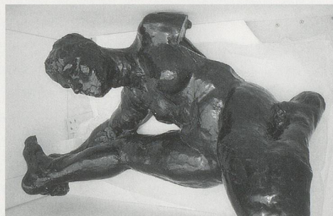
AUGUSTE RODIN, CROUCHING WOMAN, ca.1895, bronze, 20 3/4 x 13 3/8" / KAUERENDE FRAU, Bronze, 53 x 34 cm.