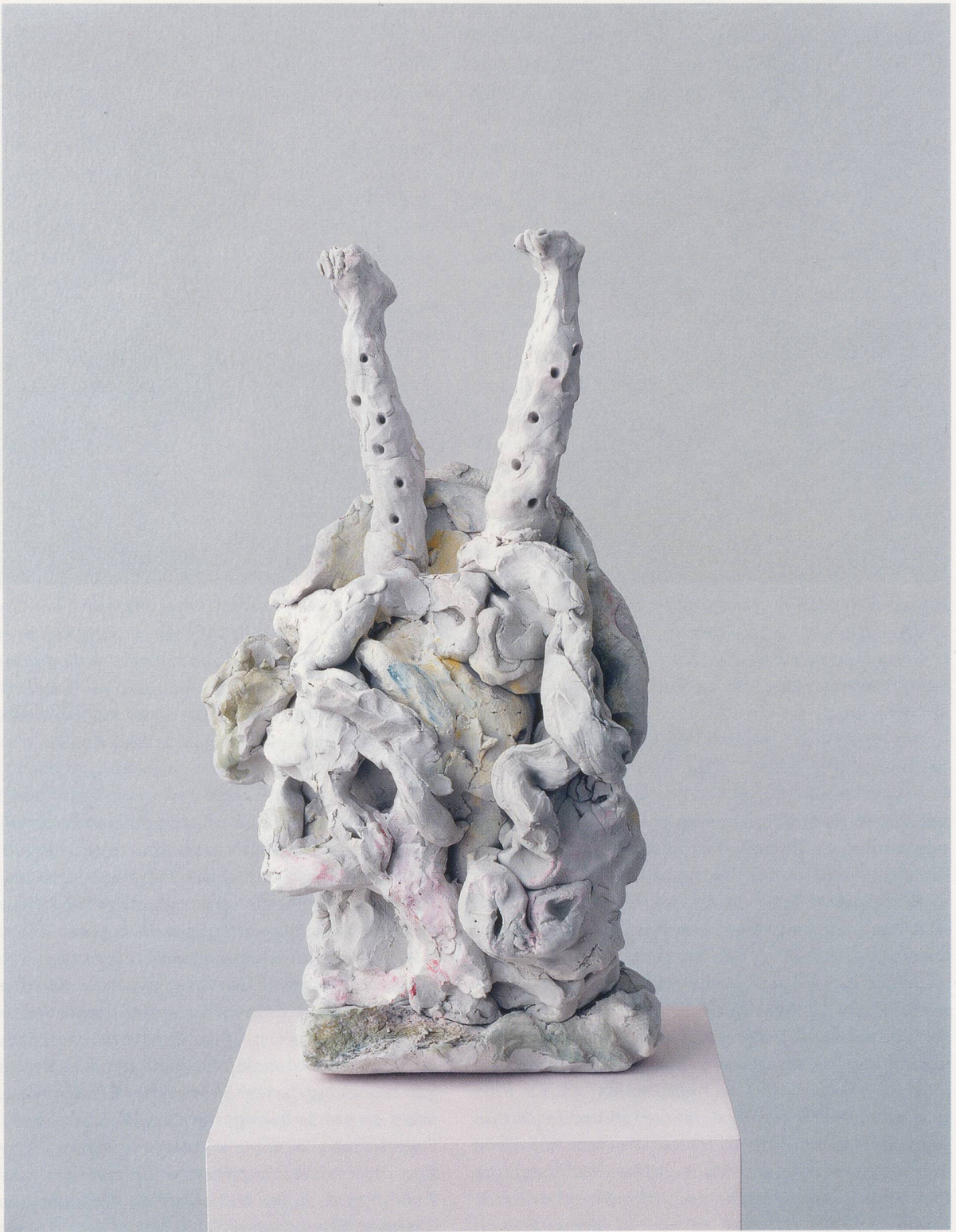
REBECCA WARREN, HUNDEMEISTER (Dog Master), 2004, reinforced clay, acrylic paint, 19 1/4 x 9 x 8 1/4" / verstärkter Ton, Acrylfarbe, 49 x 23 x 21 cm.