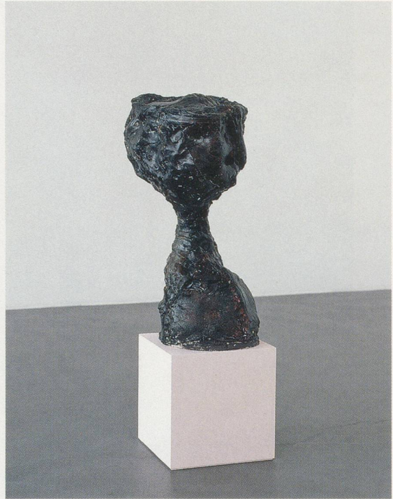
REBECCA WARREN, LIGHT OF THE WORLD , 2004, reinforced clay, acrylic paint, pom pom, 44 1/8 x 13 3/8 x 13 3/8" / LICHT DER WELT, verstärkter Ton, Acrylfarbe, Pompon, 112 x 34 x 34 cm.

ter, the piece-molds sometimes re-filled with fresh clay, the originals and the variations remaining in Rodin's possession for the rest of his life.