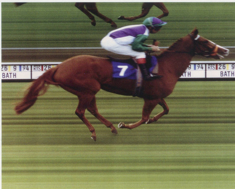
MARK WALLINGER, A REAL WORK OF ART , 26 September 1994, color photograph, 7 3/4 x 10" / Farbphotographie, 20 x 25,5 cm.

Prior to ECCE HOMO , Wallinger was probably best known for the way in which his particular take on cultural identity resulted in a truly unconventional artwork, a thoroughbred racehorse called A REAL WORK OF ART (1994). Wallinger's exploitation of a racehorse for artistic purposes showed that complex ideas could easily be transported in readily accessible forms. Ideas do not come much more complex than those framing the question of identity, and in his turf-inspired output from the 1990s, which culminated in A REAL WORK OF ART , Wallinger created an important body of work on the subject of nationality and belonging.