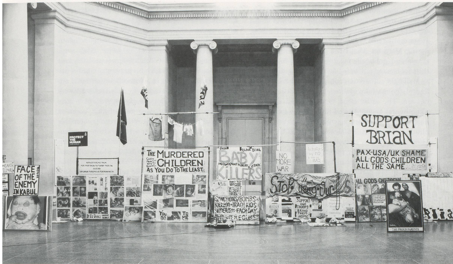
MARK WALLINGER, STATE BRITAIN , 2007, installation view and detail / Installationsansicht und Detail, Tate Britain.