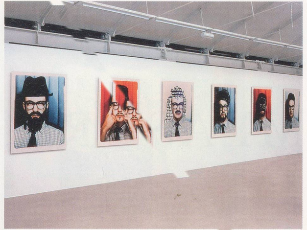
MARK WALLINGER, PASSPORT CONTROL , 1998, color photographs, 52 x 40" each / Farbphotographien, je 132 x 101,5 cm.

In der Tate Britain präsentiert Mark Wallinger ein Werk, das auf einer radikalen Neuinterpretation populärer Traditionen gründet. Seine Suche nach etwas Neuem in der unmittelbaren Vergangenheit ist wesentlicher Bestandteil einer Diskussion über künstlerische Hegemonie und Authentizität und