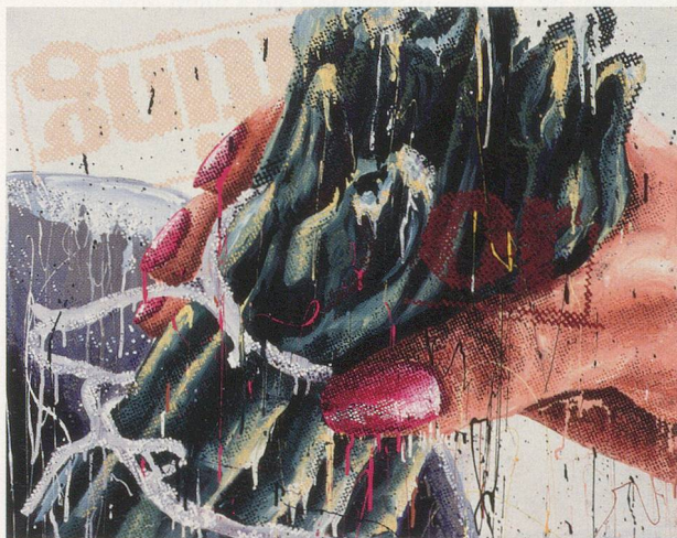
MARILYN MINTER, 100 FOOD PORN, enamel on metal, 24 x 30" / Lack auf Metall, 61 x 76 cm.