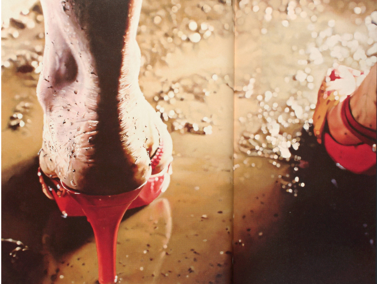
MARILYN MINTER, RED SLIPPERS, 2006, enamel on wood, 36 x 48 x 122 cm.