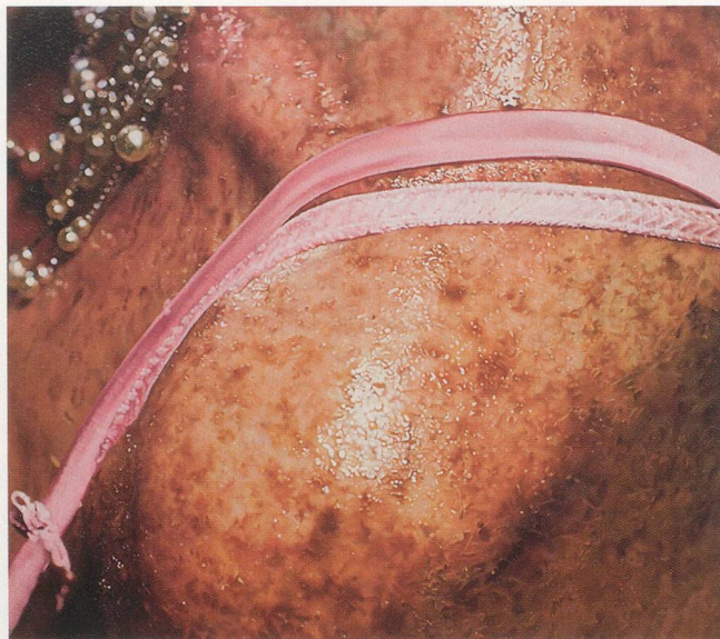
MARILYN MINTER, FRECKLES, 2006, enamel on metal, 60 x 86" / SOMMERSPROSSEN, Lack auf Metall, 152,5 x 218,5 cm.

Als die junge Künstlerin die Ausbeute ihren Mitstudenten zeigte, war deren negative Reaktion derart heftig, dass sie 26 Jahre lang keine Abzüge mehr machte und sie nicht mehr