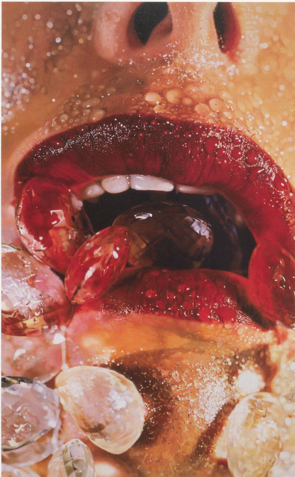
MARILYN MINTER, CRYSTAL SWALLOW, 2006, enamel on metal, 96 x 60" / KRISTALLENER SCHLUCK, Lack auf Metall, 244 x 152,5 cm.