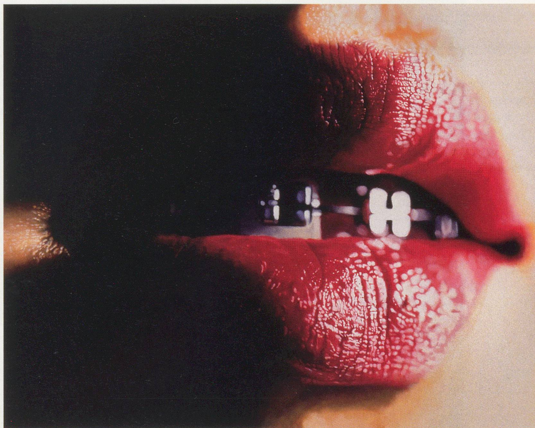
MARILYN MINTER, ARMOROUS, 2000, enamel on metal, 3 x 4' / Lack auf Metall, 91,5 x 122 cm.

CR: Du hast mich wegen eines Titels gefragt für das neue Bild von Stephanie Seymour mit ihrem kleinen Töchterchen, das du «Mutter mit Kind» nennen wolltest, dem du aber stattdessen den Titel IT'S MINE (Es ist meins, 2007)