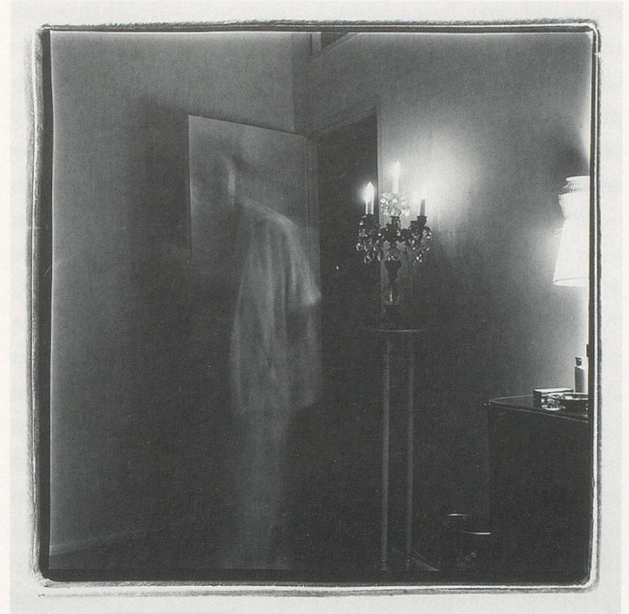
MARILYN MINTER, MOM IN NEGLIGEE / MOM MAKING UP / UNTITLED / MOM SMOKING / MOM DYEING EYEBROWS, Coral Ridge Towers series, 1969–1995, black-and-white photographs, 30 x 40" / MUTTER IM NEGLIGÉ / MUTTER SICH SCHMINKEND / OHNE TITEL / MUTTER RAUCHEND / MUTTER AUGENBRAUEN FÄRBEND, Schwarz-Weiss-Photographien, je 76 x 101,5 cm.