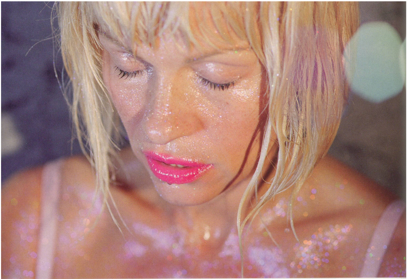
MARILYN MINTER, TWO GREEN FLARES, 2007, C-print, 50 x 36" / ZWEI GRÜNE REFLEXE, C-Print, 127 x 91,5 cm.