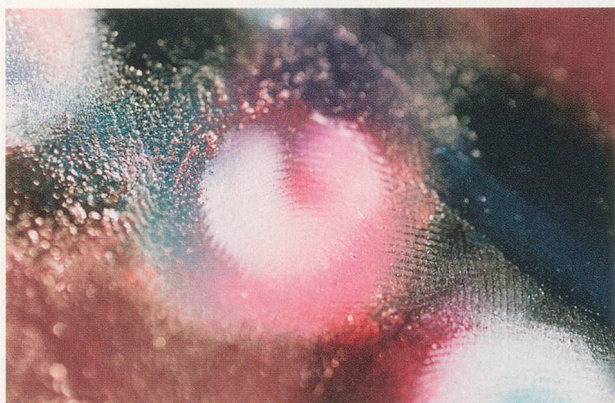
MARILYN MINTER, fingerprints / Fingerabdrücke , detail.

CR: Glaubst du, die Tatsache, dass Hainley diese Bilder erneut publik machte, hat dich dazu gebracht, die Photo-