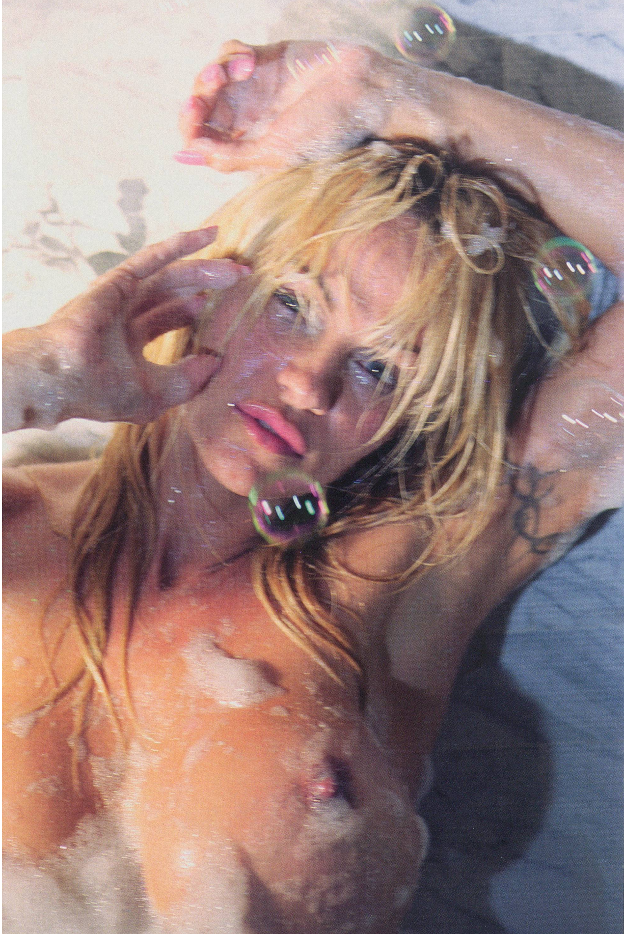
MARILYN MINTER, CENTERFOLD # 2, 2007.