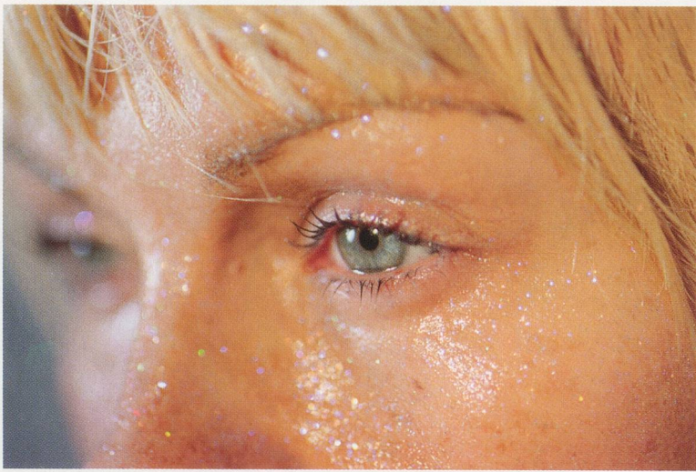
MARILYN MINTER, COOL BLUE, 2007.