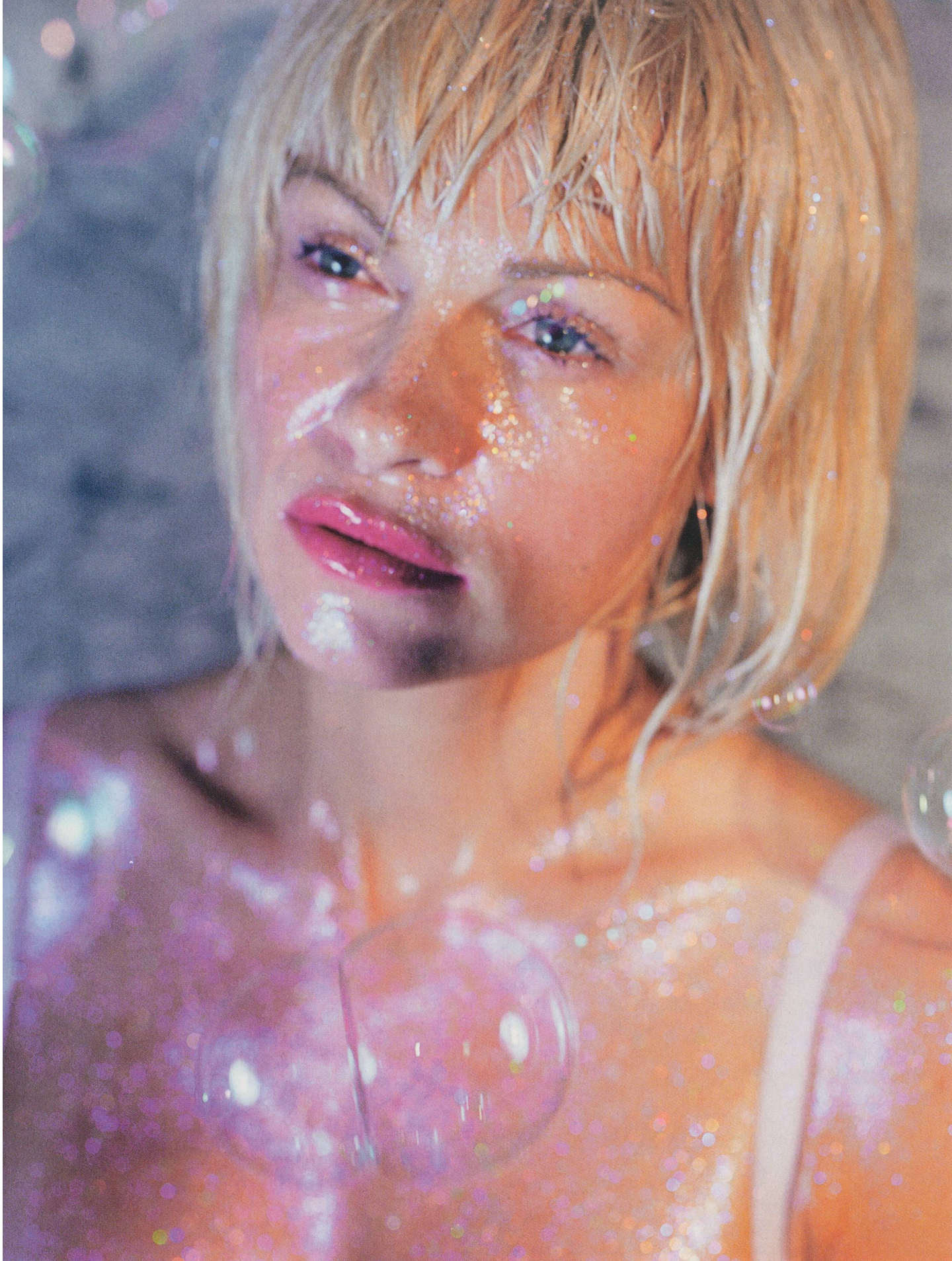
MARILYN MINTER, DOUBLE BUBBLE, 2007, C-print, 50 x 36" / DOPPEL-SEIFENBLASE, C-Print, 127 x 91,5 cm.