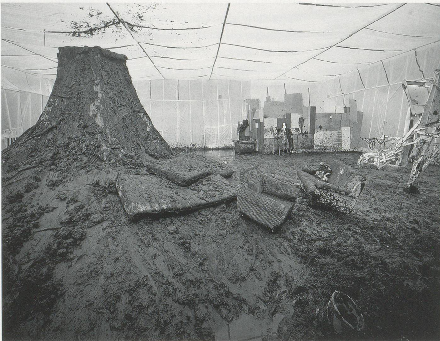
GELITIN, CHINESE SYNTHESE LEBERKÄSE, 2006, installation view / Installationsansicht, Kunsthaus Bregenz.