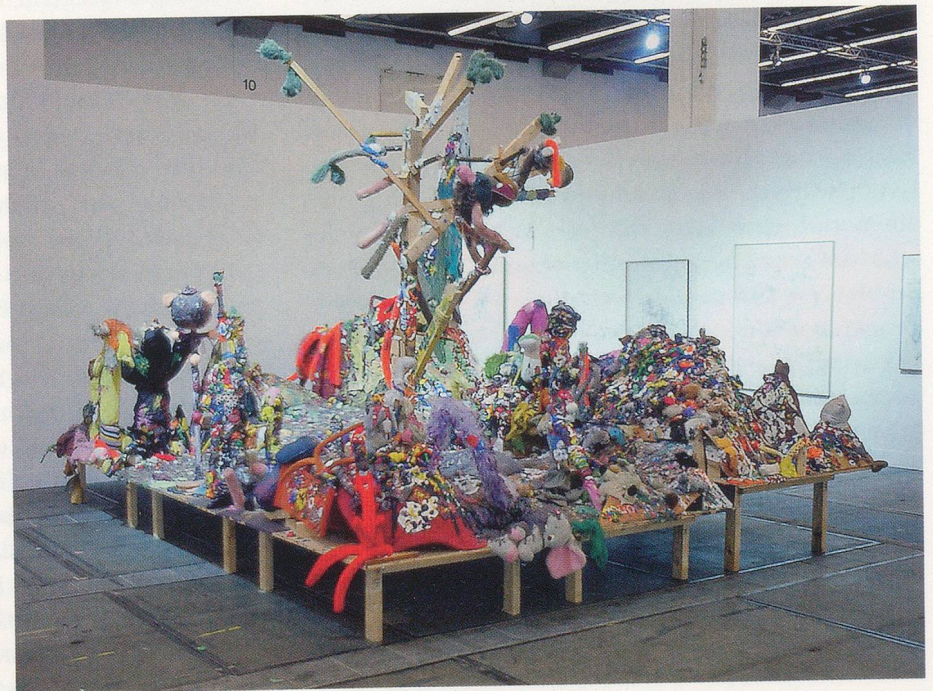
GELITIN, SCULPTURE FOR AN AIRPORT, 2006, Plasticine, wood, fabric, 147 1/2 x 195 x 118" / SKULPTUR FÜR EINEN FLUGHAFEN, Plastilin, Holz, Stoff, 375 x 495 x 300 cm.

Delirös bedeutet so viel wie de linia ire – «über die Linie» gehen, sie queren, auch verlassen. An dieser Verwegenheit gewachsen, sind Gelitin kaum mehr Abgrenzungs-Avantgardisten, wie es die österreichische Nachkriegs-Moderne im Wesentlichen war. Mentalitätsgeschichtlich bedeutet dies eine gelungene Absage an das Konzept des «romantischen Künstlergenies», welches aus Leidensinnerlichkeit «Wahrheitströpferln» herauspresst, um dann künstlerische Gegenwelten zu schaffen. So auch die Grössen der «Wiener Gruppe», welche um die «Verbesserung Mitteleuropas» 3) wissend noch Meisterliches vor Augen hatten. Generationsmässig ist Gelitin da nicht mehr mit dabei, dem Autoritätskern solchen Meistertums wird gründlich misstraut, was einem Reinhard Priessnitz schon seinerzeit nicht entgangen war. Kein Leidensdiplom soll mehr absolviert werden, Gelitins