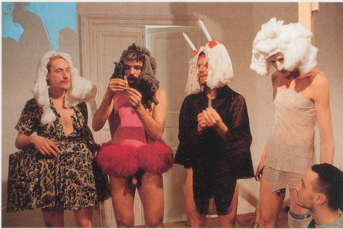
GELITIN, LES INNOCENTS AUX PIEDS SALES

( The Innocents with Dirty Feet ), 2005 /