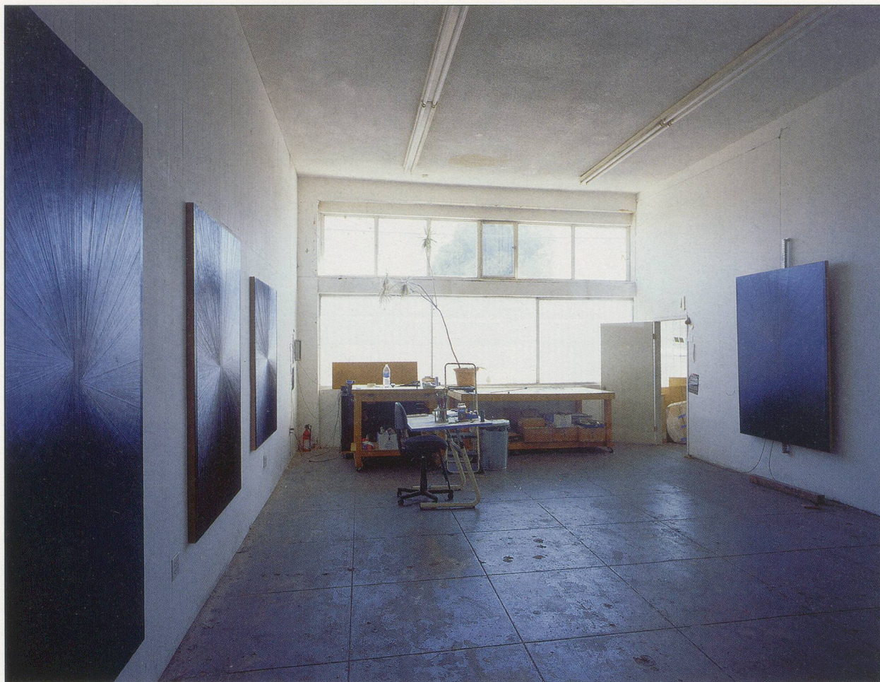
MARK GROTJAHN, studio views / Atelier Ansichten , 2007.

I first saw them, they gracefully invited my stare. Voluptuous, but at ease, each painting did not relinquish its overall sense of being a seamless whole, a thing, in other words, greater than the sum of its parts, even as careful inspection began to parse each painting's complex structure and reveal smaller nuances and details.