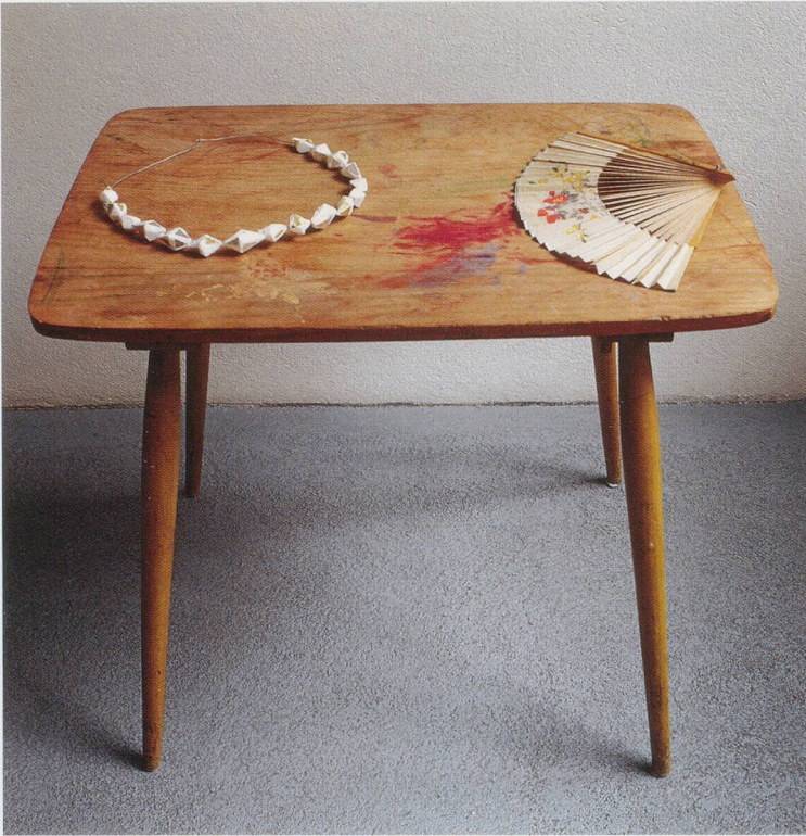
COSIMA VON BONIN, THE SENIOR MASTER , 1992, table, chain, fan, 24 3 / 4 x 27 1 / 2 x 19 1 / 2 " / DER OBERLEHRER , Tisch, Kette, Fächer, 63 x 70 x 49,5 cm.

Bei Cosima von Bonin gibt es nichts zu verstehen und schon gar nichts zu lernen. Die viel beschworene (und oft kritisierte) Hermetik ihrer Arbeiten wäre demnach nur ein Problem, wenn es überhaupt eine Lösung gäbe. Es gibt aber keine Lösung, denn es gibt auch keine Aufgabe und eine solche anzubieten, wäre innerhalb der Boninschen Setzung (oder besser: Legung) wiederum eine «Belästigung».