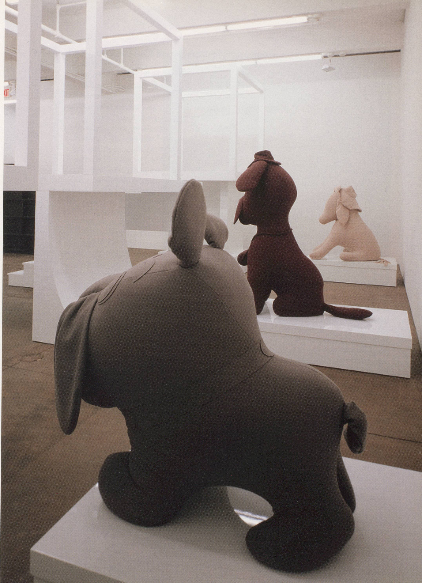
COSIMA VON BONIN. "Relax, it's only a Ghost," 2006. exhibition view, Friedrich Petzel Gallery / "Immer mit der Ruhe, es ist nur ein Geist", Ausstellungsansicht.