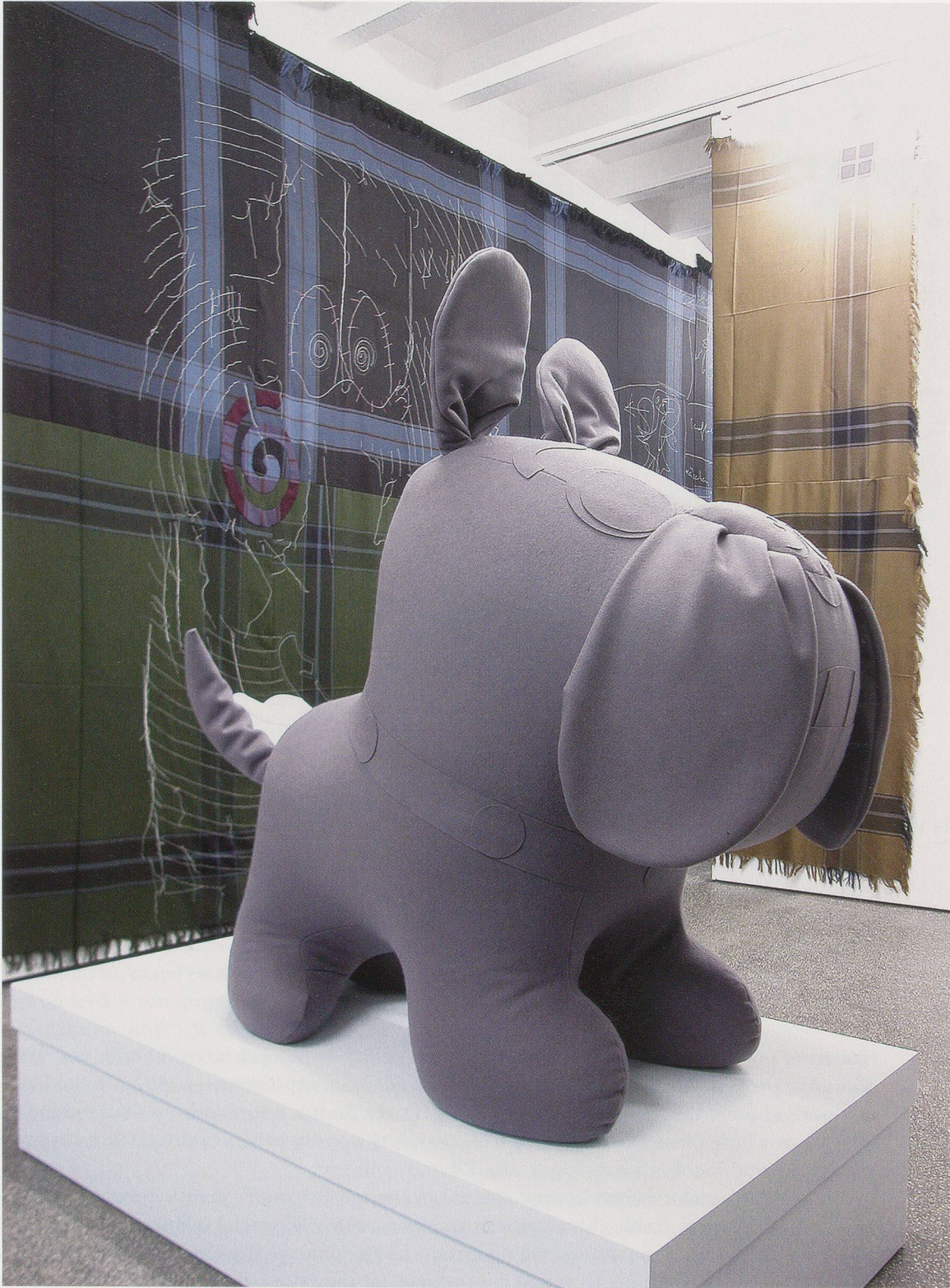
COSIMA VON BONIN, "2 Positions at Once," 2004, exhibition view, Kölnischer Kunstverein / "2 Positionen auf einmal", Ausstellungsansicht.