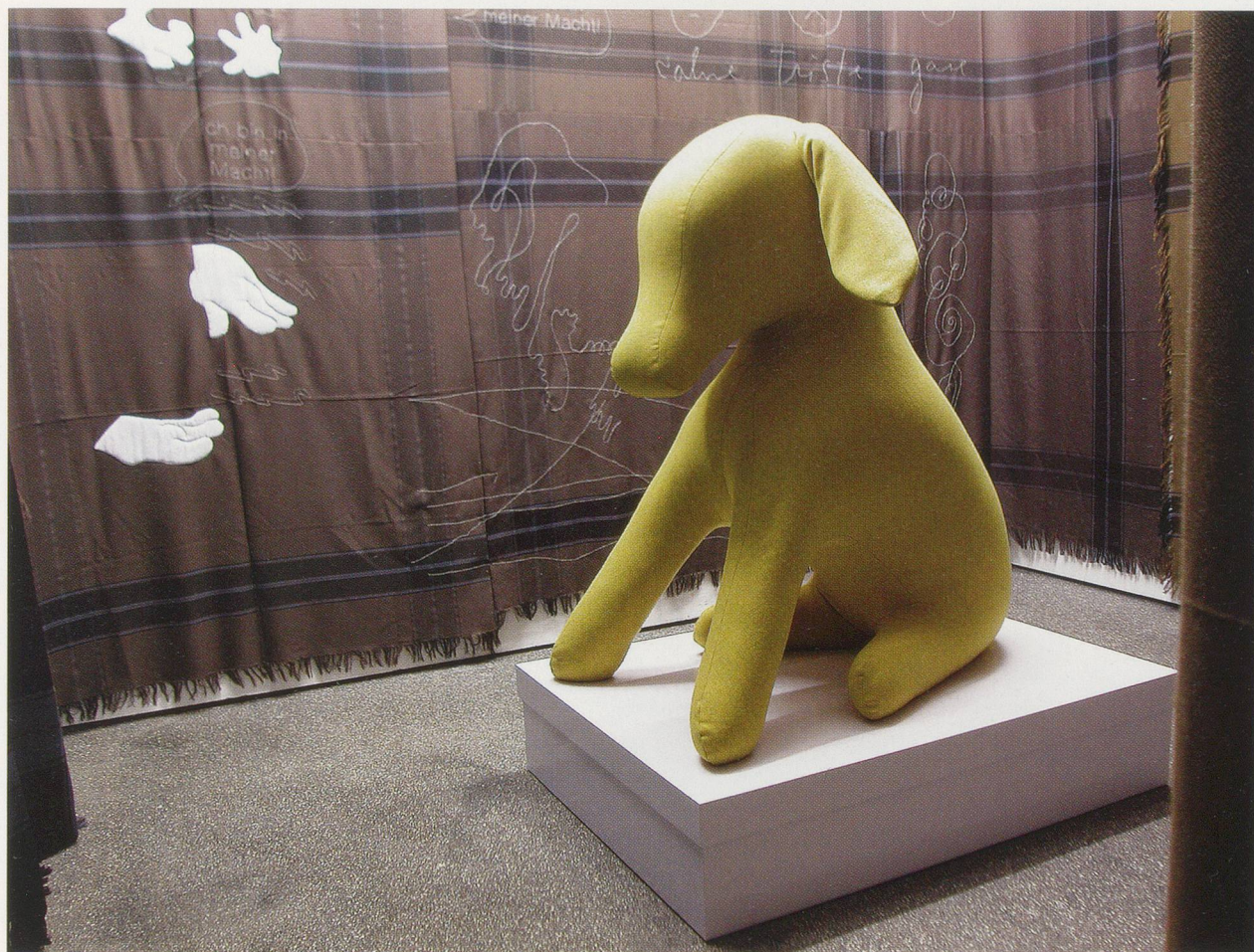
COSIMA VON BONIN, "2 Positions at Once," 2004, exhibition view, Kölnischer Kunstverein / "2 Positionen auf einmal", Ausstellungsansicht.