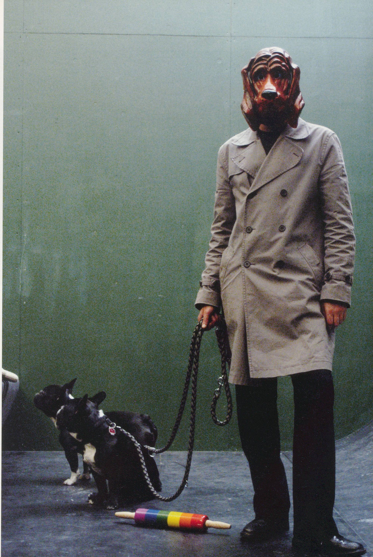
COSIMA VON BONIN, "2 Positions at Once," 2004, exhibition view, Kölnischer Kunstverein / "2 Positionen auf einmal", Ausstellungsansicht.