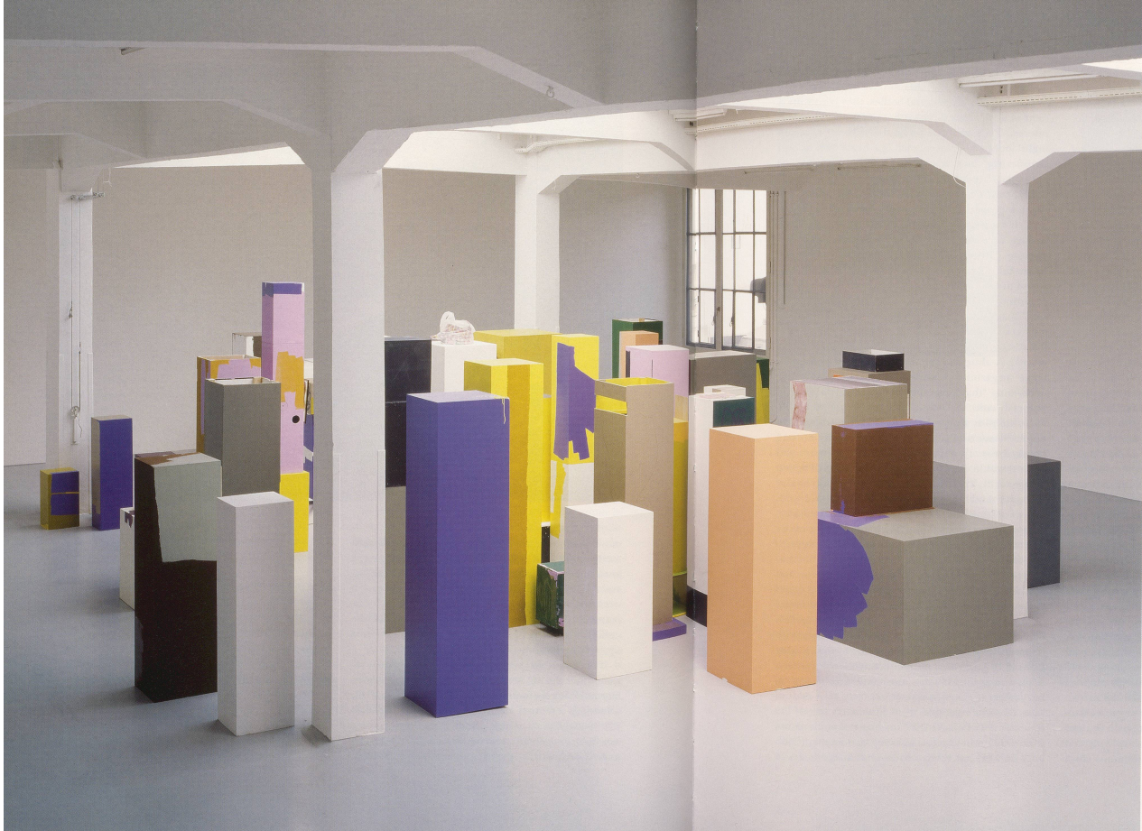
RACHEL HARRISON, TREES FOR THE FOREST, 2007, pedestals, paint, anonymous paintings, blanked, CD-R discs, canned pineapple, plastic wrap, bubble wrap, pink tissue, Pearl River candy, bag, portable radio, poster, magazines, dimensions variable, installation view migros museum für gegenwartskunst, Zürich / BÄUME FÜR DEN WALD, Sockel, Malerei, Gemälde, Decke, Disketten, Ananasdose, Plastikhülle, Blasenfolie, rosa Gewebe, Tasche, Kofferradio, Zeitschriften, Masse variabel, Installationsansicht.