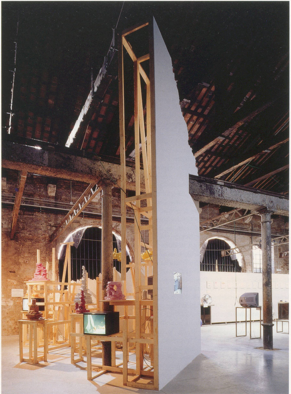
RACHEL HARRISON, INDIGENOUS PARTS 3 , 2003, wood, polystyrene, cement, Parex, acrylic, sheetrock, plexiglass, birthday candles, rubber gloves, video monitors, speakers, ant video, auction video, dimensions variable, installation view Venice Biennial / EINHEIMISCHE BESTANDTEILE , Holz, Polystyrol, Zement, Parex, Acryl, Spachtelmasse, Plexiglas, Geburtstagskerzen, Gummihandschuhe, Video-Monitore, Lautsprecher, Auktions-Video, Masse variabel, Installationsansicht Biennale Venetig.