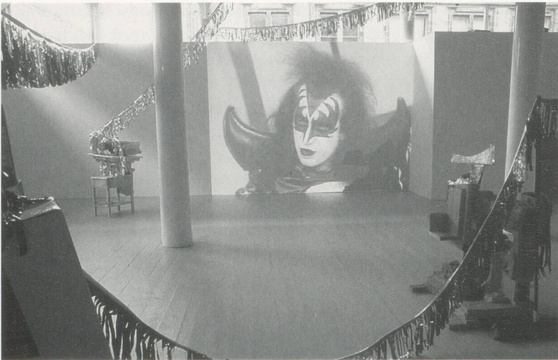
RACHEL HARRISON, CAR STEREO PARKWAY , 2005, installation view Transmission Gallery, Glasgow / Installationsansicht.

offenbar zufällige Details gelenkt. Die Assemblagen versprühen billige Wortspiele und ein Feuerwerk kultureller Querbezüge wie heisse Teaser, die einen tieferen Sinn versprechen – freilich nur den Ernsthaften und Leichtgläubigen. (Jene, die etwas für Titel übrig haben, die sich auf Claude Lévi-Strauss und Rainer Werner Fassbinder beziehen, sollten vielleicht einmal über die genaue Bedeutung des Songtitels «Jacques Derrida» der 80er-Jahre Post-Punk-Band Scritti Politti nachdenken, die für ihren Namen den italienischen Titel der politischen Schriften Antonio Gramscis, Scritti Politici , so verballhornt hat, dass er wie «tutti frutti» klingt.) 2)