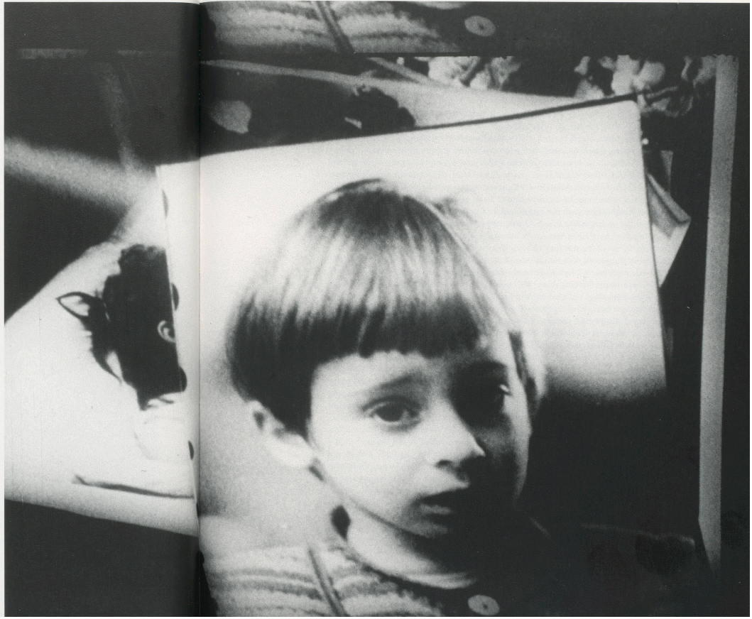
ROBERT FRANK, CONVERSATIONS IN VERMONT, 1969.