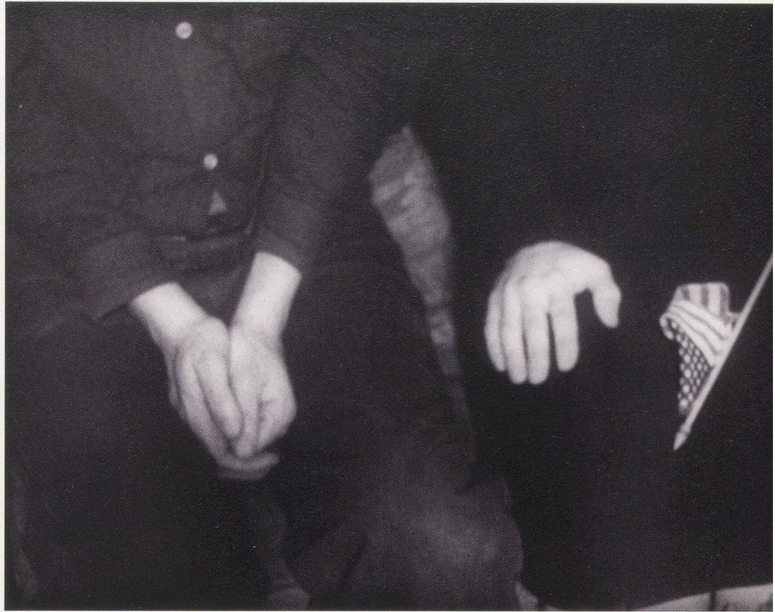
ROBERT FRANK, PULL MY DAISY, 1959.