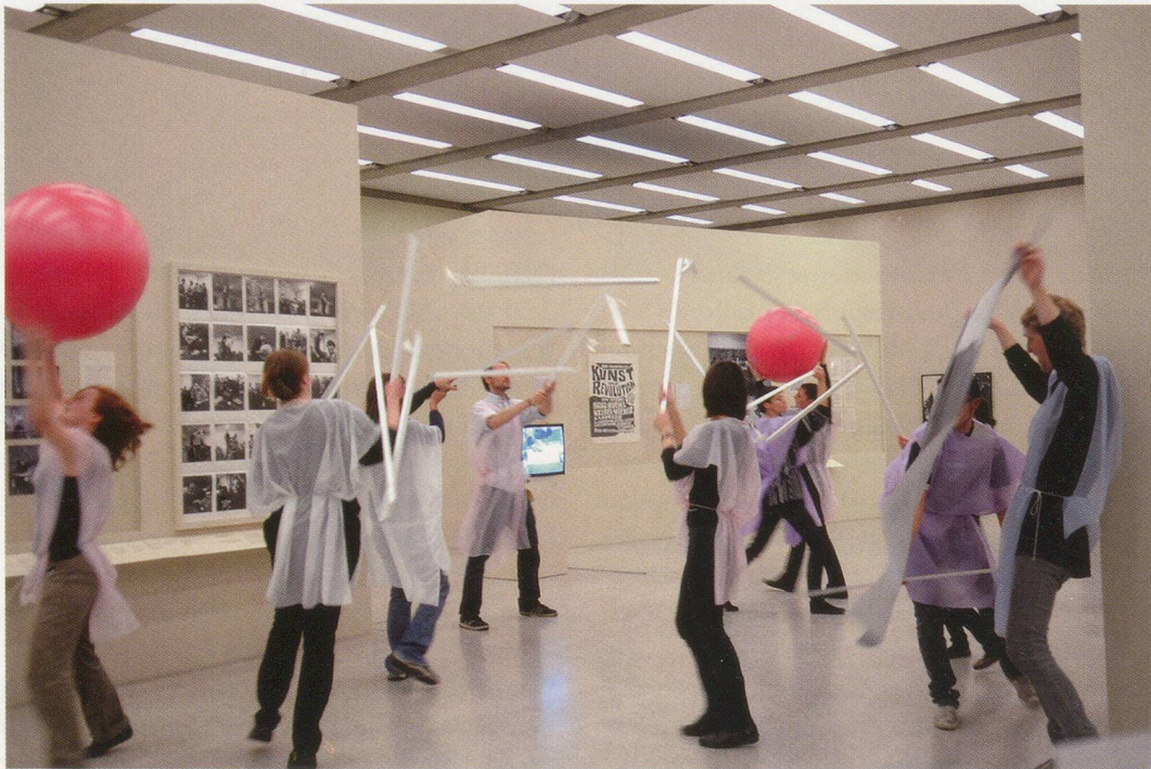
GRAND OPENING, CARRIER WAVES, 2008, performance, Museum Moderner Kunst, Vienna / TRÄGERFREQUENZEN, Performance.

Einige Monate später war ich an der Art Basel zu einem Abendessen eingeladen und aus privaten Gründen furchtbar deprimiert (ich hatte kein Geld, nicht einmal genug, um mir ein Ticket Richtung Heimat zu kaufen). Im Wissen darum, dass ich jemanden würde bitten müssen, mir 60 Euro zu lei-