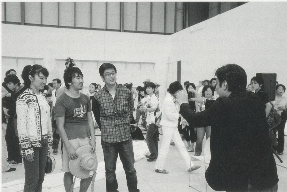
EI ARAKAWA, YUMING CITIES, homelessness, 2008, performance, Yokoyama / YUMING STÄDTE, Obdachlosigkeit, Performance.

At the same time, it would seem that Arakawa intrinsically operates in the territories of the "in-between"—in-between in every sense; in-between the words of some texts, or of some bigger script hidden behind his work. Such scripts could only be following the logic of some text, as they become exemplified,