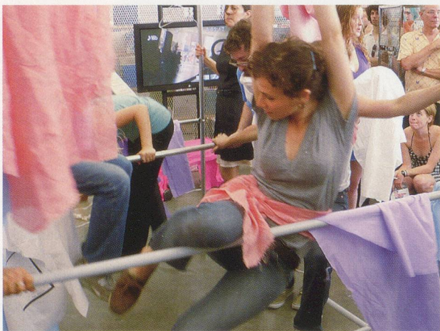
EI ARAKAWA, KISSING THE CANVAS (postponed) , 2008, performance, New Museum, New York / DIE LEINWAND KÜSSEN (verschoben) , Performance.

The first time I met him was on one of those Saturdays that had become more and more determined by administrative activities and, even worse, information-hungry gallery visitors who misunderstood my role of artist/gallerist as that of a kind of information-dispensing grandmother. So one Saturday while I was, as always, fearfully dreading the imminent profession-related questions, I observed in the corner window the presence of someone who surprisingly