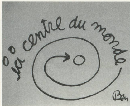
BEN VAUTIER, HOMMAGE À SALVADOR DALÍ (Here, Center of the World), CA. 1999.