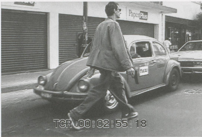
FRANCIS ALÿS (IN COLLABORATION WITH RAFAEL ORTEGA), RE-ENACTMENTS, 2001, video still / RE-INSZENIERUNG, Videostill.

the audience also warrants skepticism, suggesting an institution scrambling to reassert its relevance against the perceived risk of obsolescence.