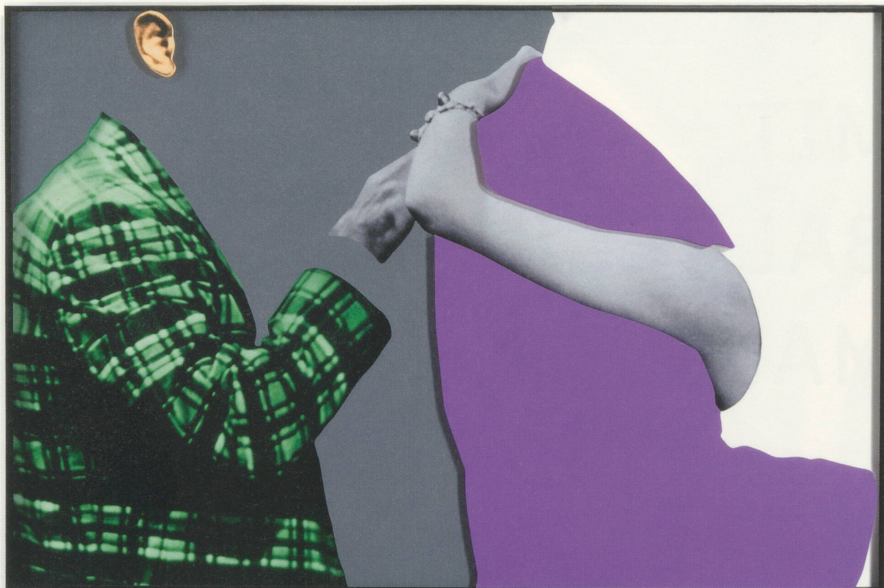
JOHN BALDESSARI, ARMS & LEGS (SPECIF. ELBOWS & KNEES), ETC.: ARM AND PLAID JACKET (GREEN), 2007, three-dimensional archival print, laminated with Lexan, mounted on Sintra, acrylic paint, 59 x 89 1/4" / ARME & BEINE (BES. ELLBOGEN & KNIE), ETC.: ARME UND KARIERTE PLAID-JACKE (GRÜN), dreidimensionaler alterungsbeständiger Print, laminiert mit Lexan, aufgezogen auf Sintra, Acrylfarbe, 149,9 x 226,7 cm.

opening French windows. Here, in the territory of the absurd, we are at home once more. But Baldessari's working method turns out to be more universal than we thought. His work recalls a philosophy that wished art well—although a different sort of art.