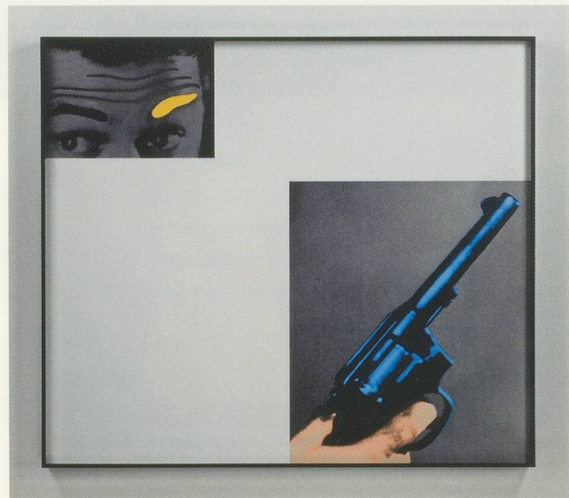
JOHN BALDESSARI, RAISED EYEBROWS / FURROWED FOREHEADS: (WITH GUN), 2008, three-dimensional archival print, laminated with Lexan, mounted on Sintra, acrylic paint, 58 1/8 x 66 1/8 x 4" | HOCHGEZOGENE AUGENBRAUEN / GERUNZELTE STIRNEN: (MIT PISTOLE), dreidimensionaler alterungsbeständiger Print, laminiert mit Lexan, aufgezogen auf Sintra, Acrylfarbe, 147,6 x 168 cm.

ALEXANDER VAN GREVENSTEIN ist Direktor des Bonnetantenmuseum in Maastricht.