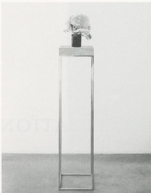
CAROL BOVE, CORAL SCULPTURE, 2008, coral, driftwood, concrete, bronze, 61 x 12 x 12" / KORALLENSKULPTUR, Koralle, Treibholz, Beton, Bronze, 154,9 x 30,5 x 30,5 cm.

ganzen Strauss gemischter Gefühle frei – über Berkeley als Wohnort und viel geschmähtes Refugium für Hippies –, die in ihrem Werk immer wieder auftauchen. Die Ethik der Gegenkultur hat viel Gutes bewirkt, obwohl die Generation, nachdem sie ihrem jugendlichen Enthusiasmus entwachsen war, sich in anderen Bereichen harte Kritik gefallen lassen muss. Schliesslich hat das Kaufen dessen, was alle anderen haben, etwas sehr Trauriges, das auf eine menschliche Sehnsucht und Einsamkeit hindeutet, besonders wenn das Gekaufte völlig irrational ist – eigentlich ist es eine Klage, ein Ausdruck des Dazu-gehören-Wollens. (Man vergleiche dazu Boves CORAL SCULPTURE (Korallenskulptur, 2008), ein Stück Unterwasserwelt auf einem hohen Sockel und Rückblende in eine Zeit, als alle Muscheln und Ähnliches in ihren Badezimmern hatten.)