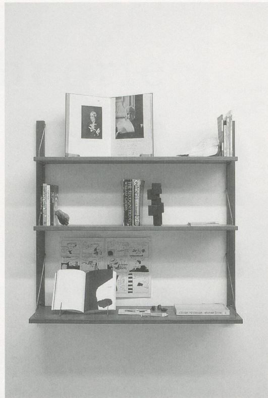
CAROL BOVE, INNERSPACE BULLSHIT , 2007, wood and metal shelves, 14 books, comic book, bronze sculpture, stone, sea shell, seeds, mirror, pamphlet, 42 x 35 x 12" / INNENRAUM-UNSINN , Holz- und Metallregale, 14 Bücher, Comic-Album, Bronzeskulptur, Stein, Muschel, Samen, Spiegel, Broschüre, 106,7 x 88,9 x 30,5 cm.