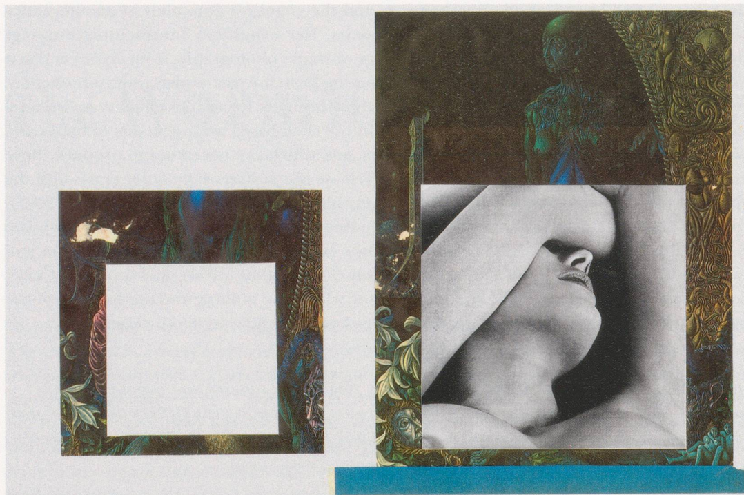
CAROL BOVE, MIRROR OF VENUS , 2007, collage, 12 x 16" / SPIEGEL DER VENUS , Collage, 30,5 x 40,6 cm.

McClure is a sixties icon of sorts, but one with a lot of Beat—that is to say, a lot of forties and fifties—in him: in 1955 he read at the legendary Gallery Six poetry evening in San Francisco, where the Beats cohered. (The druggy freedoms of the sixties were rehearsed a decade or so earlier by this group, who perpetuated themselves into the later period: not least via Jack Kerouac's muse Neal Cassady serving as the bus driver for Ken Kesey's LSD pioneers, The Merry Pranksters.) McClure advises the reader that the purpose of the joyously onomatopoeic, almost pre-linguistic poems in Ghost Tantras is "to bring beauty and change the shape of the universe," but then notes his inspirations as including William Blake and "the visionary Surrealists." 2 ) The throwback Cubist sculpture, meanwhile, is equally atemporal and slippery: here, the sixties are interpenetrated by the 1910s, just as McClure's professed lineage interweaves them with the Romantic era and the Surrealist thirties; in each case, it is the acts of older practitioners continuing to operate in the sixties that allow that moment to open onto earlier ones.