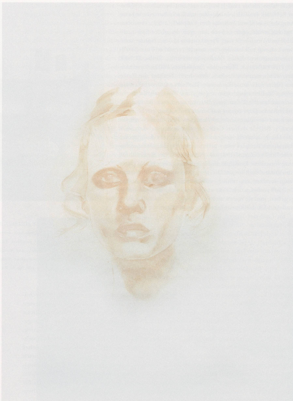
CAROL BOVE, LESLIE , 2006, ink on paper, 22 x 16" / Tinte auf Papier, 55,9 x 40,6 cm.