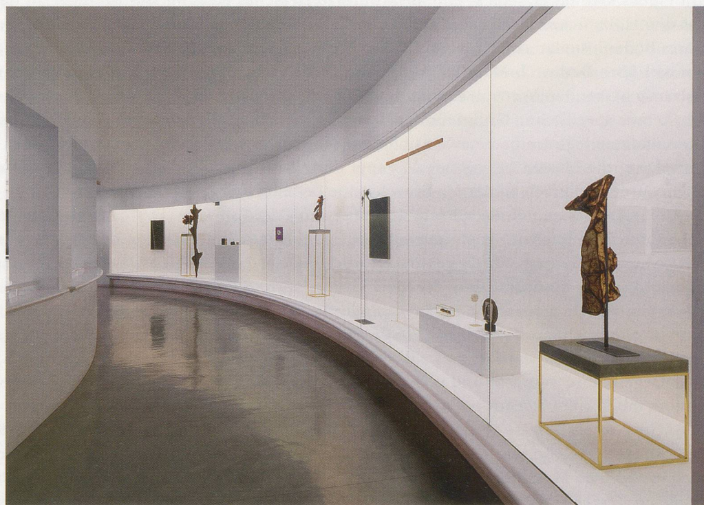
CAROL BOVE, Tate St. Ives, Cornwall, 2009 , exhibition view / Ausstellungsansicht.

Bove scheint von der Idee des Surrealismus und seinen Innovationen fasziniert zu sein, besonders wenn er als eine Art unterschwelliger Impuls auftritt – wie in den 60er-Jahren und ganz allgemein im letzten Jahrhundert. «SETTING» FOR A. POMODORO («Szenischer Rahmen» für A. Pomodoro, 2005–2007) – ein typisches Beispiel für die jüngst entstandenen, umfassenderen Objektarrangements am Boden oder auf einer Bühne – ist eine ausladende Komposition aus Bahnschwellen, spindeldürrem Treibholz, massigen Betonklötzen, der Miniaturversion einer Kugelskulptur von Arnaldo Pomodoro und – in einer späteren Version