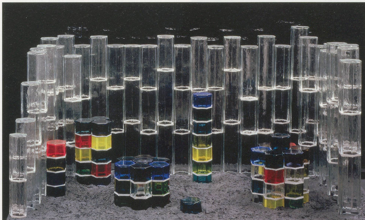
JOSIAH McELHENY, MODEL FOR A FILM SET (THE LIGHT SPA AT THE BOTTOM OF A MINE), 2008, Hand-blown colored glass modules, cement, wood, 37 x 37 1/2 x 68" / MODELL FÜR EIN FILMSETTING (DAS LICHTBAD IN EINEM MINENSCHACHT), mundgeblasene Glasmodule, Zement, Holz, 94 x 95,3 x 172,7 cm.

creatures" for whom "humanlikeness—a principle of humanism—is something they reject." 3)