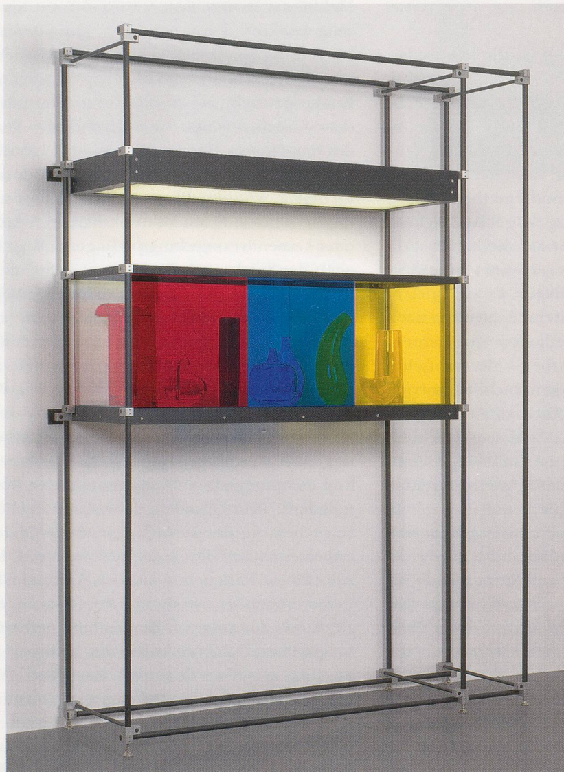
JOSIAH McELHENNY, CHROMATIC MODERNISM (RED, BLUE, YELLOW), 2008, hand-blown glass, colored laminated sheet glass, low-iron sheet glass, anodized aluminum, lighting, 86 3/8 x 61 7/8 x 19 1/4" / CHROMATISCHER MODERNISMUS (ROT, BLAU, GELB), mundgeblasenes Glas, farbige laminierte Glasscheibe, eisenarme Glasscheibe, eloxiertes Aluminium, Beleuchtung, 219,4 x 155,8 x 48,9 cm.

ferenz abzugewinnen (denn das Kind erlebt dieselbe Gutenachtgeschichte jedes Mal neu), sondern auch um sich aus dieser Differenz eine alternative Welt zu schaffen. Jeder Widerstandsversuch gegen die «objektivierten Codes und materialisierten Grammatiken, die ... uns restlos umgeben wie Fruchtwasser», schreibt Virno, «reaktiviert die Kindheit. Das heisst, der zähflüssige Zustand der «sprachlichen Umwelt» löst sich auf und in der Sprache wird das wiederentdeckt, was die «Welt» versetzt und schafft. ... [D]ie Kindheit lebt fort in jener hypothetischen Sprache, die Möglichkeiten jenseits des Status zum Vorschein bringt.» 17)