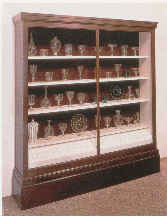
JOSIAH McELHENY, VERZELINI'S ACTS OF FAITH (GLASS FROM PAINTINGS OF THE LIFE OF CHRIST), 1996, hand-blown glass objects, wood display case, text, 79 x 73 x 15" / VERZELINIS GLAUBENSAKTE (GLAS VON GEMÄLDEN DES LEBENS CHRISTI), mundgeblasene Glasobjekte, Holzvitrine, Text, 200,6 x 185,2 x 38 cm.

In der Literatur zum Werk McElhenys wird wiederholt darauf hingewiesen, wie sehr er der Glasbläsertradition verpflichtet ist, die seit dem Mittelalter in jahrelanger Lehrzeit vom Meister an den Gesellen weitergegeben wird. Manche Kritiker schliessen vorschnell, McElheny kehre zum Handwerks- und Schönheitsideal früherer Zeiten zurück, und verquicken ihr Urteil mit einer pauschalen Absage an die Ironie und den Relativismus der Postmoderne. Dabei geht McElheny weitaus nuancierter mit dem postmo-