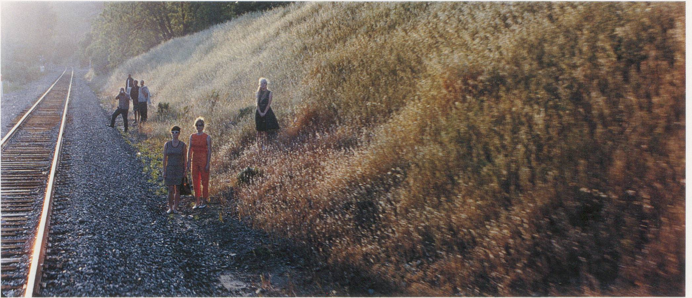
PHILIPPE PARRENO, JUNE 8, 1968, 2009, film stills, 70 mm film, approx. 8 min. / 8. JUNI, 1968, Filmstills, 70-mm-Film, ca. 8 Min.