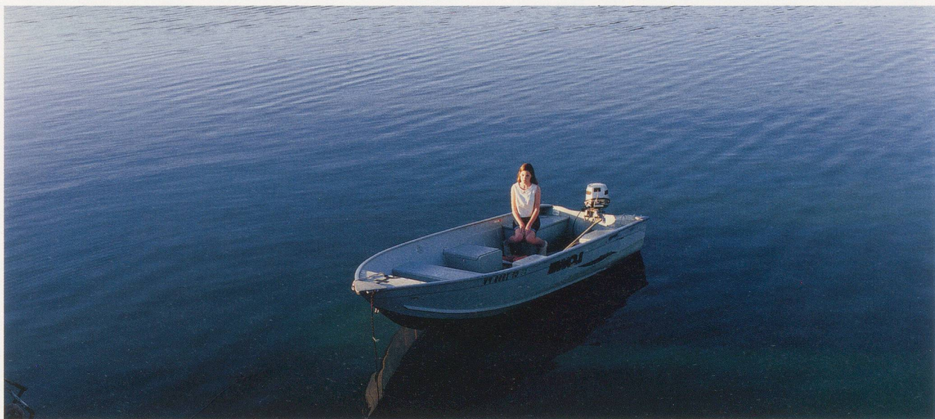
PHILIPPE PARRENO, JUNE 8, 1968, 2009, film still / 8. JUNI, 1968, Filmstill.