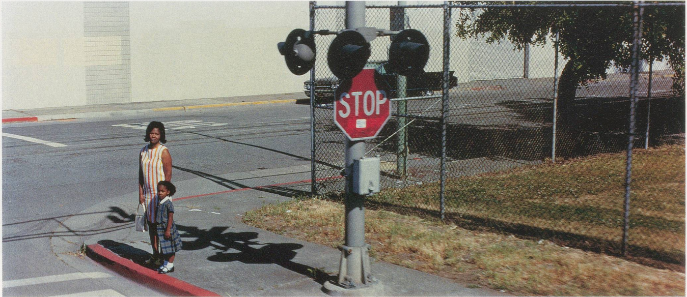
PHILIPPE PARRENO, JUNE 8, 1968, 2009, film still / 8. JUNI, 1968, Filmstill.

laubt hätten, wesentliche Fragen zu beantworten: Wer hat geschossen, von wo, und wie viele Male?