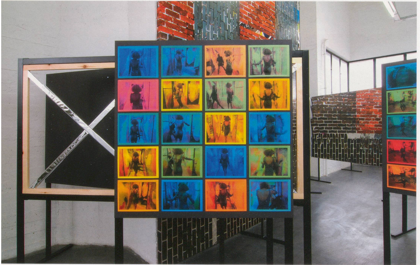
KELLEY WALKER, WHITNEY THE GREATEST HITS – HOW WILL I KNOW: ARISTA 2000 , 2008, aluminum stands, mylar, mirror, Epson prints, disco ball with chain, wood, fluorescent tubes, dimensions variable, installation view, Wiels, Centre d'Art Contemporain, Brussels, 2008 / Aluminiumständer, Folie, Spiegel, Epson-Prints, Discokugel mit Kette, Holz, Leuchtstoffröhren, Masse variabel, Installationsansicht.