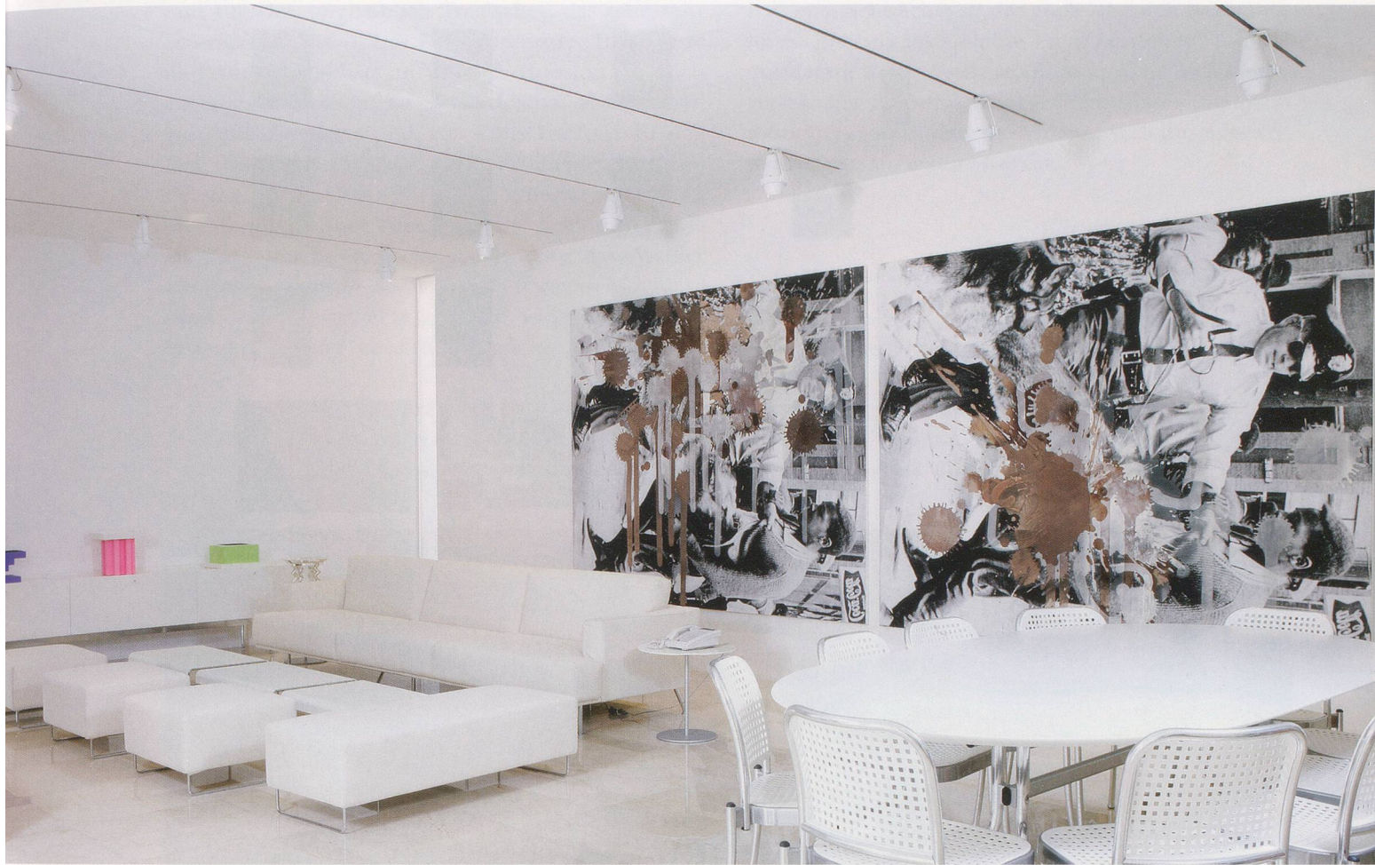
KELLEY WALKER, BLACK STAR PRESS (ROTATED 90 DEGREES) , BLACK PRESS , BLACK STAR , 2006, digital prints on canvas with silkscreened chocolate, installed by Carlos and Rosa de la Cruz, diptych, 83 x 104" each; 83 x 208" overall / Digitale Prints auf Leinwand, mit siebgedruckter Schokolade, installiert von Carlos und Rosa de la Cruz, Diptychon, je 211 x 264,2 cm, total 211 x 528,4 cm.

schen und politischen Zusammenhang und daher beliebig verwendbar.