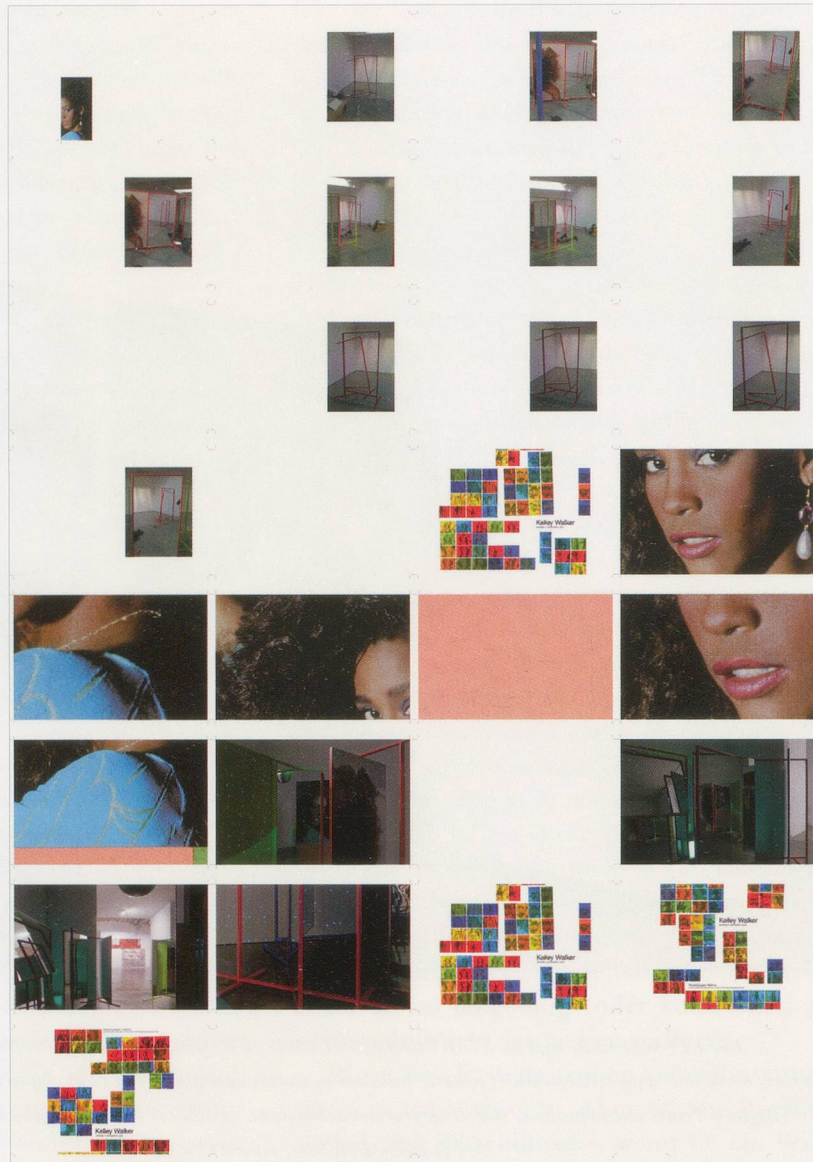
KELLEY WALKER, GRAMMY AWARD 1986, 2009, 2 offset press sheets, front and back, 40 x 28" each / 2 Offsetsdrucke, Vorder- und Rückseite, je 101,6 x 71,1 cm.

der Rassenzugehörigkeit ihres Urhebers oder Benutzers bestimmt. Kelley Walker ist weiss? Bewohner jenes Gelobten Landes würden bei dieser Neuigkeit nur mit der Schulter zucken. Die Wirkung seiner Werke wäre dann nicht mehr auf die Übertretung von (bis dahin ohnehin überholten) Rassentabus angewiesen (wie es bei seinen mit Zahnpasta und Schokolade beschmierten Bildern schwarzer Menschen gegenwärtig der Fall ist) und entspränge stattdessen ihrer Fähigkeit, den komplizierten Prozess