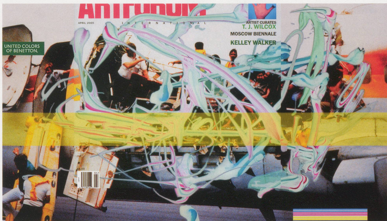
OHNE TITEL, Lichtkasten mit Duratrans, 154,3 x 304,8 x 10,2 cm.