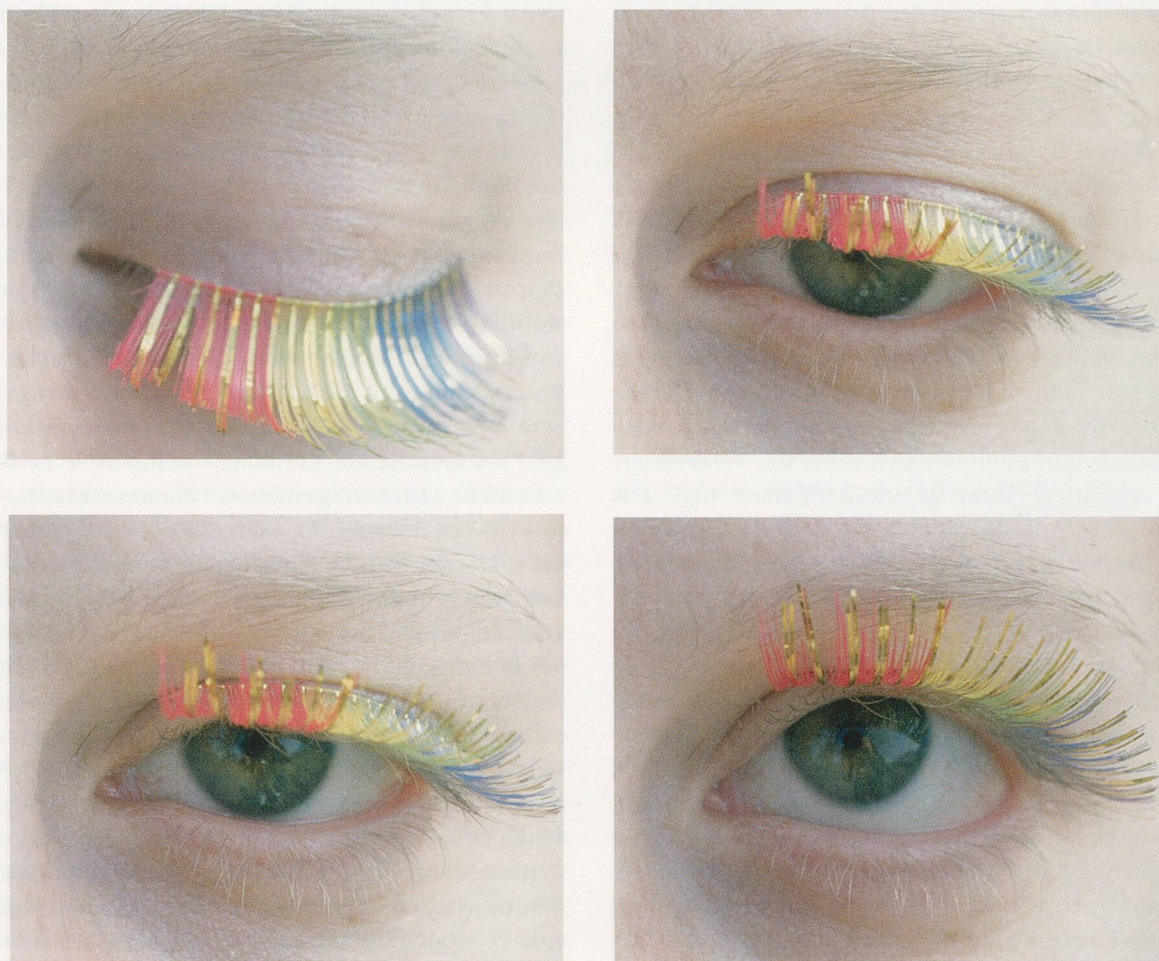
ANNETTE KELM, BACKSTAGE, 2004, c-print, 4 parts, 16 1/2 x 59 1/4 x 1 1/4" / C-Prints, 4 Teile, 42,2 x 150,4 x 3,3 cm.

Durch diesen seltsamen Umstand war die Photographie in den späten 70er-Jahren zu einer vollkommen polarisierten Domäne der Kunst geworden. Die