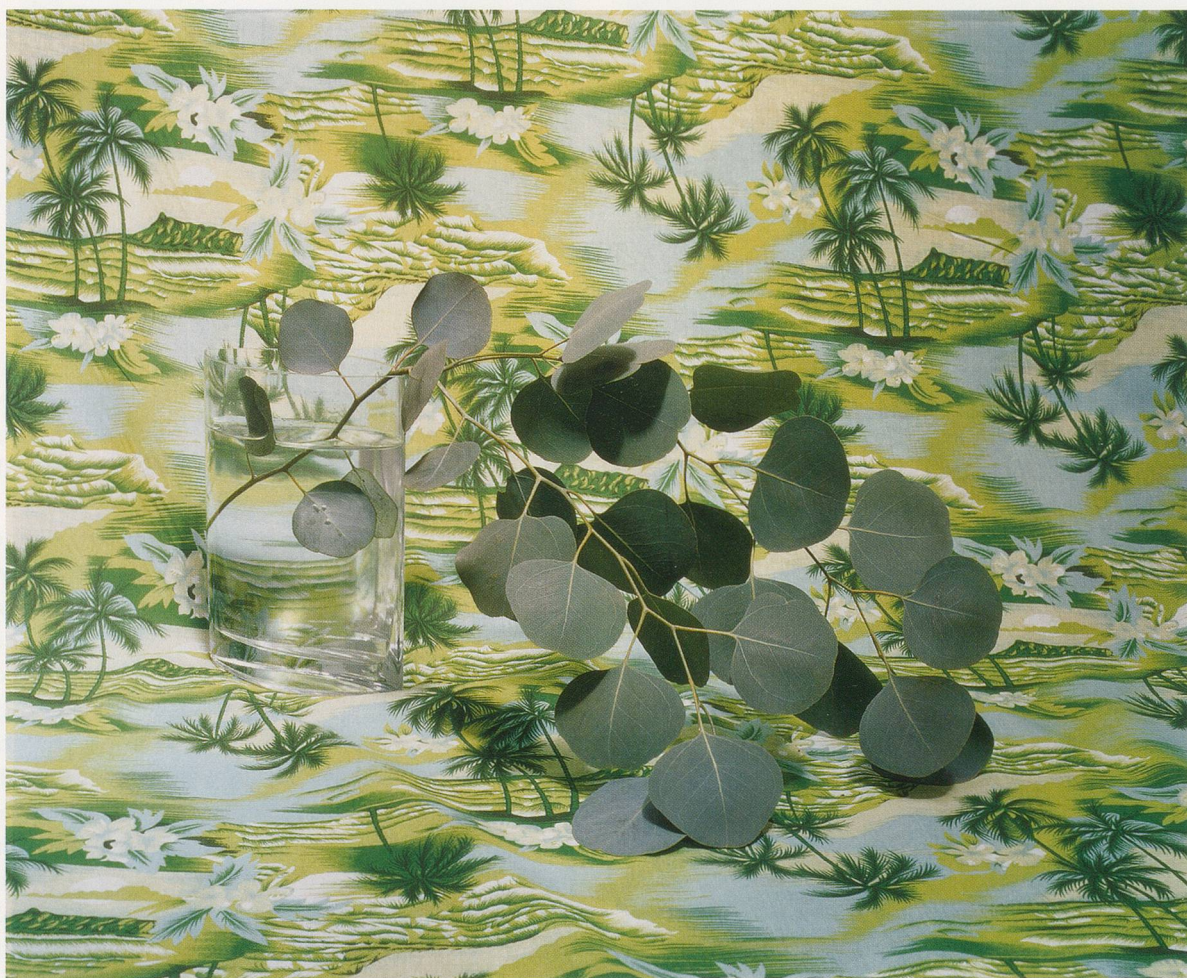
ANNETTE KELM, AFTER LUNCH TRYING TO BUILD RAILWAY TIES , 2005, c-print , 20 x 24" / NACH DEM MITTAGESSEN, VERSUCH EISENBAHNSCHWELLEN ZU BAUEN , C-Print , 50,8 x 61 cm.