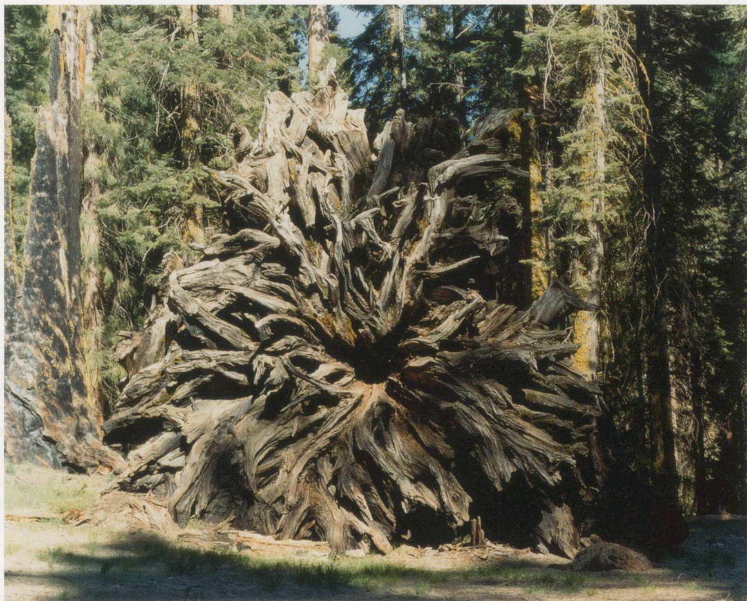
ANNETTE KELM, MIL ARRUGAS, 2005, c-print, 20 x 23 1/2" / TAUSEND FURCHEN, C-Print, 50,8 x 60 cm.

perverse form of preservation. Anachronistic as they may seem today, these polarities continued well into the following decade, and by now, the urgency once ascribed to photography in the discussion of the politics of art has waned, swept under the rug with other unfinished business. In the wake of this stalemate, the production of photographs in art appears to have suffered from a curious bout of self-inflicted amnesia: rather than being instrumental, it parodies the instrumental, abandoning any aspiration to a revolutionary project for the pictorialism of a pre-modern Beaux Arts, retroactively inserting itself into the tradition of the autonomous art object, or the taxonomies of the archival document, and blindly into its thoroughly disassembled instrumentality. Its contingent conventions, its elasticity of distribution