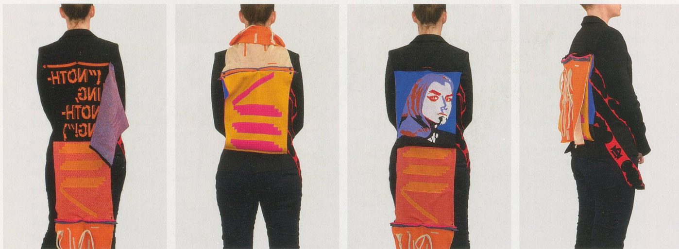
Parasite Patch „NOTHING NOTHING“, Design layers / Design Variationen

Auflage 18 / X für jede Version, mit signiertem und nummeriertem Zertifikat.