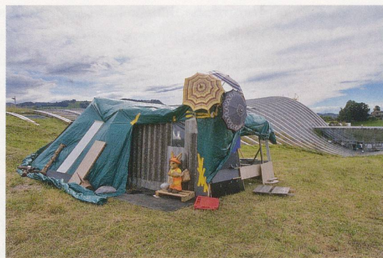
Villa Gelitin, 2007.

submissions to become fellows at the Summer Academy. The past five years provide ample proof of the urgent need to explore the social and intellectual significance of the artist in our decade. Under the open-ended guidance of the curators, participants investigate the current art trade, both in theory and practice, their debate frequently focusing on such issues as the collective and the individual, knowledge, and spontaneity and process.