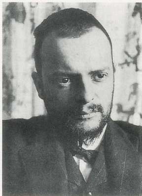
Paul Klee, 1911.