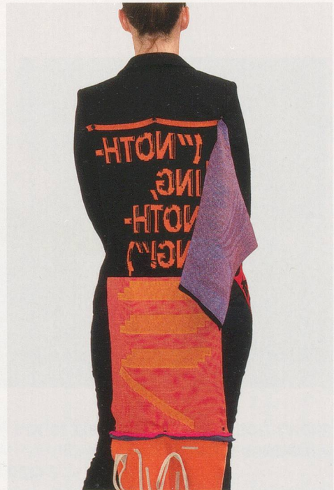
PARASITE PATCH „NOTHING NOTHING“

Knitted textile patch with 4 design layers, made of custom dyed yarns, each layer: 15 x 12".