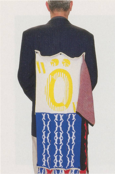
PARASITE PATCH „Ö“