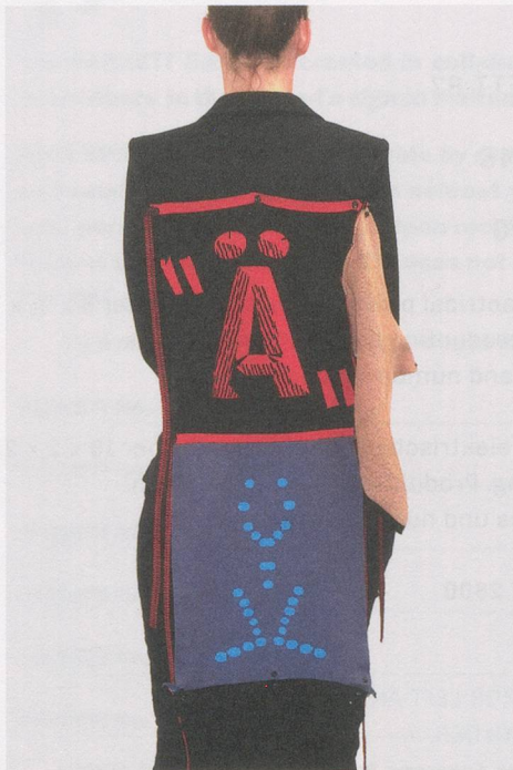
PARASITE PATCH „Ä“