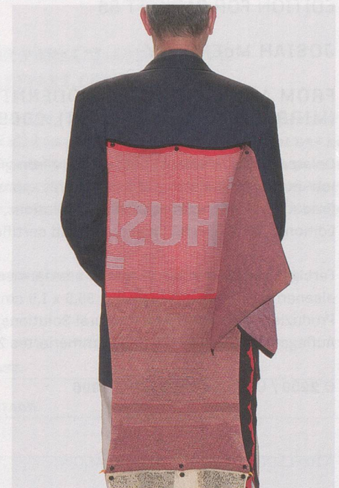
PARASITE PATCH „THUS“