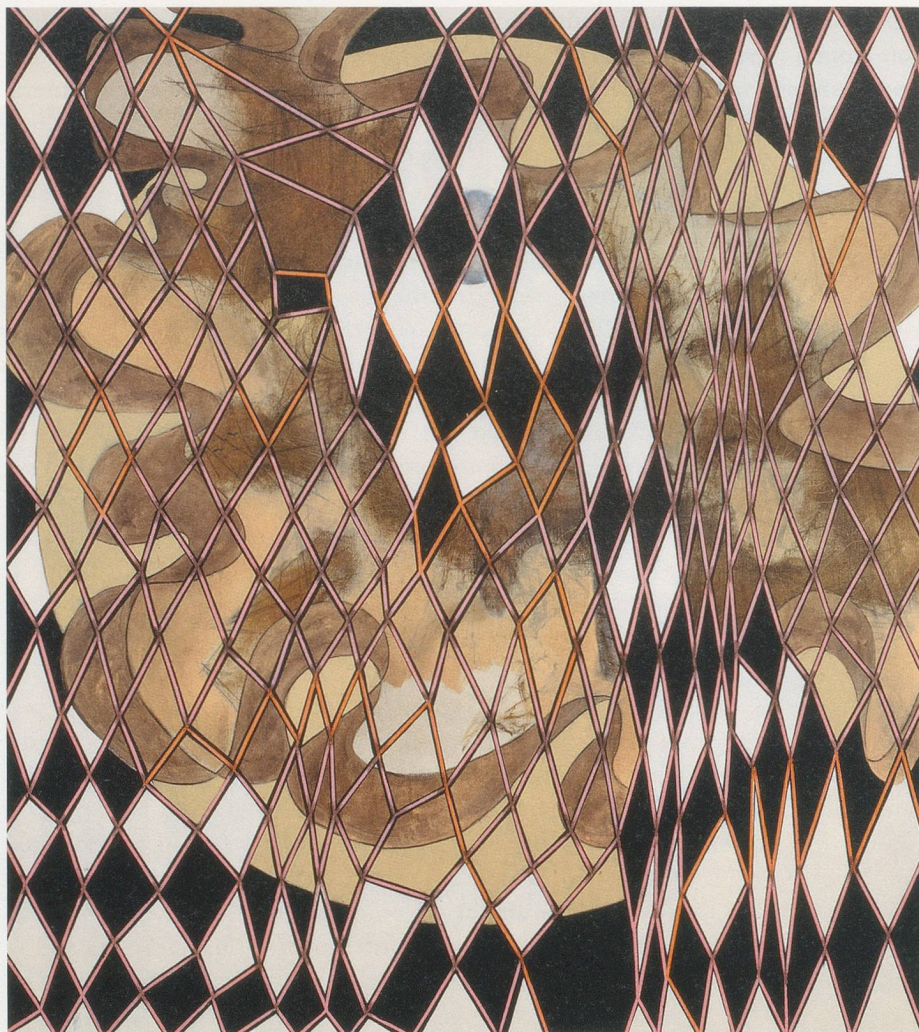
CHARLINE VON HEYL, SOLO DOLO , 2010, oil and charcoal on linen, 82 x 74" /

Öl und Kohle auf Leinen, 208,3 x 188 cm.