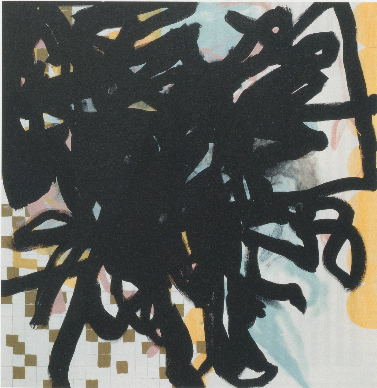
CHARLINE VON HEYL, DEHANDS, DEFEATS , 2011, acrylic on linen, 60 x 62" / Acryl auf Leinen, 152,4 x 157,5 cm.