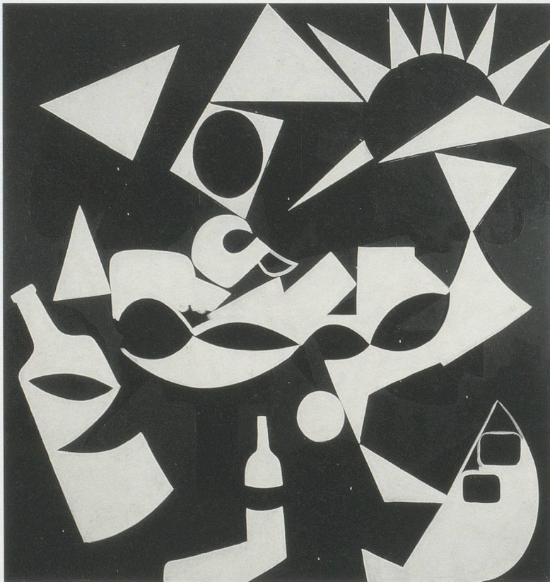
CHARLINE VON HEYL, TIME WAITING , 2010, acrylic and oil on linen, 82 x 78" / Acryl und Öl auf Leinen, 208,3 x 198,1 cm.

Through the gross and subtle moves they make, her paintings ask us to step out of our skin and reconsider what we are seeing; to question our apprehension of things and reflect on the assumptions and general preconceptions that filter and obscure sight.