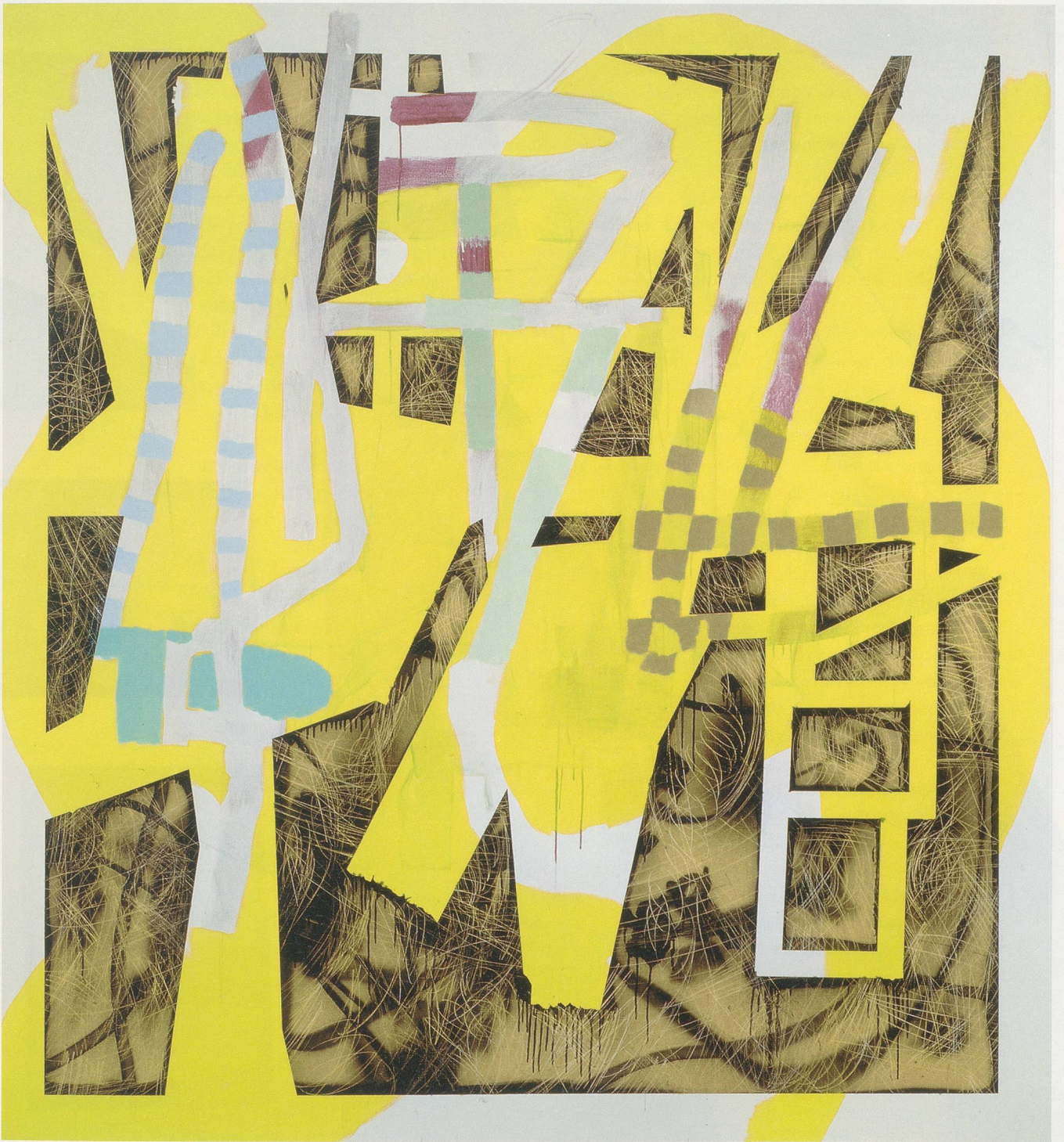
CHARLINE VON HEYL, LAZYBONE SHUFFLE, 2011, acrylic and spraypaint on linen, 82 x 86" / Acryl und Sprühfarbe auf Leinen, 208,3 x 193 cm.