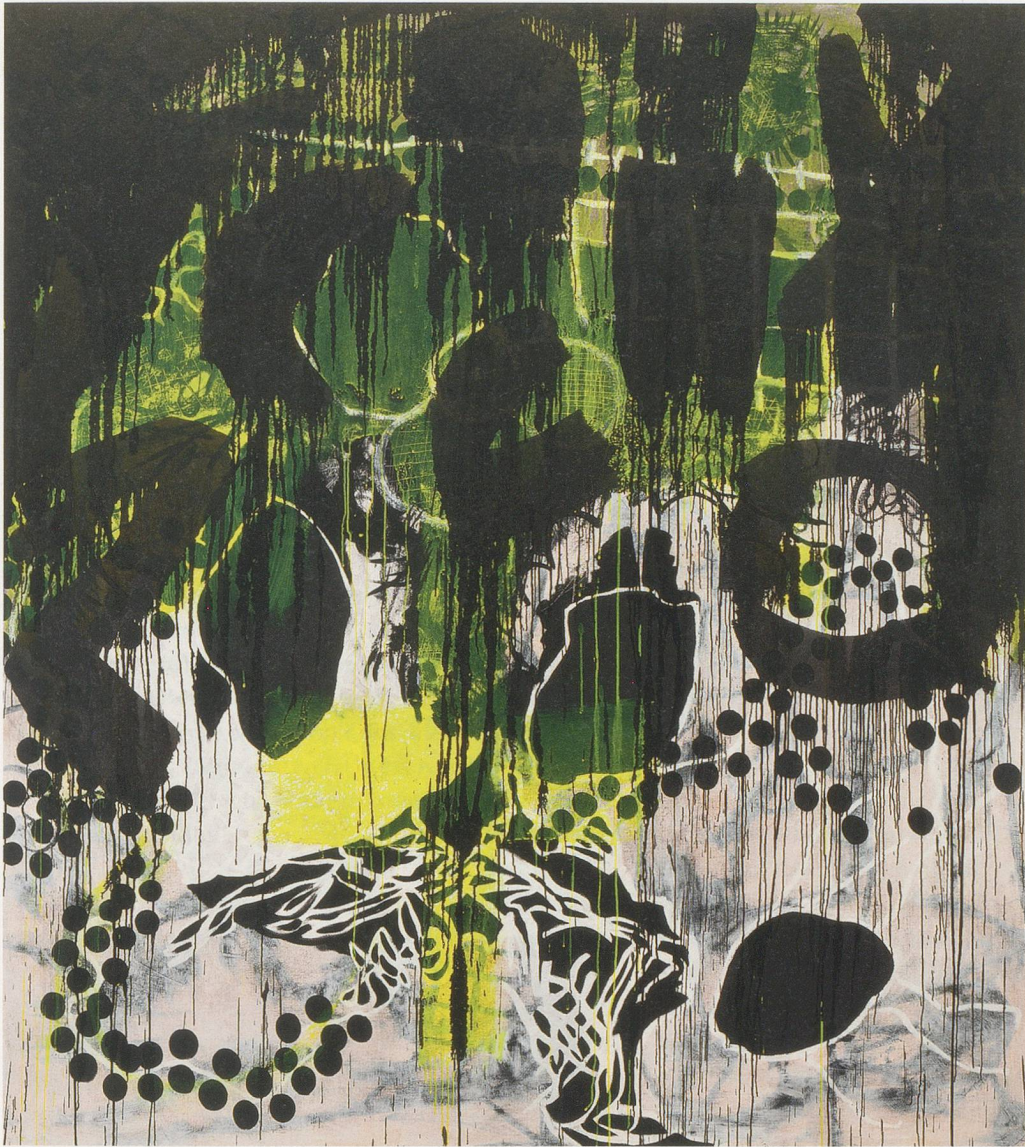
CHARLINE VON HEYL, OREAD, 2011, acrylic, oil, and oilstick on linen, 82 x 74" / Acryl, Öl und Ölstift auf Leinen, 208,3 x 188 cm.

zurückgeworfen, da ist kein Spiegel, in dem sich der Blick begegnen könnte, kein Auge als Gegenüber – nur Narrenraum und abgeblockte Reflexion.