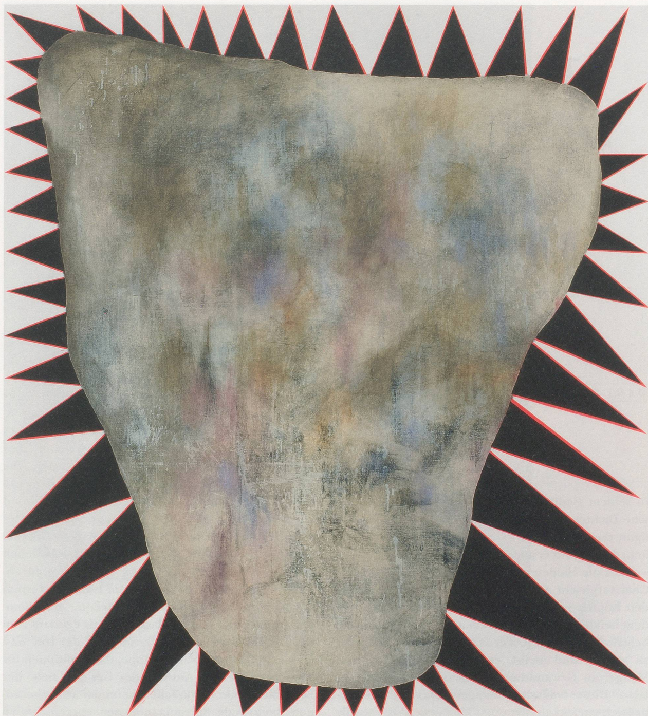
CHARLINE VON HEYL, P., 2008, acrylic and crayons on linen, 82 x 74" / Acryl und Farbstift auf Leinen, 208,3 x 188 cm.