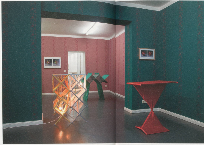
HAEGUE YANG, "Chateau," 2010, exhibition view / Ausstellungssansicht, Galerie Wien, Lohmeyer, Berlin.

With intimated themes like "kinship" of male and female, the "cycle of life," and "evolution," the previously discussed works may be seen to have an anthropological or ethnological effect. A smaller group of sculptures within the Kunsthau Bregenz exhibition, TOTEM ROBOTS (2010), also alludes to anthropology and offers an almost structuralist binary: robot vs. human (like raw vs. cooked). Anthropology is a study of cultural expressions, dance being one of