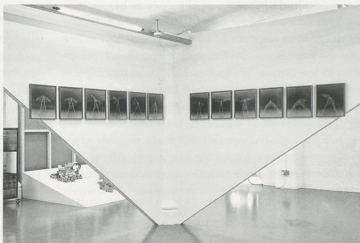
HAEGUE YANG, GYMNASTICS OF THE FOLDABLES , 2006, installation view, Modern Art Oxford / GYMNASTIK DER FALTBAREN , Installationsansicht , 2011.

Although Yang’s recent works reference art history—specifically, early twentieth-century European modernism and the avant-garde—her primary sympathy, in the instance of the Oxford exhibition, lies outside the perimeter of the discipline, in the realm of the amateurish and even dubious. The title “Teacher of Dance” (2011) is derived from the self-anointed moniker of G. I. (George Ivanovich) Gurdjieff (ca. 1866–1949), the mystic and spiritual guru who was born in Alexandropol (the then Russian Empire) at the crossroads of Russian, Greek, Armenian, Georgian, and Turkish cultures. 14) Early in life, Gurdjieff traveled throughout the Near East and Central Asia as far as Tibet and the edge of China, staying at all different kinds of religious monasteries absorbing doctrines, music, and dances. After this extensive period of travel, Gurdjieff arrived in Moscow in 1912 and started gathering students. In 1922 in Paris he founded the Institute for the Harmonious Development of Man to teach his concept called “The Fourth Way”—an allegedly balanced way to cultivate and harmonize the body, heart, and mind so as to awaken the self. He composed from memory the music he heard during his travels and also choreographed “Movements” based on the sacred dances he saw, some of which were performed from the twenties on in European