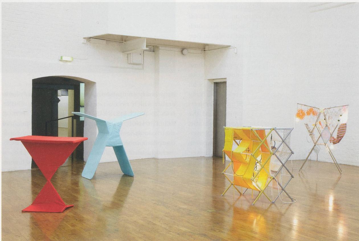
HAEGUE YANG, various Non-Indéfectibles , 2011, installation view, Modern Art Oxford / mehrere Nicht-Unentfaltbare , Installationsansicht.

If the FEMALE NATIVES group alludes to stages of nature and femininity, its male counterpart, MEDICINE MEN (2010), embodies a different taxonomy altogether. Its subtitles—HAIRY BLOODY, HAIRY NOBLE, HAIRY MAD JOINT, INDISCREET OTHER WORLD, A GOOD HUNK OF SAFETY, and OUT OF