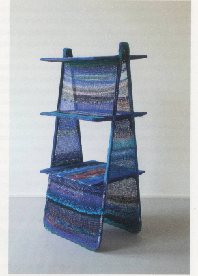
HAEGUE YANG, LA TOUR BLEUE, Non-Indipliable, 2010, drying rack, knitting yarn, 59 x 26 x 24" / Nicht-Umstfaltbare, Wäscheständer, Strickgarn, 150 x 66 x 61 cm.

Unlike Stravinsky's music and Roerich's set and costume designs, we know little about Nijinsky's choreography, no doubt due to the stigmatizing effect of the premiere's scandalous reception and probably also the fact that the dance was so loathed by the dancers in the original production. Fortunately, we have some sense of what the original production looked like thanks to a 1987 reconstruction (by Millicent Hodson with the Joffrey Ballet), which corroborates a scholar's description of the scandalous work: "In violation of centuries of theatrical dance tradition, [The movements are] 'almost bestial,' with knocked knees and turned-in feet—a complete inversion of classical form. With some intervals of serene lyricism, the choreography consisted largely of shudders, jerks,