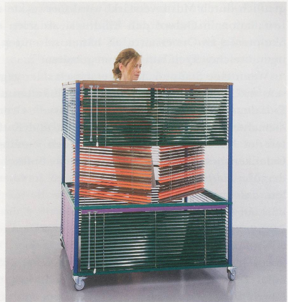
HAEGUE YANG, SQUARE HUNTER , Dress Vehicle, 2011, mobile performative sculpture, aluminum Venetian blinds, powder-coated aluminum frame, casters, magnets, 53 3/4" x 43 x 43" / Kleider-Vehikel, mobile performative Skulptur, Aluminium-Jalousien, pulverbeschichteter Aluminiumrahmen, Rollen, Magnete, 136,5 x 109 x 109 cm.

Aber warum beruft sich Yang auf diese Figur? Die Frage ist äusserst verwirrend, zumal Gurdjieff – von seinen Anhängern vergöttert und von seinen Kritikern als Scharlatan betrachtet – für gewisse Kreise von grosser Bedeutung sein mag, in der allgemeinen Kunstszene jedoch nahezu unbekannt ist. Frank Lloyd Wright, von dem man weiss, dass er von Gurdjieff beeinflusst war, sah in ihm die Figur, die (im