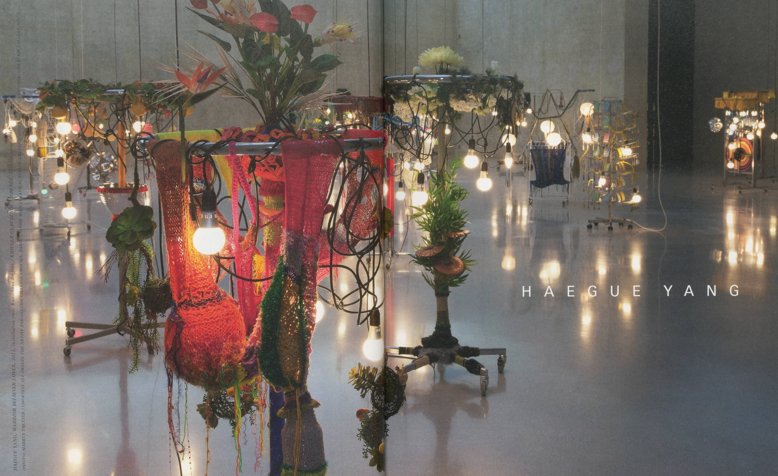
HAEGUE YANG, WARRIOR BELIEVER (OVER), 2011, installation view, Eschschk Gallery, Beijing / ARCHITECTURE BY THE POND, Installation view, Eschschk Gallery, Beijing. All images are copyright of the artist. All rights reserved. Photo: Markes Traiter / ARTISTBYARTIST.COM