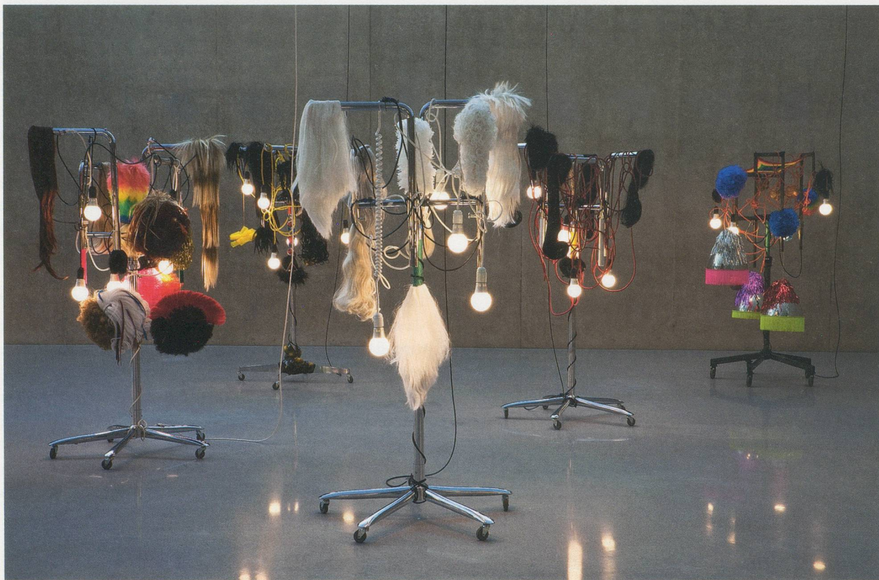
HAEGUE YANG, MEDICINE MEN, 2010, installation view, Kunsthau Bregenz / MEDIZINMÄNNER, Installationsansicht.

Die dreiunddreissig Skulpturen sind unterteilt in zwei Sechsergruppen, zwei Dreiergruppen, zwei Paare und elf Einzelfiguren. 3) Von den früheren Arbeiten unterscheiden sich die Lichtskulpturen nicht nur durch ihre Grösse und den Umfang der künstlerischen Anstrengung, sondern auch durch die unbeschränkte Freiheit der Materialkombinationen – eine schier verschwenderische Fülle. Zum Beispiel bestehen die sechs Skulpturen der FEMALE NATIVES (Weibliche Einheimische, 2010) jeweils aus einer ähnlichen Grundkomposition: einem Kleiderständer mit einer einzigen senkrechten Stützstange und fünfarmigem Drehfusskreuz auf Rollen, der oben in