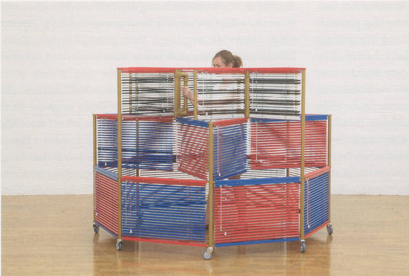
HAEGUE YANG, GOLDEN CLOWNING , Dress Vehicle, 2011, mobile performative sculpture, aluminum Venetian blinds, powder-coated aluminum frame, casters, magnets 59 1/4" high, 84 3/8" diameter / Kleider-Vehikel, mobile performative Skulptur, Aluminium-Jalousien, pulverbeschichteter Aluminiumrahmen, Rollen, Magnete, Höhe 150,5 cm, Durchmesser 215 cm.

begann Schüler um sich zu scharen. 1922 gründete er in Paris das Institut für die harmonische Entwicklung des Menschen , um eine Philosophie zu lehren, die er als «Vierten Weg» bezeichnete, ein angeblich ausgewogener Weg zur Kultivierung und Harmonisierung von Körper, Seele und Geist, der zur Erweckung des Selbst führen sollte. Die Musik, die er auf seinen Reisen gehört hatte, schrieb er aus der Erinnerung heraus nieder und schuf Choreographien, die auf den gesehenen sakralen Tänzen beruhten. Diese «Movements» gelangten von den 20er-Jahren an in europäischen Grossstädten und den Vereinigten Staaten zur Aufführung. Nachdem Diaghilew sie in Gurdjieffs Institut gesehen hatte, war er davon dermassen begeistert, dass er sie in die Ballets Russes aufnehmen wollte. Bei Gurdjieffs letztem Besuch in New York, 1948, sollen seine «Movements» sogar Balanchine und das New York City Ballet beeinflusst haben.