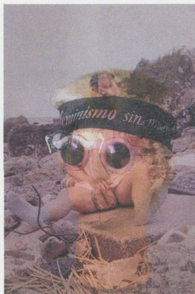
K8 HARDY, PINK DIPTYCH, Position Series, 2011, photographic prints, 20 5/8 x 31 1/8 x 1 1/2" each / ROSA DIPTYCHON, Prints, je 53 x 79 x 4 cm.