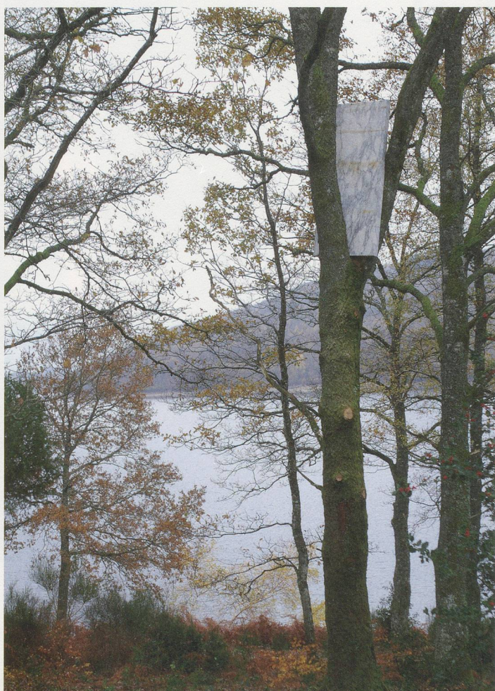
OSCAR TUAZON, NIKI QUENTER, 2009, marble slab, tree, 35 1/2 x 78 3/4 x 4" (slab), Centre international d'art et du paysage de l'île de Vassivière / Marmorplatte, Baum, 90 x 200 x 10 cm (Marmorplatte).