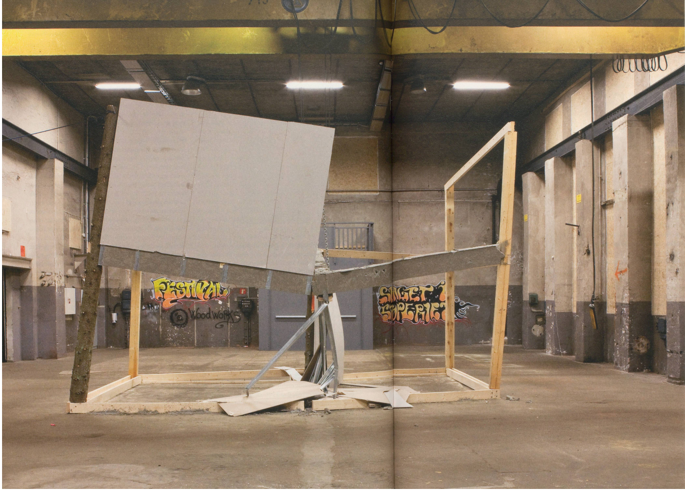
OSCAR TUAZON, ANOTHER NAMELESS VENTURE GONE WRONG, 2009. Installation from Bringer (Vorfeld Kunstmuseum, Trossingen, Germany) / NOCH EIN NAMENLOS GESCHIEHTES UNTERBANGEN, Installationsansicht.