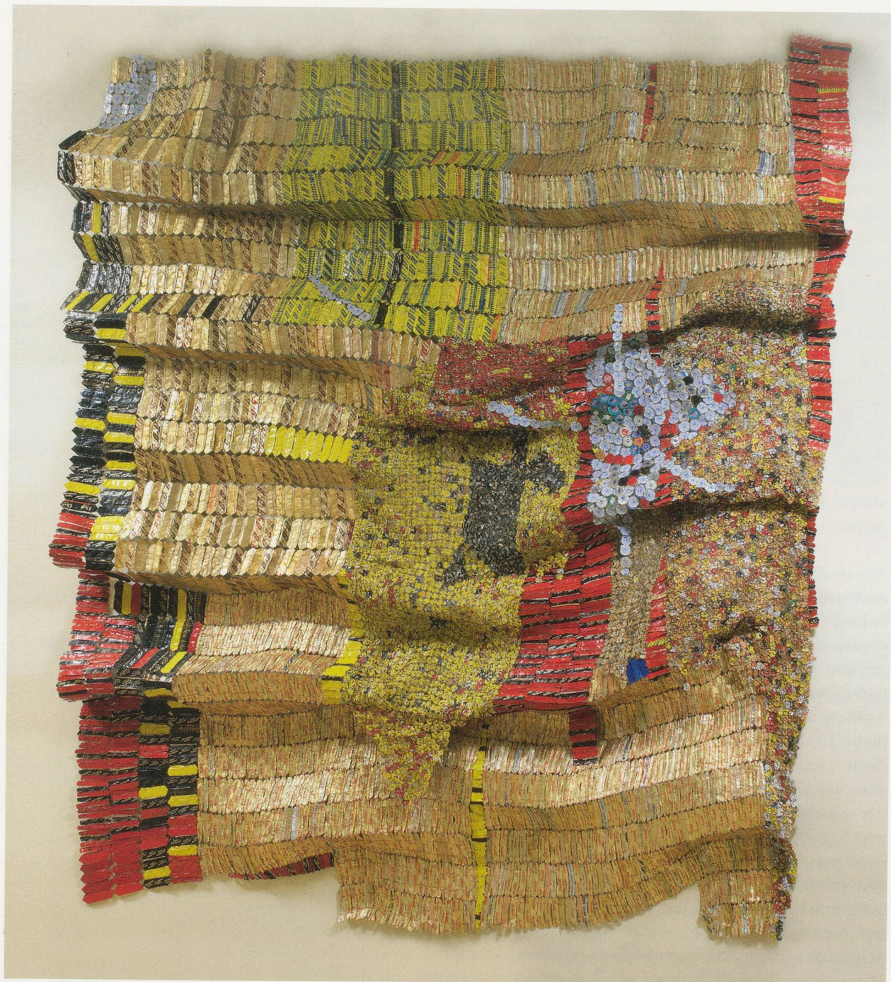
EL ANATSUI, OASIS, 2008, aluminum, copper wire, 106 x 90" / OASE, Aluminium, Kupferdraht, 269,3 x 228,6 cm.