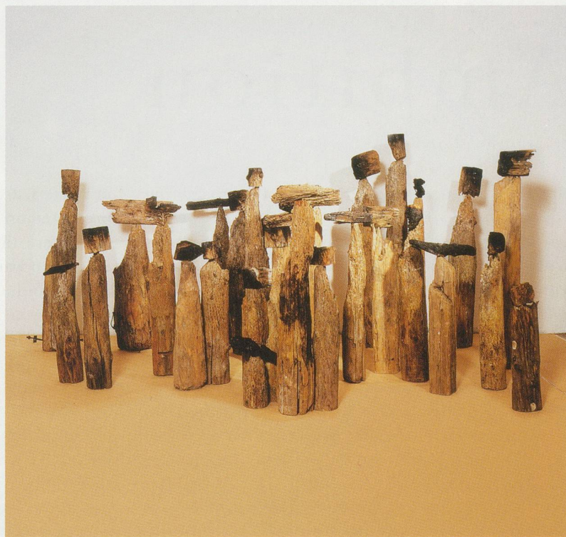
EL ANATSUI, AKUA'S SURVIVING CHILDREN, 1996, wood, metal, dimensions variable / AKUAS ÜBERLEBENDE KINDER, Holz, Metall, Masse variabel.