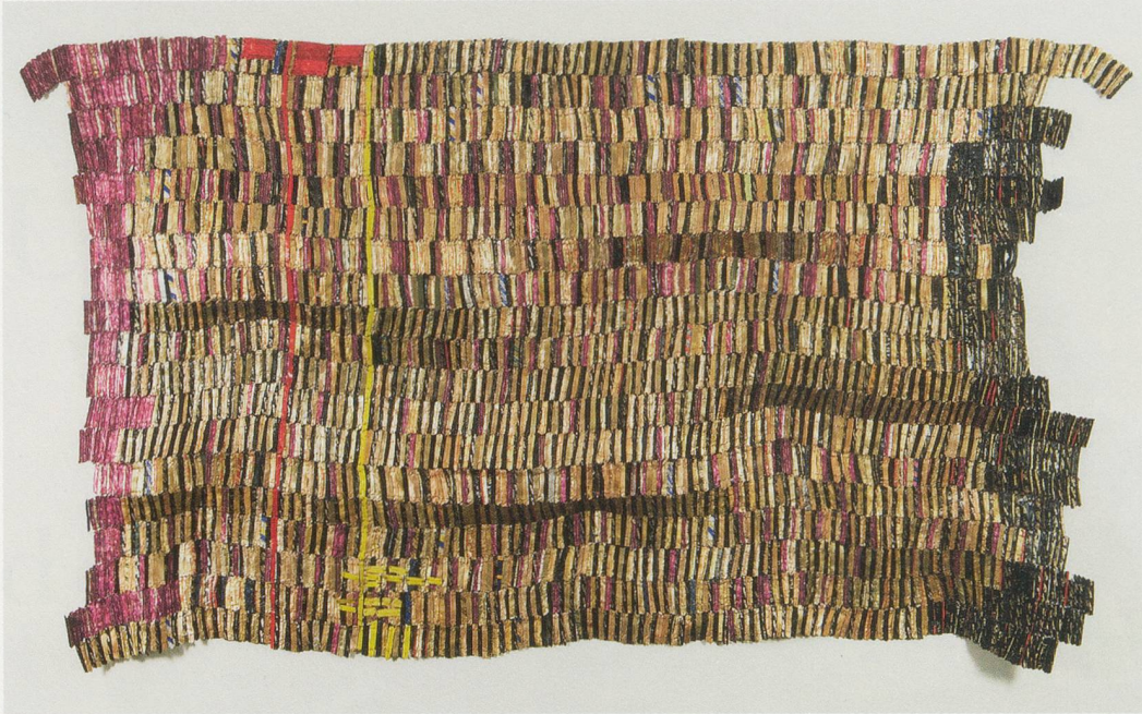
EL ANATSUI, ZEBRA CROSSING III, 2007, aluminum, copper wire, 61 x 107" / ZEBRASTREIFEN III, Aluminium, Kupferdraht, 155 x 271,8 cm.

zu würdigen, dass es eher das Sammeln von Ideen und weniger nur das Produzieren von Formen ist, das hilft, einen scheinbaren Widerspruch in seiner Kunst aufzulösen, nämlich die Dominanz des Handwerklichen, die sich in der Machart der Arbeiten häufig anzudeuten scheint. Aber diese birgt in sich einen ergiebigen Dialog zwischen dem Inhalt des Werkes und seiner expliziten ästhetischen Aussage.