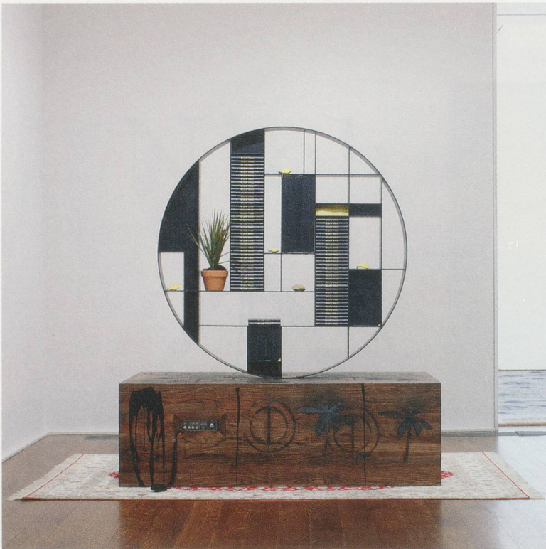
RASHID JOHNSON, BLACK YOGA COMMUNICATION STATION , 2011, blackened steel, books, plants, shea butter, oyster shells, CB radios, branded red oak flooring, black soap, wax, Persian rug, 84 x 71 1/2 x 110" / SCHWARZES YOGA KOMMUNIKATIONSSTATION, geschwärzter Stahl, Bücher, Pflanzen, Sheabutter, Austernschalen, CB-Funkgeräte, roter Eichenfußboden mit Brandmarken, schwarze Seife, Wachs, Perserteppich, 213,4 x 181,6 x 279,4 cm.

Der Mythos des Wilden Westens ist ein Phantasiegebilde, das sich auf einen spezifischen Ort und eine spezifische Zeit bezieht. Es gibt also Spuren der Vergangenheit in der Gegenwart. Meinst du, dass der historische Diskurs, der über 80 Jahre alt ist, nichts mit dir zu tun hat?