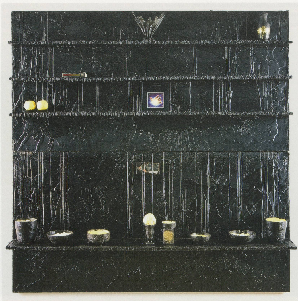
RASHID JOHNSON, CRISIS OF THE NEGRO INTELLECTUAL (POWER OF HEALING) , 2008, shelves, wax, black soap, shea butter, candles, mixed media, 96 x 96 x 12" / KRISE DES INTELLEKTUELLEN NEGERS (KRAFT DES HEILENS) , Regale, Wachs, schwarze Seife, Sheabutter, Kerzen, verschiedene Materialien, 243,8 x 243,8 x 30,5 cm.

you assume that Ra didn't sell records on Saturn? How do you think he could afford those great clothes?