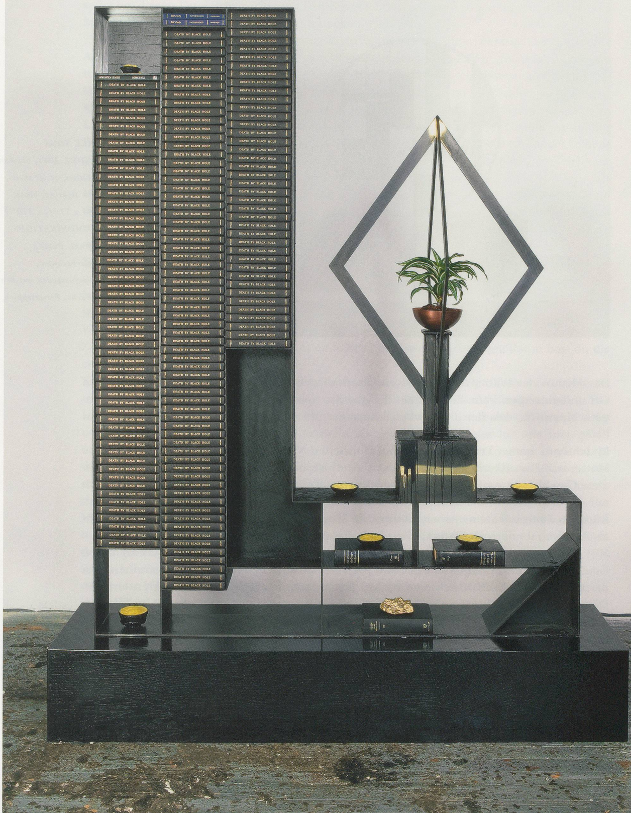
RASHID JOHNSON, DEATH BY BLACK HOLE "THE CRISIS," 2010, steel, black soap, wax, books, shea butter, plant, space rocks, mirror, gold paint, stained wood, 96 1/2 x 76 1/4 x 30" / TOT DURCH SCHWARZES LOCH «DIE KRISE», Stahl, schwarze Seife, Wachs, Bücher, Sheabutter, Pflanze, Weltraumgestein, Spiegel, Goldfarbe, gebeiztes Holz, 245,1 x 193,7 x 76,2 cm.