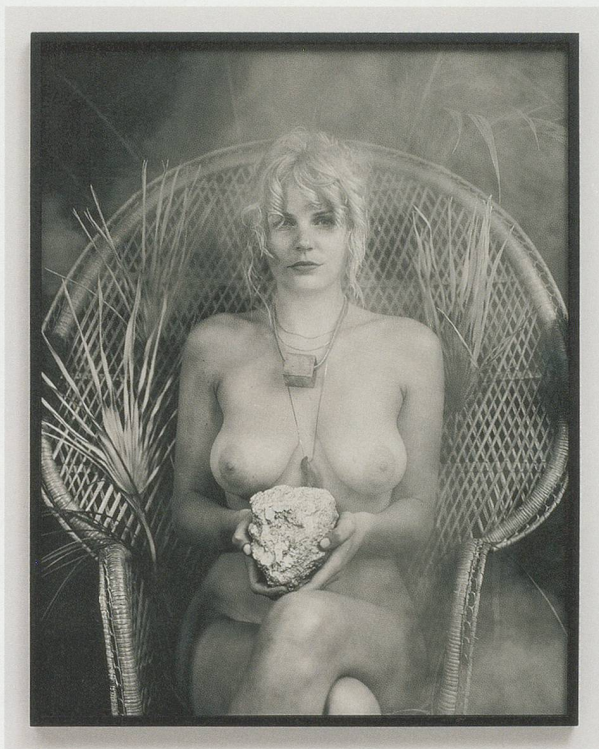
RASHID JOHNSON, SARAH WITH SPACE ROCK, 2009, archival pigment print, 40 7/8 x 32 5/8" / SARAH MIT WELTRAUMGESTEIN, alterungsbeständiger Pigmentdruck, 103,8 x 82,9 cm.

Johnson's work rests peacefully in this ambiguous region, comfortable in this space of contradiction and paradox, where nothing is as it appears to be, and nothing is black and white, or post black and white—a good place to be.