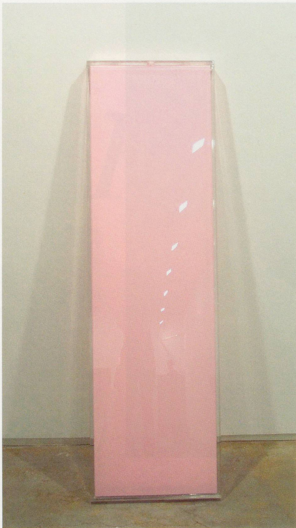
RASHID JOHNSON, PINK LOTION BOX , 2003, Luster's Pink Lotion , plexiglass, 72 x 20 x 2 1/2" / PINK-LOTION-BEHÄLTER , Luster's Pink Lotion , Plexiglas, 182,9 x 50,8 x 6,4 cm.

one portrait shows Johnson resting on boxer Jack Johnson's tombstone.