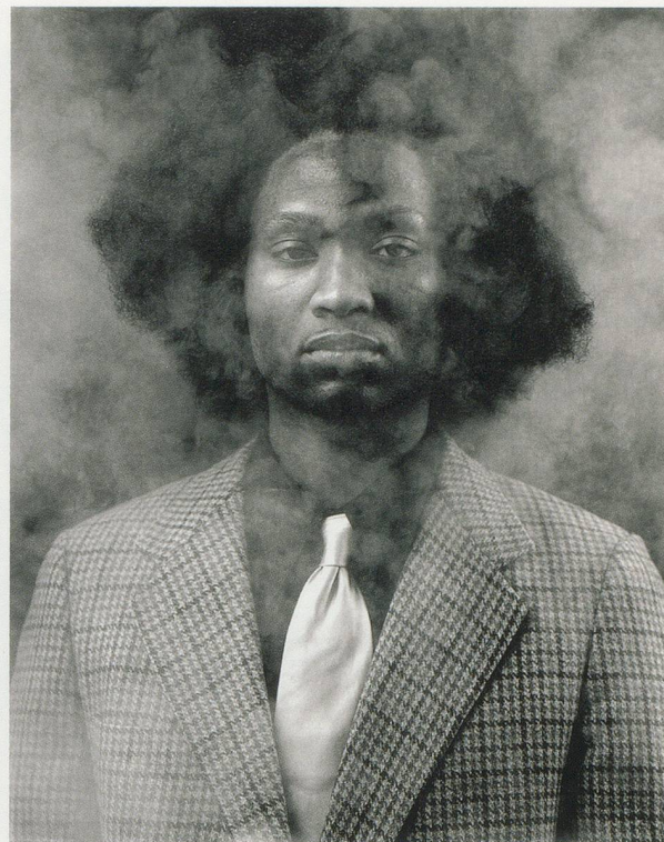
RASHID JOHNSON, THE NEW NEGRO SOCIAL AND ATHLETIC CLUB (THURGOOD), 2008, Lambda print, 64 1/2 x 51" / DER NEUE GESELLSCHAFTS- UND SPORTCLUB FÜR SCHWARZE ESKAPISTEN (THURGOOD) , Lambda-Print, 163,8 x 129,5 cm.

Die Gemälde wirken anziehend und abstossend zugleich; ihre Sinnlichkeit zieht uns an, verunmöglicht uns jedoch, sie zu deuten und historisch einzuordnen. Die stark bearbeiteten Oberflächen erinnern an die Opazität von Rauschenbergs frühen schwarzen Bildern, verweisen aber auch auf die reichlich mit Kohlestaub bedeckten Bilder von Glenn Ligon. Man könnte sogar an Cy Twomblys an sprachliche Zeichen gemahnende gestische Abstraktionen denken oder an das Körnige, Muskulöse eines Jean Dubuffet.