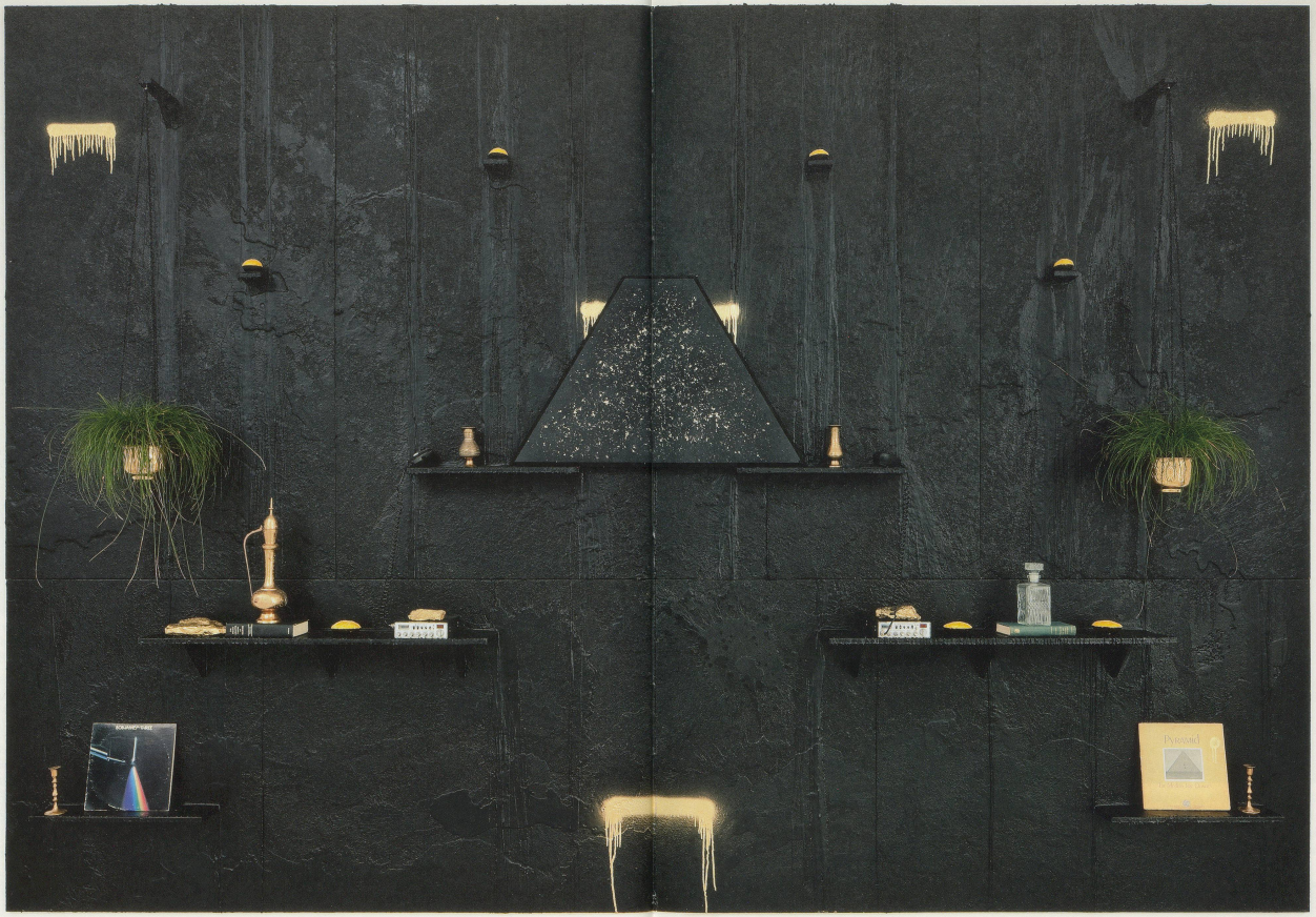
RASHID JOHNSON, PYRAMID, 2009. black soap, wax, vinyl, CR radio, brass, bamboo, glass, spray paint, plastic, wood, blue latex, silver mesh, 133 x 194 x 107 / PYRAMIDE, schwarze Seife, Wachs, Schmelzplatte, CR-Radio, Messing, Bronze, Glas, Sprayfarbe, Plastik, Holz, Schablonen, Wellspannungsfäden, 337,8 x 192,8 x 25,7 cm.