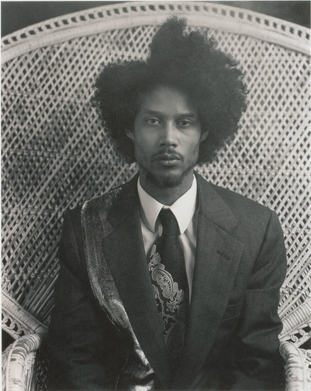
RASHID JOHNSON, THE NEW NEGRO ESCAPIST SOCIAL AND ATHLETIC CLUB "THE PART," 2011, silver gelatin print, 40 x 30" / DER NEUE GESELLSCHAFTS- UND SPORTCLUB FÜR SCHWARZE ESKAPISTEN «DER TEIL», Silbergelatine-Print, 101,6 x 76,2 cm.