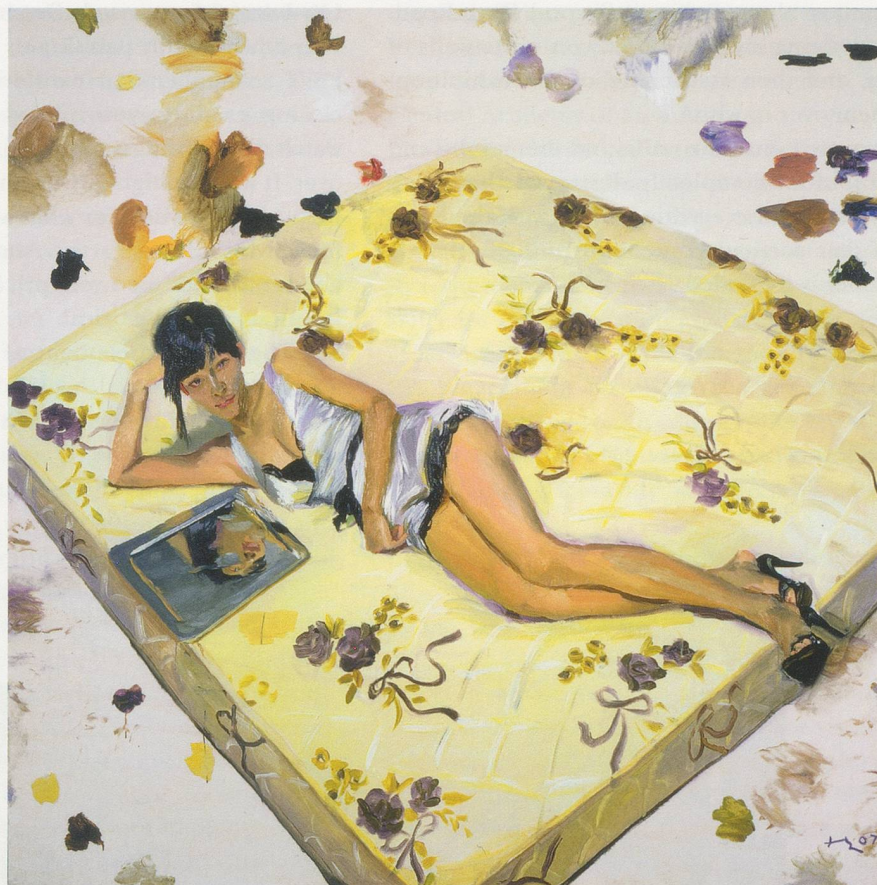
LIU XIAODONG, QIQI , 2007, oil on canvas, 78 3 / 4 x 78 3 / 4 / Öl auf Leinwand, 200 x 200 cm.

that any paintings I showed in this bunker needed to seem as if they had grown out of it like plants, not potted flowers raised in a greenhouse and brought over. That is why I decided I needed to paint on-site, because of this feeling that it would be the only way to do something meaningful.