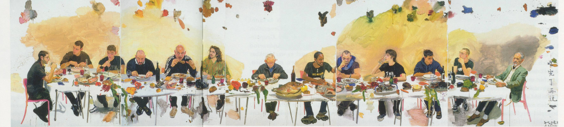
THE 18 ARHATS (2004–2005), das Soldaten in China und Taiwan zeigt.

PHILIP TINARI ist Direktor des Ullens Center for Contemporary Art in Beijing.