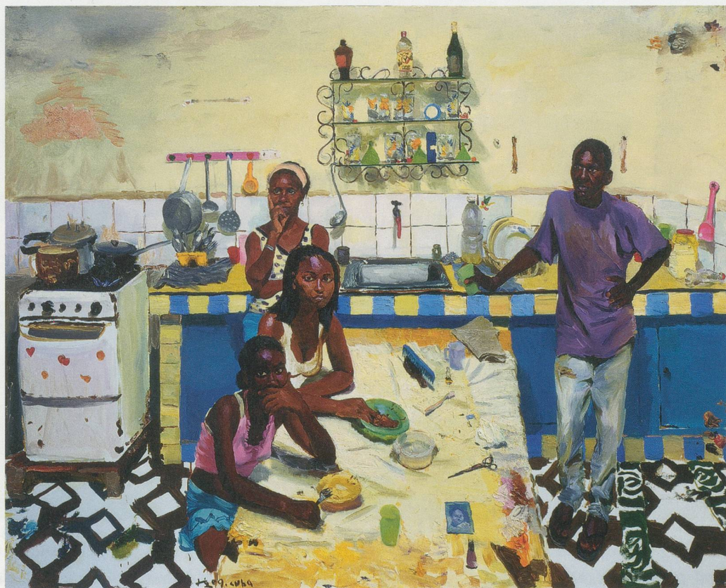
LIU XIAODONG, ARMANDO'S FAMILY, 2009, oil on canvas, 78 3/4 x 98 1/2" / ARMANDOS FAMILIE, Öl auf Leinwand, 200 x 250 cm.

LX: Die ersten Studien machte ich früher. Ohne eine gewisse Routine konnte man der Akademie nicht beitreten; die Prüfungen basierten auf dem Arbeiten nach der Natur. Es ging ausschliesslich um die Fertigkeit im realistischen Abbilden; kreatives Arbeiten spielte eine sehr geringe Rolle. Wichtig waren die Fertigkeiten im Zeichnen, Malen und Skizzieren, und schliesslich die Kreativität, die natürlich am wichtigsten ist.