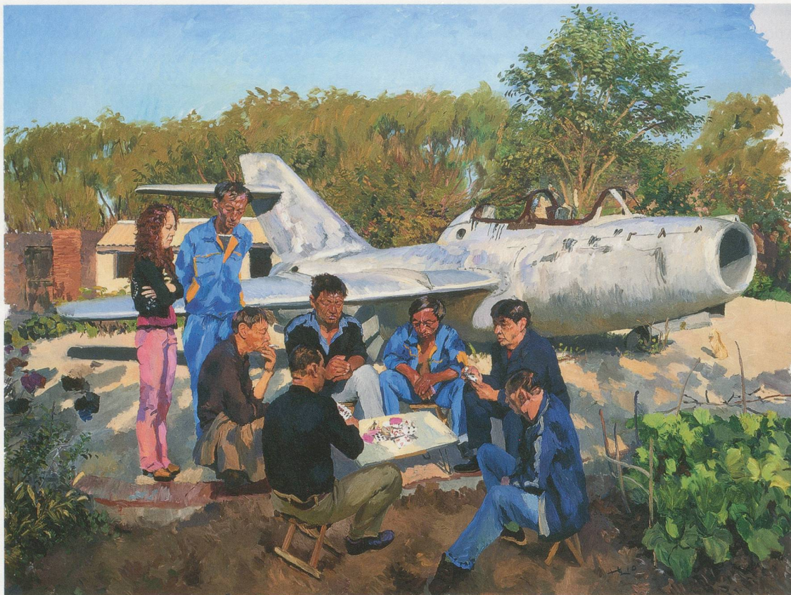
LIU XIAODONG, JINCHENG AIRPORT, 2010, oil on canvas, 118 1/8 x 157 1/2" / FLUGHAFEN JINCHENG, Öl auf Leinwand, 300 x 400 cm.

als Frauen. Der einfache Grund dafür ist, dass weibliche Formen in der Kunstgeschichte überwiegen; darum habe ich mich entschieden, Männer zu malen. In der traditionellen Malerei gibt es viele Dinge, die man nicht mehr malen kann, und ich habe immer am liebsten das gemalt, was es zuvor in den Bildern nicht gab. Dies bedeutet, dass meine Arbeit gleichzeitig eine Achtung und eine Unzufriedenheit gegenüber der Geschichte der Malerei reflektiert, und was noch viel wichtiger ist: das Leben zum Ausdruck bringt und nicht bloss Methodenforschung betreibt. Wir sind mit so vielen unlösbaren Problemen konfrontiert, die wir nur in der Kunst zum Ausdruck bringen können. Ich setze die Malerei ein, um diese