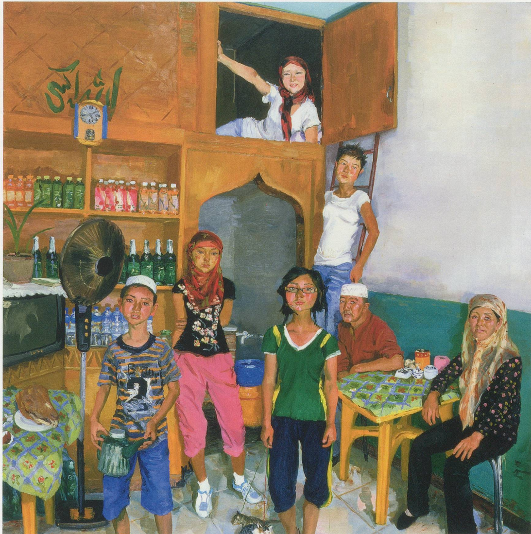
LIU XIAODONG, HE'S FAMILY, 2009, oil on canvas, 114 1 / 8 x 102 3 / 8 " / HES FAMILIE, Öl auf Leinwand, 290 x 260 cm.

LX: The painted and the painter are the same. For that project, I felt that the canvas needed their