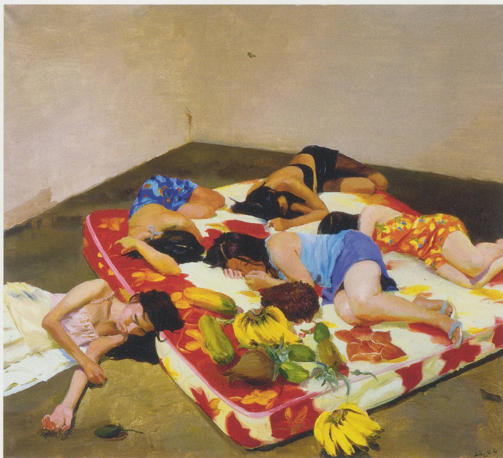
LIU XIAODONG, FLORAL BED, 2006, oil on canvas, 35 1/2 x 39 3/8" / GEBLÜMTES BETT, Öl auf Leinwand, 90 x 100 cm.

(Aus dem Chinesischen von Eva Lüdi Kong)