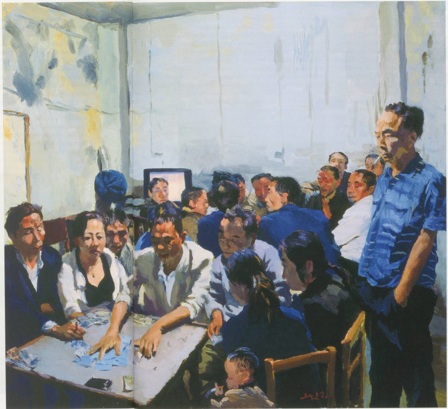
LIU XIAODONG, MAHJANG PARLOR, 2012, oil on canvas, 35 1/2 x 39 1/2" / MAH-JONGG ZIMMER, Öl auf Leinwand, 90 x 100 cm.