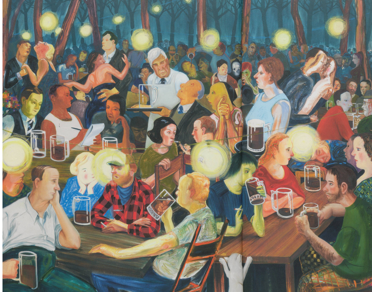
NICOLE EISENMAN, BROOKLYN BIERGARTEN II, 2008, oil on canvas, 65 x 82" / Öl auf Leinwand, 165,1 x 208,3 cm.