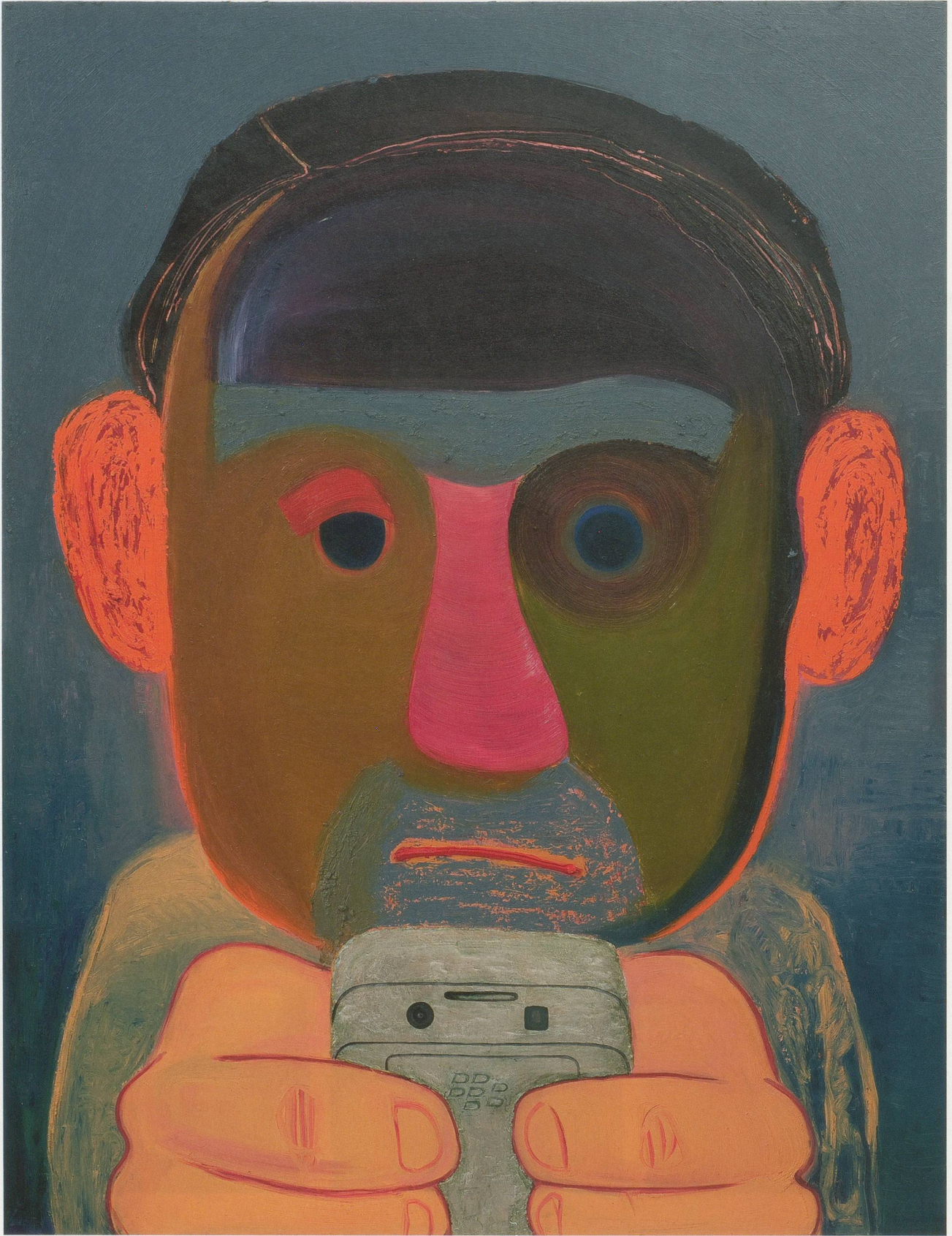
NICOLE EISENMAN, BREAKUP , 2011, oil on canvas, 56 x 43" / TRENNUNG , Öl auf Leinwand, 142,2 x 109,2 cm.