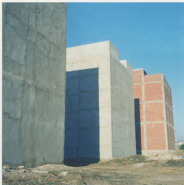
YTO BARRADA, MURS ROUGES FIG. 5 (RED WALLS FIG. 5), 2006, C-print, 39\frac{3}{8} \times 39\frac{3}{8} " / ROTE MAUERN, FIG. 5, C-Print, 100 x 100 cm.

erd an einer Grenze abspielt, bleibt nur noch die Tat, der Bruch mit angestammtem Verhalten, die Möglichkeit, anders zu überleben. Die Protagonistin in Barradas Video THE SMUGGLER (Die Schmugglerin, 2006) ist eine Metapher für eine Welt, die Strategien des Widerstands, der Subversivität und Sabotage einsetzt, und so prekär diese auch sein mögen, sie suggerieren, dass andere Formen, dieses Leben zu bewohnen, möglich sind.