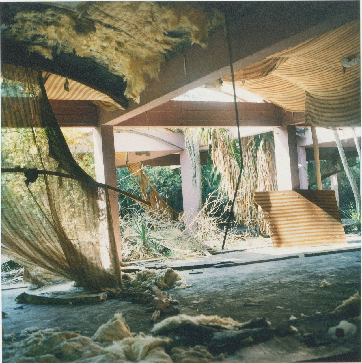
YTO BARRADA, RESTAURANT, VILLA HARRIS, FIG. 2, 2010, C-print, 49 1/4 x 49 1/4" / C-Print, 125 x 125 cm.