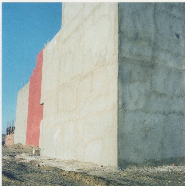
YTO BARRADA, MURS ROUGES FIG. 4 (RED WALLS FIG. 4), 2006, C-print, 39\frac{3}{8} \times 39\frac{3}{8} " / ROTE MAUERN, FIG. 4, C-Print, 100 x 100 cm.