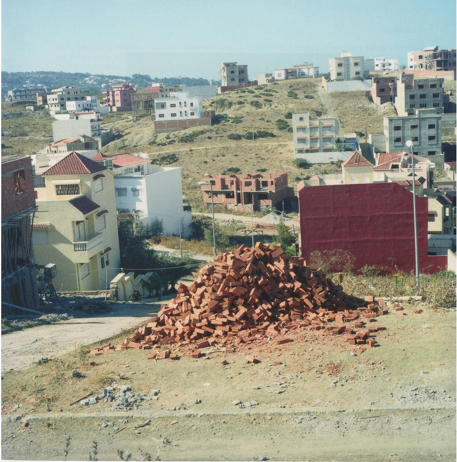
YTO BARRADA, BRIQUES (BRICKS) , 2003/2011, C-print, 59 x 59" / ZIEGELSTEINE , C-Print, 150 x 150 cm.