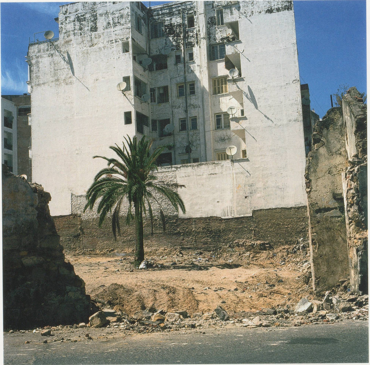
YTO BARRADA, TERRAIN VAGUE N°2 (VACANT LOT NO 2), 2009, C-print, 31 1/2 x 31 1/2" / BRACHLAND, C-Print, 80 x 80 cm.