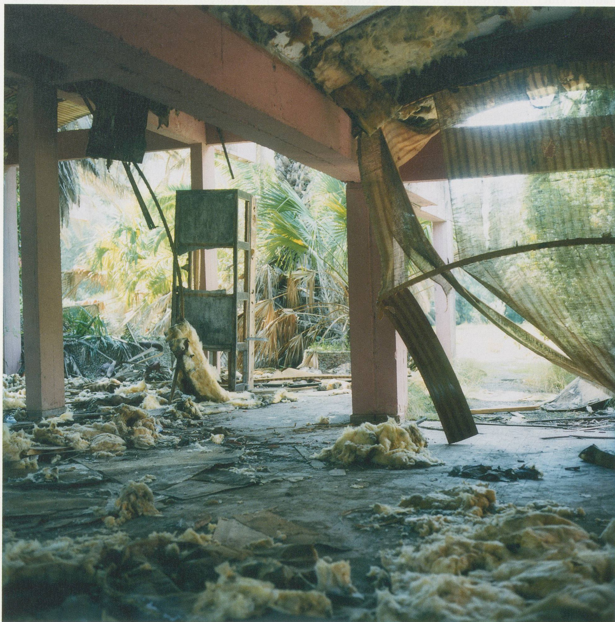
YTO BARRADA, RESTAURANT, VILLA HARRIS, FIG. 1, 2010, C-print, 49 1/4 x 49 1/4", diptych / Ç-Print, 125 x 125 cm, Diptychon.