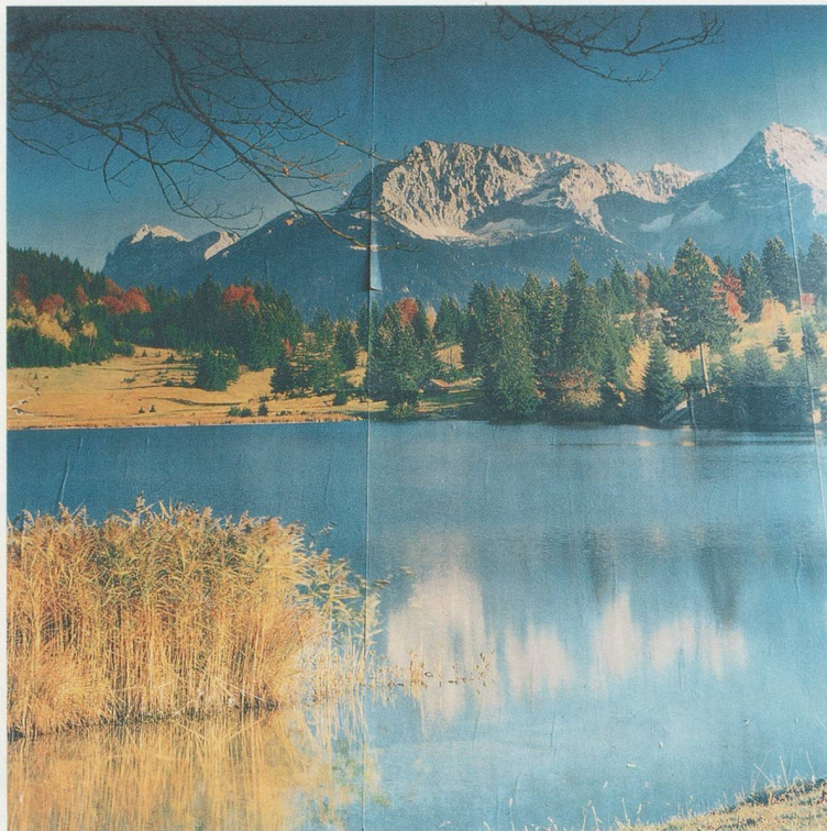
YTO BARRADA, PAPIER PAINT, TANGIER (WALL PAPER, TANGER), 2001, C-print, 23 3 / 8 x 23 5 / 8 " / PLAKATWAND, C-Print, 60 x 60 cm.

2003/2011) bring to mind images by Renger-Patzsch or Evans, although in Barrada's work the motley and industrial landscape of the 1930s Ruhr valley or the American South has become the ravished landscape of late capitalism. As the photograph PALISSADE DE CHANTIER (Building Site Wall, 2009/2011) seems to suggest, the recent economic debacle has turned many former tourist sites, and even the advertisements for them, into premature ruins.