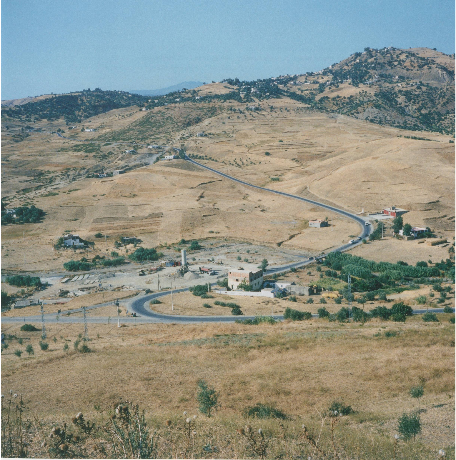
YTO BARRADA, ROUTE DE L'UNITÉ (UNITY ROAD), 2001, C-print, 31 1/2 x 31 1/2" / STRASSE DER EINHEIT, C-Print, 80 x 80 cm.