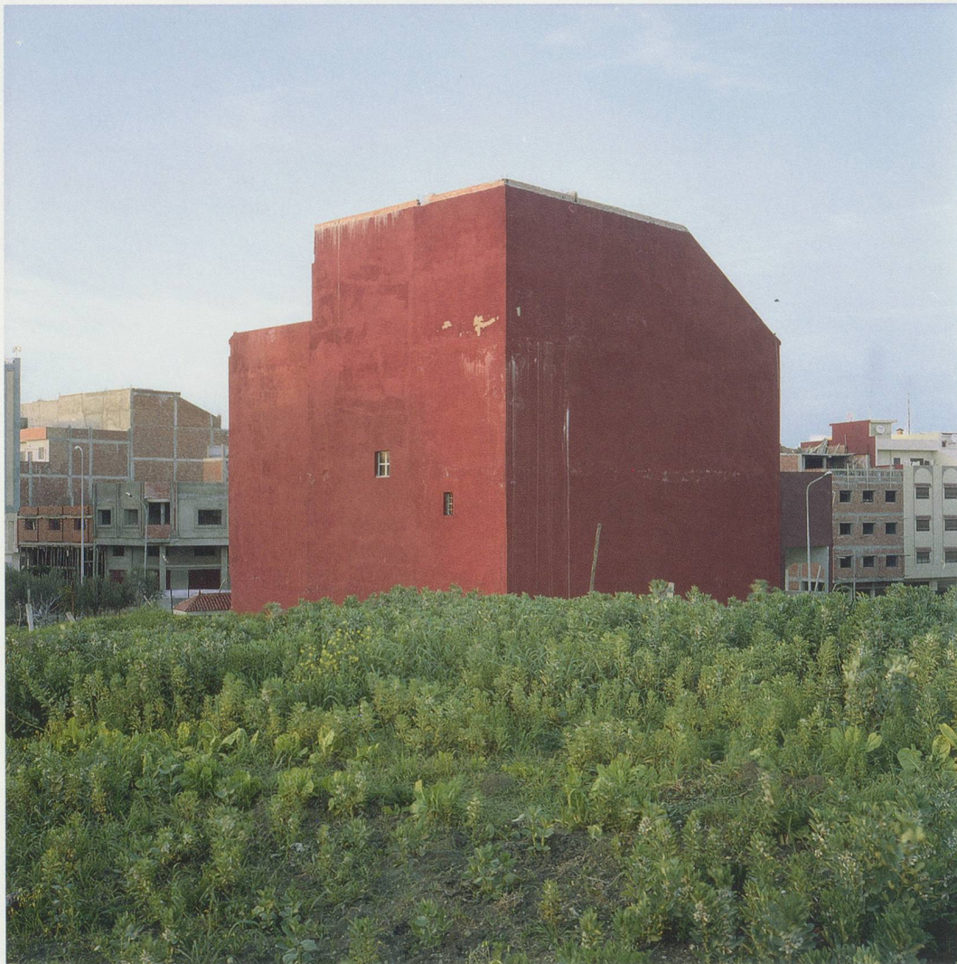
YTO BARRADA, IMMEUBLE ROUGE (RED BUILDING), TANGER, 2008, C-print, 31 1/2 x 31 1/2" / ROTES GEBÄUDE, C-Print, 80 x 80 cm.

nung der äusseren Welt mittels der Bildanordnung im Bild sichtbar machen», lautete in den 30er-Jahren eines der Hauptziele von Photographen wie August Sander, Walker Evans und Albert Renger-Patzsch. Sie wollten die «Objektivität» hinter sich lassen, um ihren Darstellungen der Wirklichkeit eine aktivere Lesbarkeit zu verleihen 1) . Ohne jeden Zweifel knüpft Barrada an diese Tradition an, auch wenn sie uns lie-