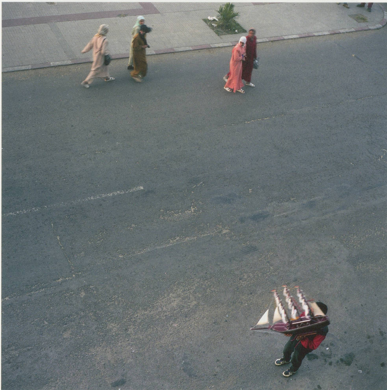
YTO BARRADA, LE DÉTROIT – AVENUE D'ESPAGNE, TANGER, 2000/2003, C-print, 23 5/8 x 23 5/8" / C-Print, 60 x 60 cm.