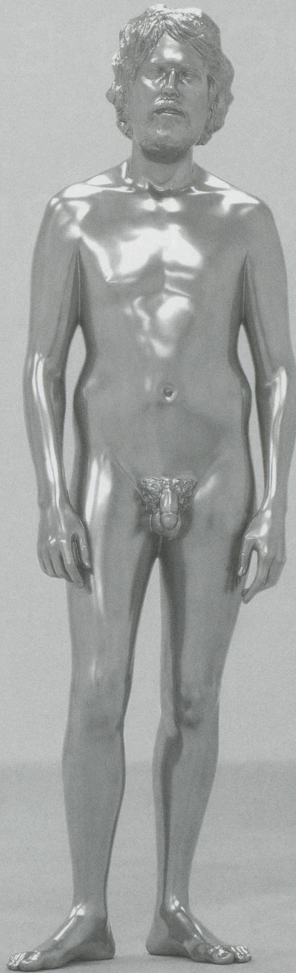
Charles Ray, Young Man , 2012. Solid stainless steel, 71 x 21 x 13½ inches; 180 x 53 x 34 cm