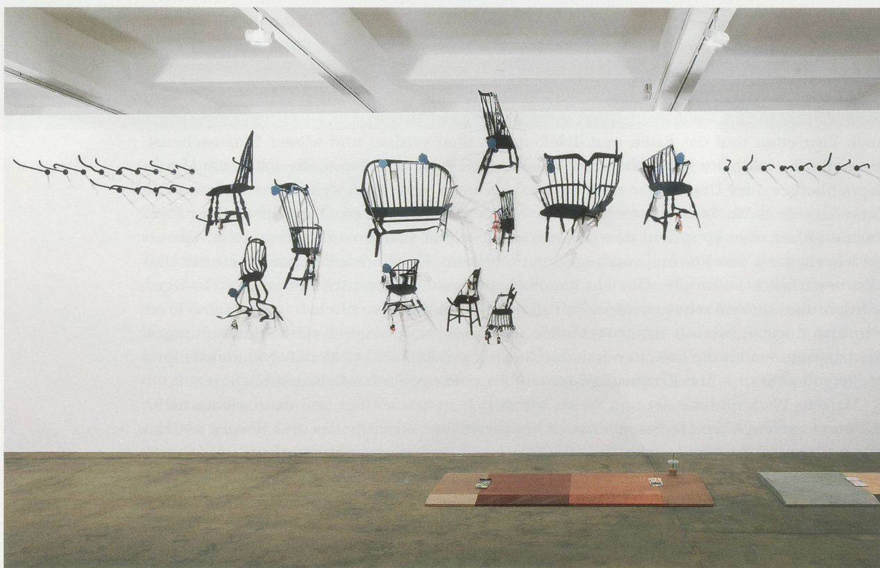
HELEN MARTEN, "Plank Salad," 2012/2013, exhibition view / Ausstellungsansicht, Chisenhale Gallery, London.

In der Serie GEOLOGIC AMOUNTS OF SOBER TIME (MOZART DRUNKS) – Geologische Mengen nüchterner Zeit (Mozartbesoffene), 2012 – wird eine schematische Karikatur von Mozarts Kopf wie eine leere Chiffre oder eine abstrakte Schablone für hohe Kultiviertheit wiederholt. Sie ist in einen Hintergrund gefügt, der aus unterschiedlich blass eingefärbten Stellen besteht. Es handelt sich um im Siebdruckverfahren bedrucktes Leder und ein Material mit exotischem, nach Straussenleder klingendem Namen (Ostrich, eine Art Kunstleder). Marten malt nicht, aber ihre Arbeiten sind äusserst malerisch. So stellen selbst Werke, die