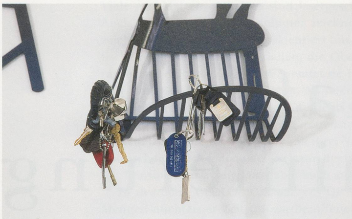
HELEN MARTEN, TRADITIONAL TEACHERS OF ENGLISH GRAMMAR , 2012, powder coated laser-cut steel, car keys, bells, forged and welded rebar, 11 parts, dimensions variable / TRADITIONELLE LEHRER FÜR ENGLISCHE GRAMMATIK , pulverbeschichteter, lasergeschnittener Stahl, Autoschlüssel, Schellen, geschmiedete und geschweisste Armierungseisen, 11 Teile, Masse variabel.

anthropocentric position to see that the things dispersed in Marten's installation are not objects but subjects; they are not animated by us but in relation to us, in a reciprocal relationship that breaks down oppositions between the animate and the inanimate, the active and passive, the human and nonhuman. You could say the same about zips, door handles, brackets, or much of the hardware she has used in her work over the last few years.