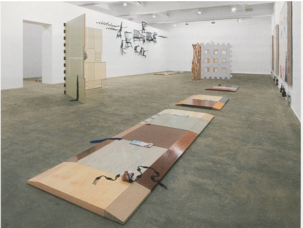
HELEN MARTEN, "Plank Salad," 2012/2013, exhibition view / Ausstellungsansicht, Chisenhale Gallery, London.

Zeichnen ist wichtig, nicht nur weil Martens Werk graphisch ist, sondern auch weil es wie eine Kritzelei im Begriff ist, sich selbst zu erschaffen. Es ist mit der graphischen Qualität der Trickfilmanimation verwandt. Und es stellt sich heraus, dass die Animation wichtiger ist als die Tatsache, dass Marten zum Zeichnen den Computer benutzt. Zum Teil ist die Absurdität der Arbeiten nicht der surrealistischen Phantasie der Künstlerin zu verdanken, sondern der Magie der Animation, insbesondere wenn sehr alte Formen der Animation ins Spiel kommen. Auch hier geht es oft um häusliche Motive. Stühle, die aus der Wand hervorstehen und durchhängen, erinnern an eine Sequenz aus einem alten Disney-Trickfilm, in dem die Stühle zu tanzen beginnen.