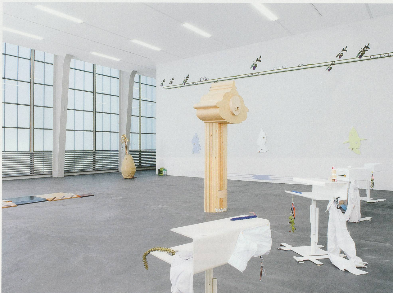
HELEN MARTEN, "Almost the exact shape of Florida," 2012, exhibition view / Ausstellungsansicht, Kunsthalle Zürich.