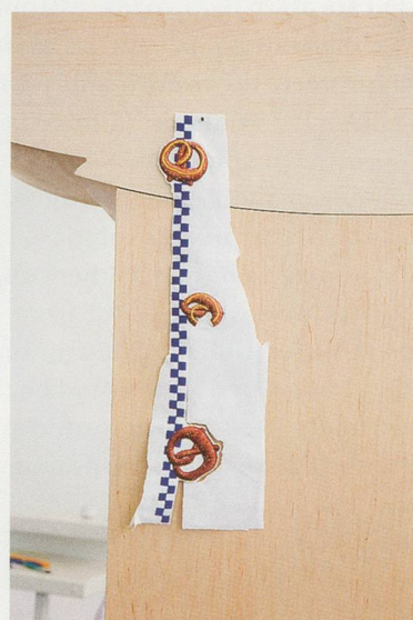
HELEN MARTEN, ONE FOR A BIN, TWO FOR A BENCH: FRIEND, AMIGO, SPORT, 2012, rough sawn pine, maple, ash, cigarette packets, cast bronze, clout nails, hand embroidered pillow, twig, 98 1/2 x 51 1/4 x 21 2/3" / EINER FÜR EINEN ABFALLEIMER, ZWEI FÜR EINE BANK: FREUND, AMIGO, SPORT, grob gesägtes Pinienholz, Ahorn, Esche, Zigarettenschachteln, gegossene Bronze, Dachnägel, handgesticktes Kissen, Zweig, 250 x 130 x 55 cm.