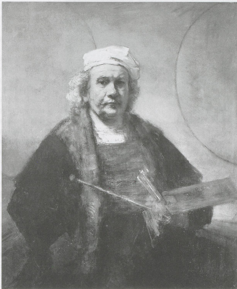
REMBRANDT VAN RIJN, SELF-PORTRAIT WITH TWO CIRCLES, c. 1661, oil on canvas, 45 x 37" / SELBSTBILDNIS MIT ZWEI KREISEN, Öl auf Leinwand, 114,3 x 94 cm.

person, with all its tension, all its problems, with all its drama." 1)