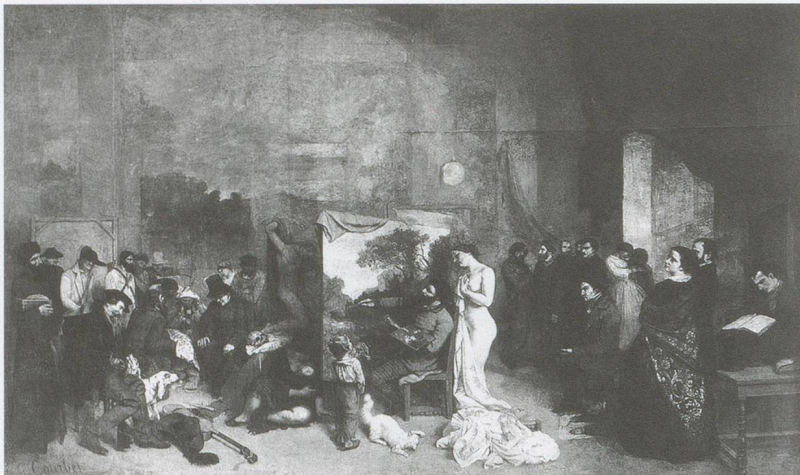
GUSTAVE COURBET, THE ARTIST'S STUDIO , 1855, oil on canvas, 141 1/4 x 235" / DAS ATELIER DES KÜNSTLER , Öl auf Leinwand, 359 x 598 cm.

the eyes, which is unlike the style of his contemporaries. Simon Schama has described these eyes as "black holes—cavities behind which something is being born rather than destroyed. Behind the drill-holes, in the deep interior of the imagination, the real action is going on, wheels within wheels; the machinery of cogitation whirring and flying like the delicately interlocking parts of a timepiece. An idea, this idea , is in genesis." 3)