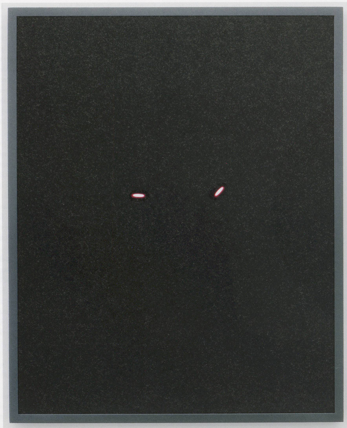
PAMELA ROSENKRANZ, MORE CORE (SOUND HEAD, SOUND MIND), 2010, photogram , 19\frac{11}{16} \times 15\frac{3}{4} " / MEHR KERN (KLANG KOPF, KLANG GEIST), Photogramm , 50 x 40 cm.