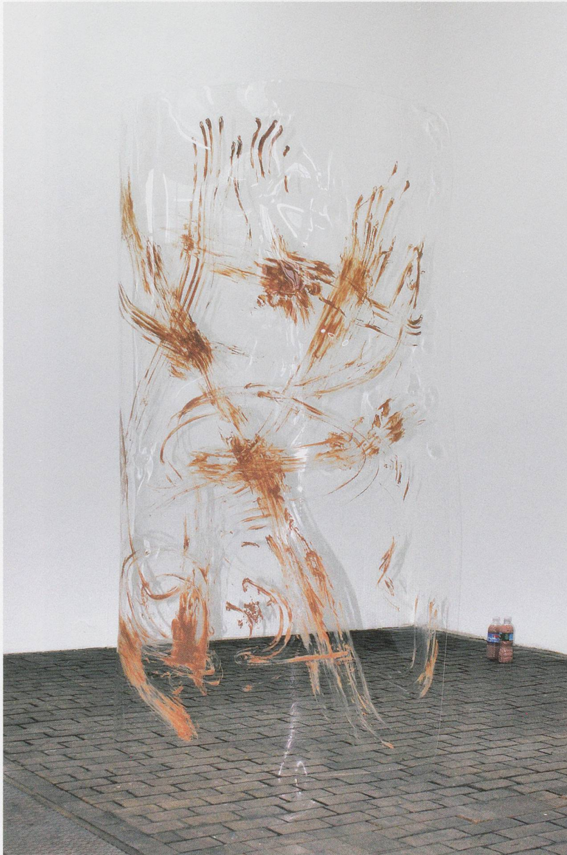
PAMELA ROSENKRANZ, "Our Sun," 2009, installation view, Istituto Svizzero, Venice / Installationsansicht.

In verschiedenen Melanintönen gefärbt, ist Dragon Skin unglaublich glatt und farblich ebenmässig, ohne die Höcker und Unreinheiten echter Haut. In ähnlich gesteigerter Qualität, läuft das Wasser in Rosenkranz' Waschbecken, es ist tatsächlich aquamarinblau (MORE STREAM / Mehr Strömung, 2012) – ein lebhafteres Double der Realität dank Beifügung von Methylenblau, der ersten rein synthetischen Droge, die in der Medizin zur Anwendung kam. Da die Menschen laufend an der Natur «herumbessern», wird das biologische Leben immer stärker mit anorganischen Materialien durchsetzt. Gewisse Sportlergetränke behaupten heute, Körper effizienter mit Feuchtigkeit zu versorgen als Wasser, und manche Prothesen sind den Originalkörperteilen und -organen überlegen.