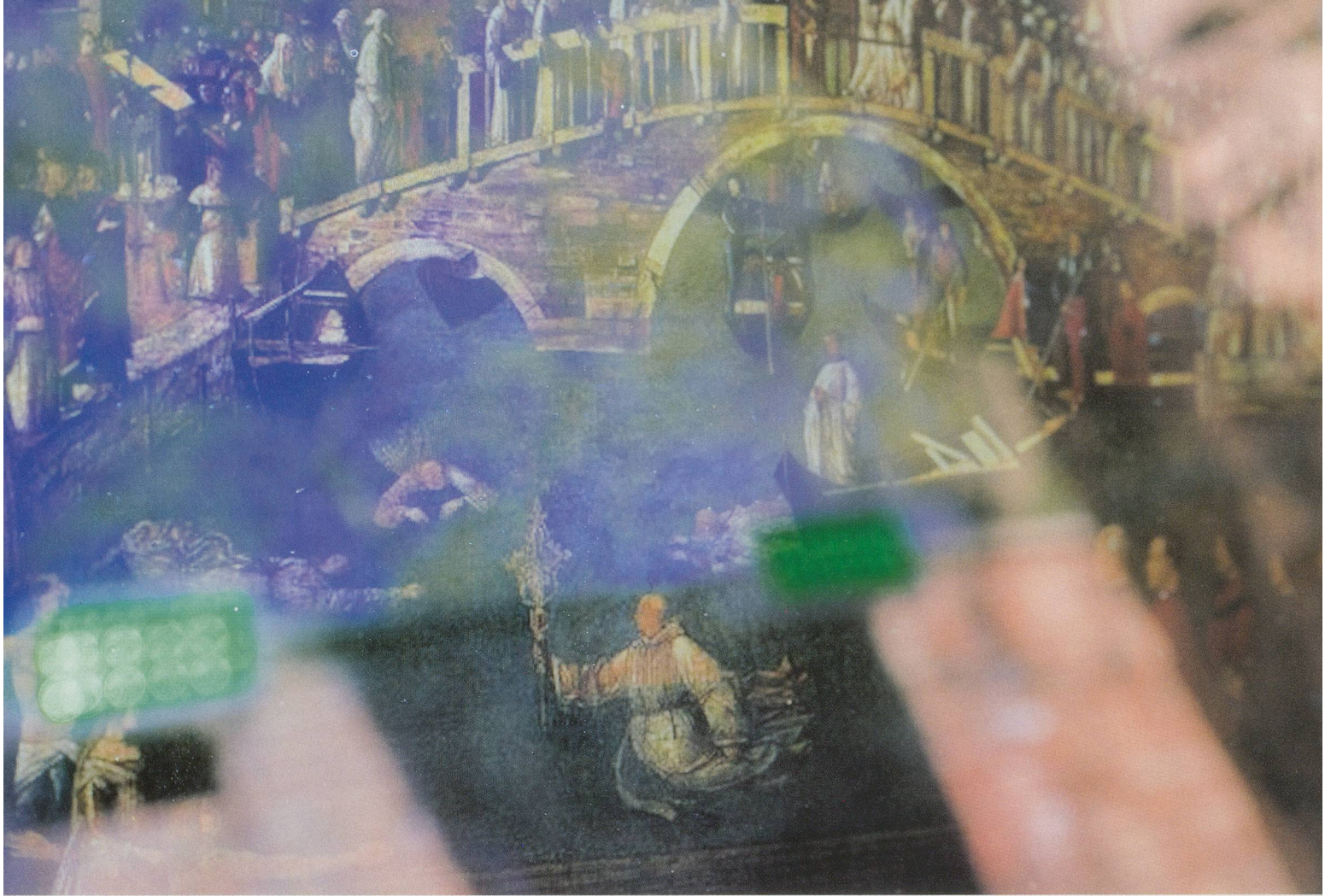
PAMELA ROSENKRANZ, OUR PRODUCT (NAMING) , 2015, sketch, Swiss Pavilion, Venice / UNSER PRODUKT (NENNUNG) , Skizze.