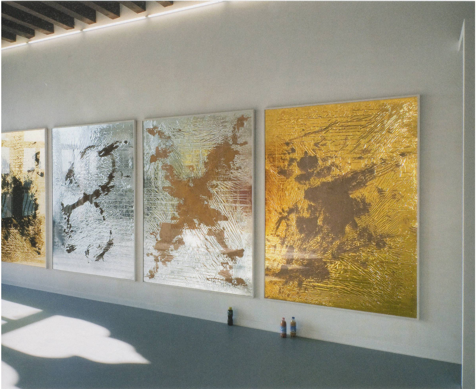
PAMELA ROSENKRANZ, "Our Sun," 2009, installation view, Istituto Svizzero, Venice / Installationsansicht.