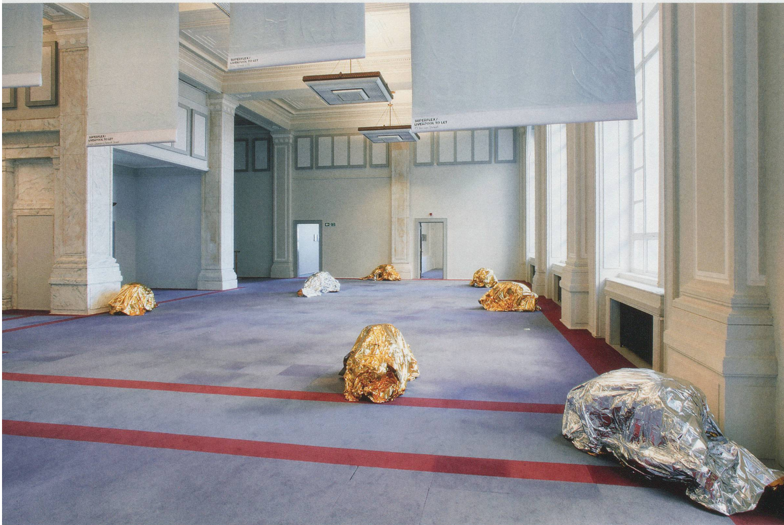
PAMELA ROSENKRANZ, "Bow Human," 2012, installation view, Liverpool Biennial / Installationsansicht.