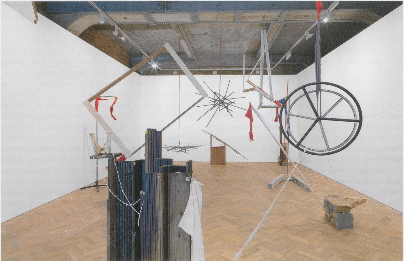
ABRAHAM CRUZVILLEGAS, AUTODESTRUCCIÓN 4: DEMOLICIÓN ( Self-Destruction 4: Demolition ), 2014, installation view Thomas Dane Gallery, London / SELBSTZERSTÖRUNG 4: DEMOLIERUNG , Installationsansicht.

high ratio of people with neither stable employment nor income and “consisting of small-scale manufacturing and crafts, small-scale trade, and many varied services.” 7) This is the circuit from which Cruzvillegas draws his raw materials, and it is the one to which he tends to refer when discussing his work. But it would be too simple to merely align him with this underprivileged realm; as Santos writes, the upper and lower circuits cannot be so neatly divided. What he calls a “shared space” does not denote a realm of equilibrium or cooperation but rather an agonistic space in which the social classes corresponding to the two circuits compete “for market hegemony and spatial control,” with the upper claiming “total unification and penetration of the market” and the lower seeking to assert “some role in aggregate spatial organization.” 8)