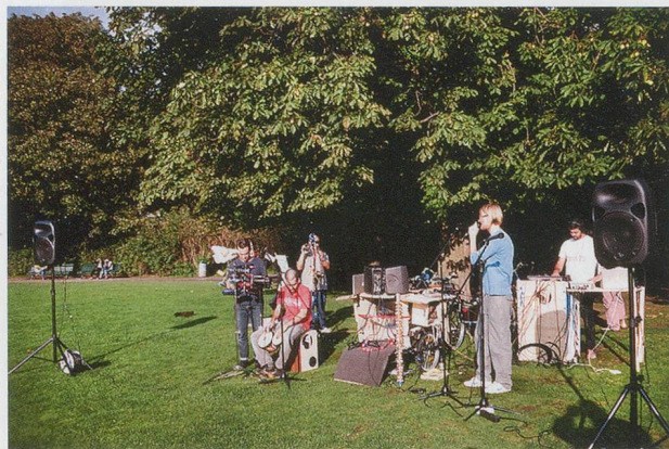
ABRAHAM CRUZVILLEGAS, "The Self Builders' Groove," 2011, performance view, Berlin / «Der Eigenbauer-Groove», Performance-Ansicht.

einem Stadtrandgebiet, das von Unsicherheit, unzulänglicher Versorgung und Solidarität geprägt ist. Jeder Text birgt sozusagen eine Lektion, aber einige scheinen auch eine speziellere, allgemeingültigere Reflexion zu enthalten, und zwar nicht nur zu den strukturellen Parametern der Siedlung seiner Jugendzeit, sondern auch zu denjenigen seiner heutigen Künstlertätigkeit.