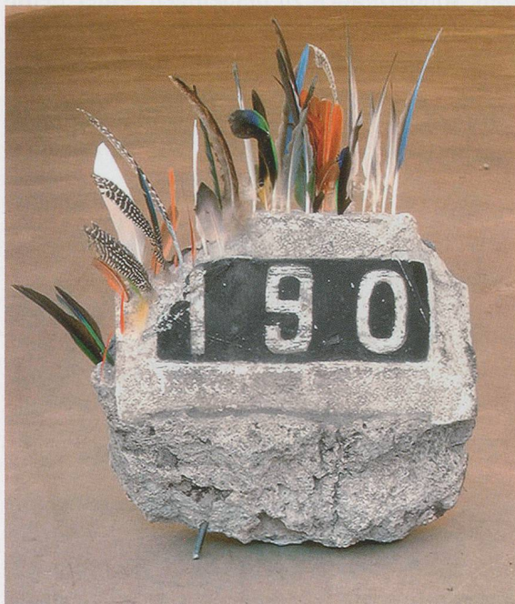
ABRAHAM CRUZVILLEGAS, THE INVINCIBLE , 2002, rock, feathers, mixed media, 18 x 15 x 4 1/2" / DIE UNBESIEGBARE , Stein, Federn, verschiedene Materialien, 45,7 x 38,1 x 11,4 cm.