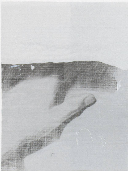
LEE KIT, NO (II), 2014, acrylic, emulsion paint, inkjet ink, correction fluid, and pencil on cardboard, 23 3 / 4 x 18 1 / 8 " / NEIN (II), Acryl, Emulsionsfarbe, Inkjet-Tinte, Korrekturflüssigkeit und Bleistift auf Karton, 60,5 x 46 cm.

KNOW MARY (Du kennst Mary nicht, 2014) erneut auf: eine Standaufnahme von zwei in hellgelbes Licht getauchten Füßen – der rechte Fuss für immer knapp über dem Boden schwebend, mitten im Schritt zum Betrachter hin angehalten – wird auf ein vertikales Stück schwarz bemalten Karton projiziert, auf dem in weisser Kritzelschrift zweimal die Worte FUCK YOU stehen. Ist dies ein Ausdruck der Wut, die in diesen impotenten Händen aufbegehrt? Die körperlose linke Hand in 0 (ZERO) (2014) könnte auch etwas sagen wollen, wenn sie vor der unregelmässigen schwarzen Kartonfläche ein Daumen-hoch-Zeichen aufblitzen lässt; doch die Spitze des Daumens wurde abgetrennt, und das Zögerliche dieser Befürwortung widerspiegelt sich im angrenzenden leeren Oval, der Null des Titels.