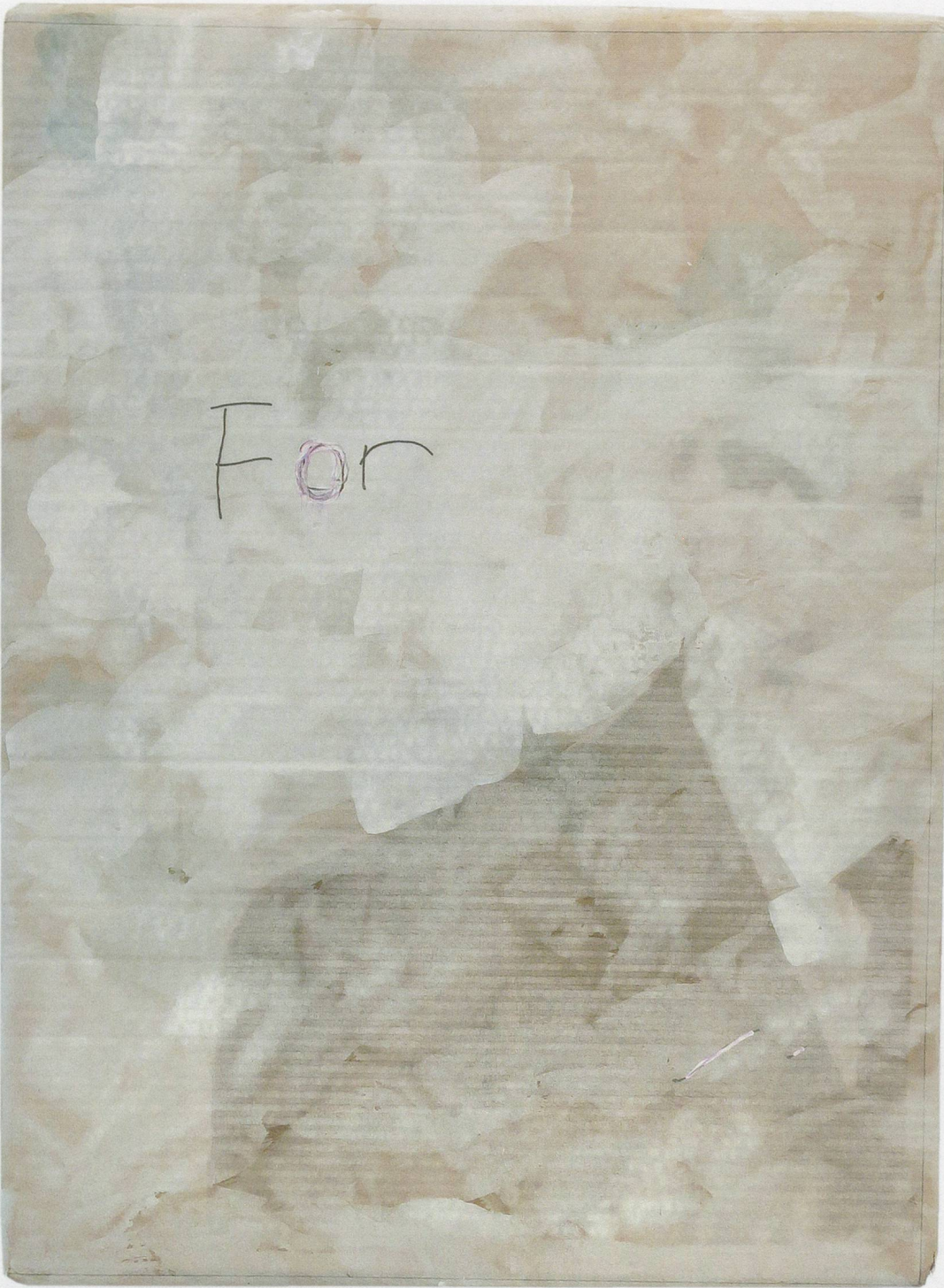
LEE KIT, FOR, 2014, acrylic, emulsion paint, correction fluid, pencil, and inkjet ink on cardboard, 25 x 18" / FÜR, Acryl, Dispersionsfarbe, Korrekturflüssigkeit, Bleistift und Inkjet-Tinte auf Karton, 63,5 x 45,7 cm.