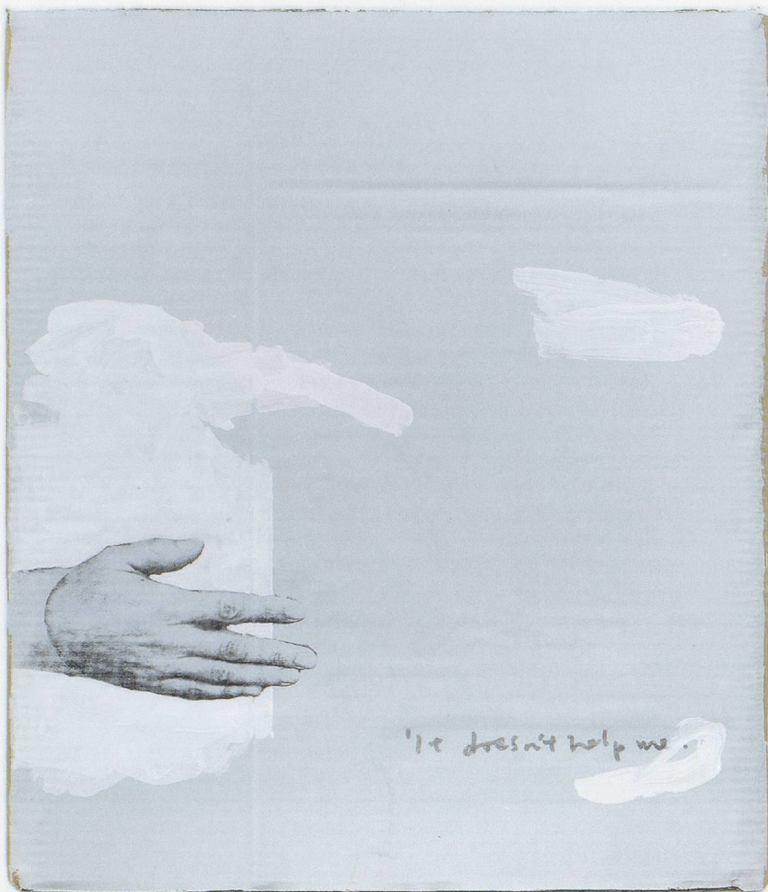
LEE KIT, IT DOESN'T HELP ME , 2014, acrylic, emulsion paint, inkjet ink, and pencil on cardboard, 20 3 / 4 x 18 1 / 8 x 1 3 / 4 " / ES HILFT MIR NICHT , Acryl, Dispersionsfarbe, Inkjet-Tinte und Bleistift auf Karton, 53 x 46 x 4,5 cm.

left corner; the story is written below, doubled atop itself as if each letter were shadowed by a doppelgänger. In another painting, a beseeching hand manages to articulate a full sentence, but offers no more support: IT DOESN'T HELP ME (2014). Gathered together, these fragments of bodies, conversations, and internal monologues take on an emotive force—more direct, wry, and violent than Lee's previous work.