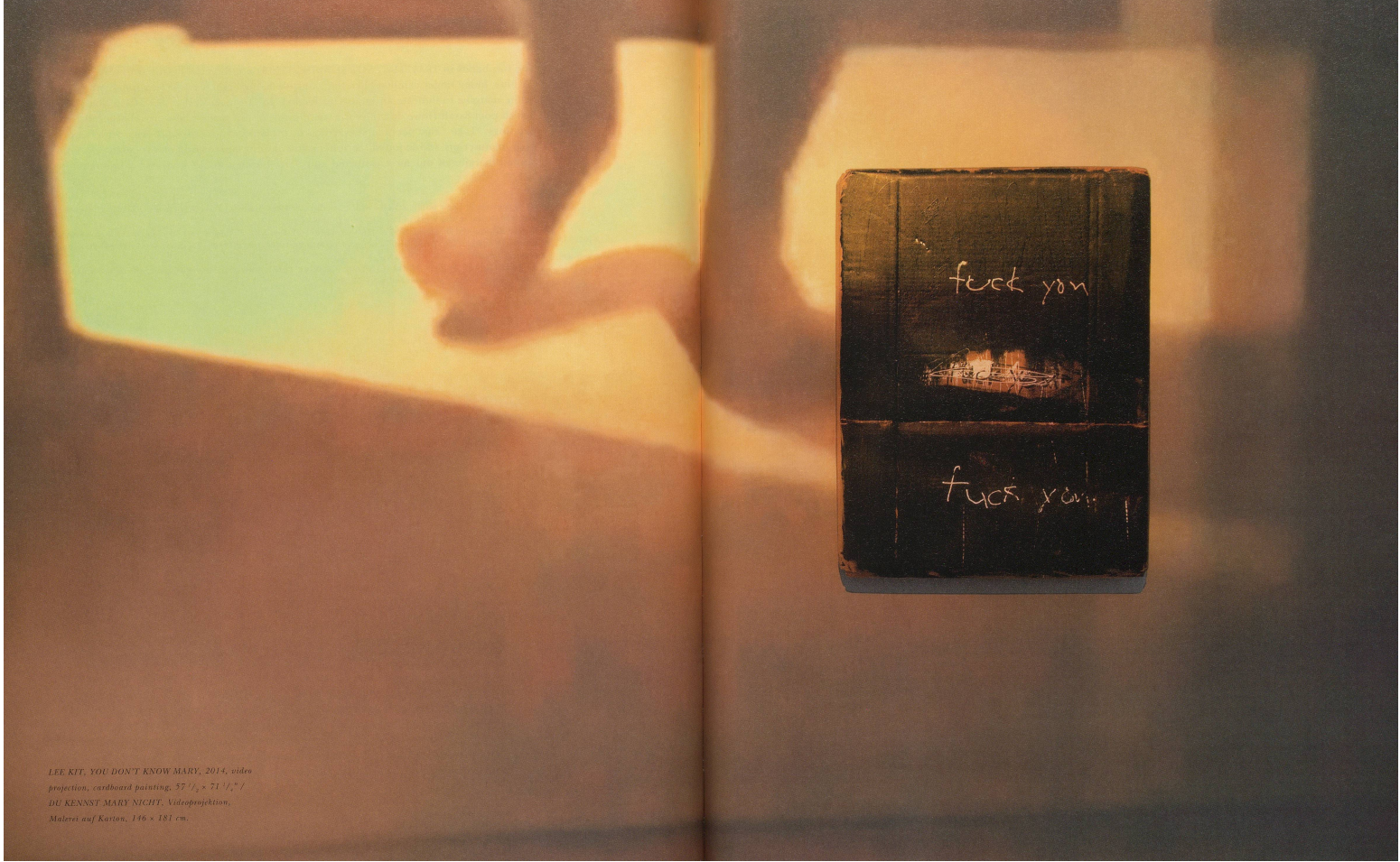
LEE KIT, YOU DON'T KNOW MARY, 2014, video projection, cardboard painting, 57 1/2 x 71 1/2" / DU KENNST MARY NICHT, Videoprojektion, Malerei auf Karton, 146 x 181 cm.