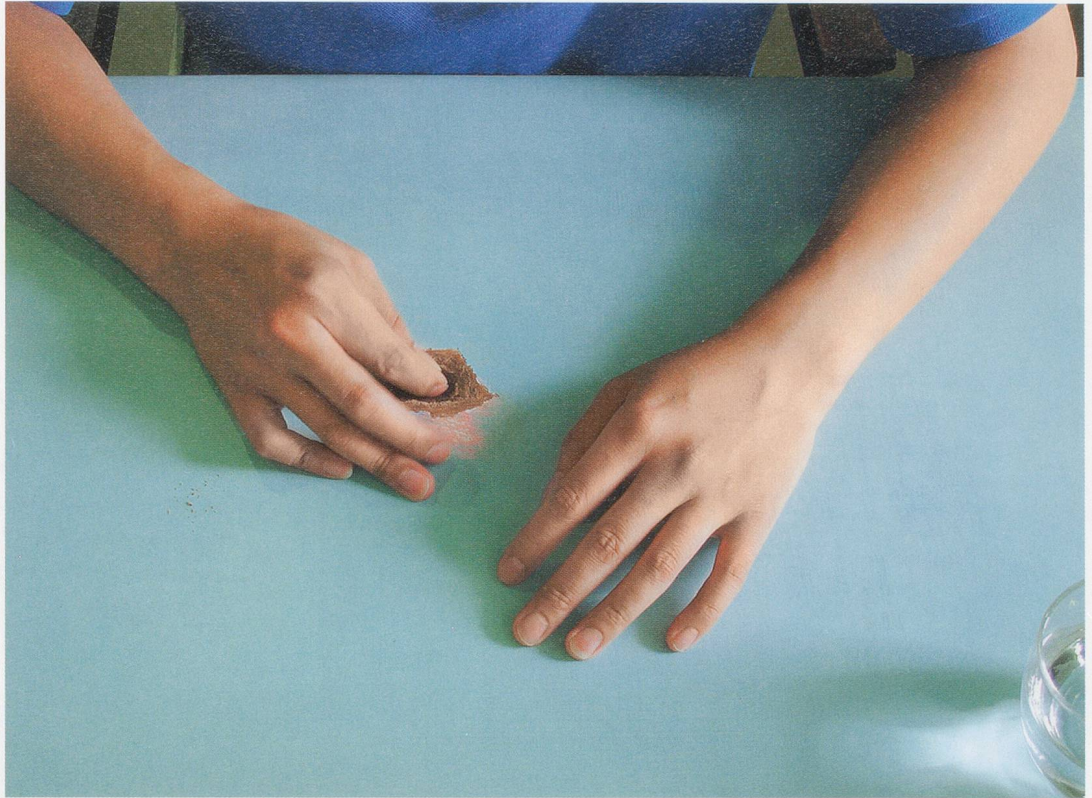
LEE KIT, SCRATCHING THE TABLE SURFACE , 2006–2011, acrylic on plywood, photo document, readymade object, 300 postcards / DIE TISCHPLATTE ANKRATZEN , Acryl auf Sperrholz, Photodokument, Readymade, 300 Postkarten.

the chin, replaced by two thick pink brushstrokes. While these almost-portraits reveal a new focus, imagery of the hand remains ever present. The masculine pair of hands in FUCK YOU (2014), a white-on-white painting on cardboard upon which a purplish blue light is projected, are cut off at the wrist, handsome yet powerless. That work's title is repeated in YOU DON'T KNOW MARY (2014), in which a freeze-frame image of two feet bathed in a bright yellow light—the right foot forever suspended just above the ground, paused in the act of walking toward the viewer—is projected over a vertical piece of cardboard painted black, on which the words FUCK YOU appear twice in a white scrawl. Is this an expression of the anger that seethes within those impotent hands? The disembodied left hand in 0 (ZERO) (2014) might also have something to say as it flashes a thumbs-up sign against the cardboard's uneven black surface; but the top of the thumb has been severed, and its hesitant endorsement is echoed in the tentative, empty oval adjacent, the naught of the title.