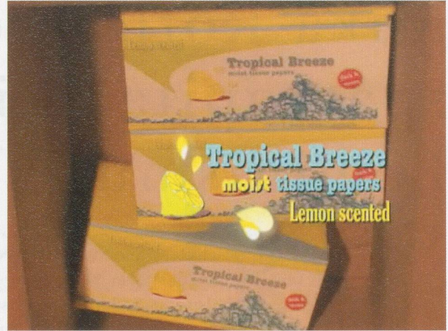
MIKA ROTTENBERG, TROPICAL BREEZE , 2004, single-channel video installation with sound, 3 min. 45 sec., dimensions variable / TROPISCHE BRISE , 1-Kanal-Videoinstallation mit Ton, Masse variabel.

Ihr Werk bietet damit eine Gelegenheit, diese Vermächtnisse zu überdenken und zeitgemässere feministische Bezugssysteme und Taktiken in der Kunst zu erkunden. 1)