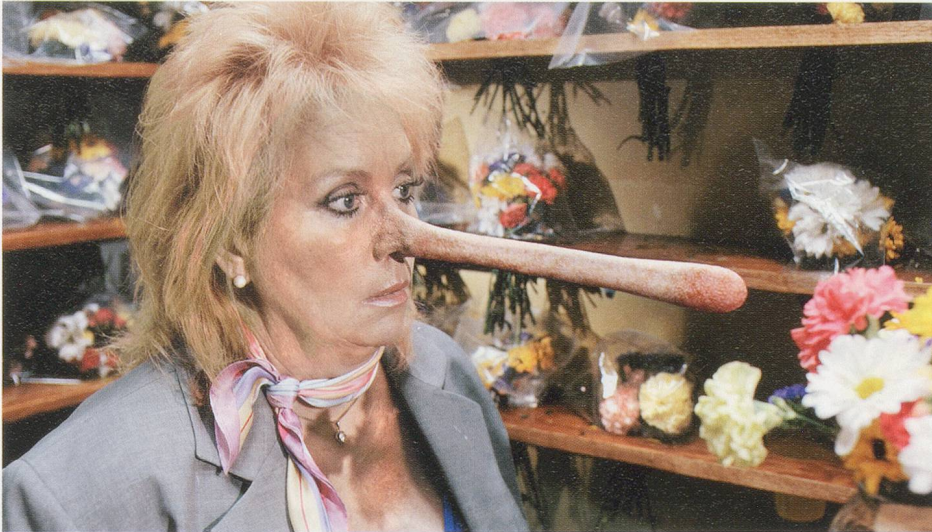
MIKA ROTTENBERG, NONOSEKNOWS , 2015, video with sound and sculptural installation, 22 min., dimensions variable / KEINENASEWEISS, Video mit Ton und skulpturaler Installation, Masse variabel.

anderen in die Hand nimmt, aufbricht und die Perlen aus dem zweifelsohne stinkenden, gummiartigen Fleisch in Kübel auspresst. Die Schmatz- und Knackgeräusche, die Feuchtigkeit allenthalben (die Frau trägt Stiefel), der dreckige Zementraum: Alles trägt dazu bei, eine Situation zu schaffen, die gleichzeitig extrem eklig und zutiefst traurig ist. All diese Verschwendung von Leben und Arbeit für haufenweise übelriechenden Abfall und schleimige Perlen, die ohne Frage bürgerlichen und wohlhabenden Frauen in China und darüber hinaus zur Zierde dienen werden. Hier weist Rottenberg auf die ultimative Ekligkeit hin, nämlich das System des globalen Kapitalismus.