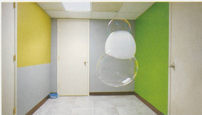
Stills from the video versions "Bubble 1 - Bubble 6", each version Ed. 6/2APs. /