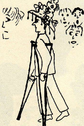
Text + Zeichnung: Barbara Zoller

1 Ein auffälliger Hut: eine annehmbare Entschuldigung für das ewige Angekarrt werden.