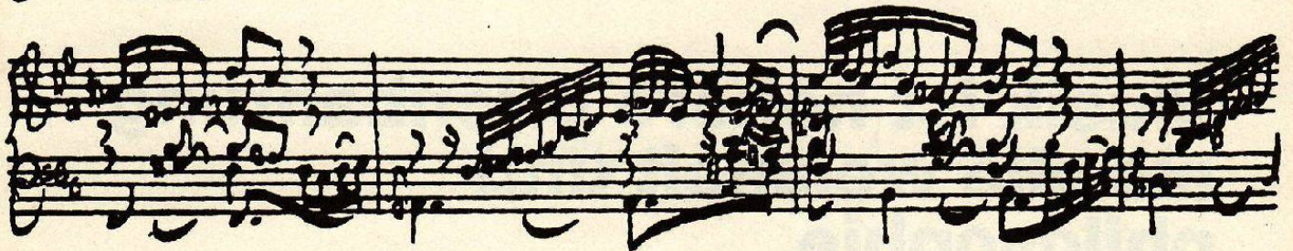
Notenhandschrift Joh. Seb. Bachs