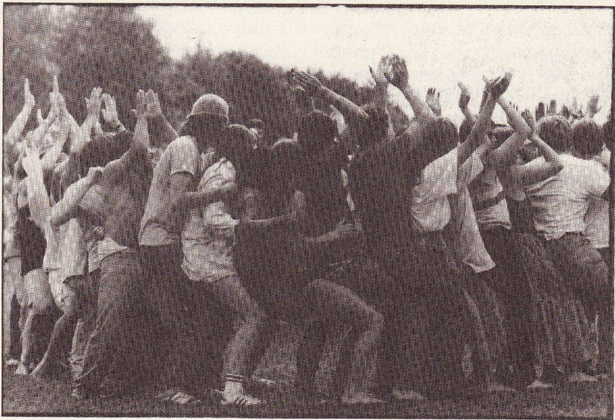
Aktivitäten im Freien

MONATSHEFT DER GRUPPEN IMPULS + CE BE EF