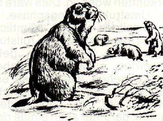
Steppemurmeltier oder Bobak

Auch im neuen Puls werden die Leser zu Wort kommen können, allerdings in etwas beschränkterem Rahmen. Nach dem Motto: eine einzige Meinung ist Silber, sie für sich behalten, ist Gold. ■