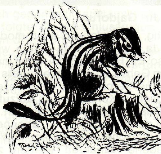
Burunduk oder Gestreiftes Backenhörnchen

Die Fortgeschritteneren unter uns können nach und nach auf solche Sündenböcke verzichten. Allein in eurer Fantasie seht ihr dann die Ratte oder den Hamster in einem Manager, den Wiesel in einem Polizisten, oder das Meerschweinchen, manchmal auch richtiges Schweinchen, in einem Beamten. Sind sie nicht niedlich, die kleingewordenen Dinger. Das nächste Mal werde ich mich mit richtigen Schweinen und Böcken befassen.