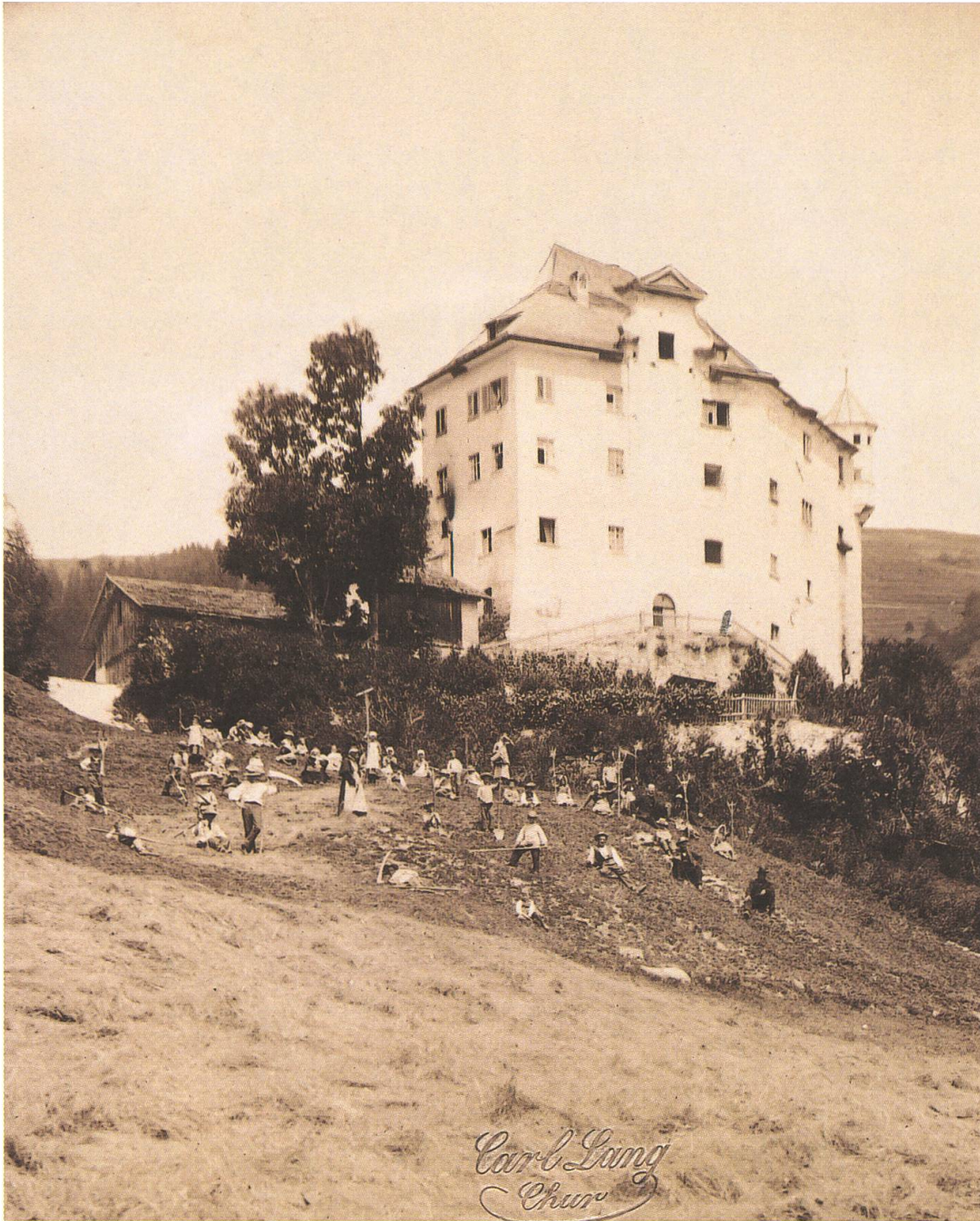
Schloss Löwenberg bei Schluen vor dem Brand von 1889; Foto Carl Anton Lang. StAGR, FR A Sp III/11v/218.