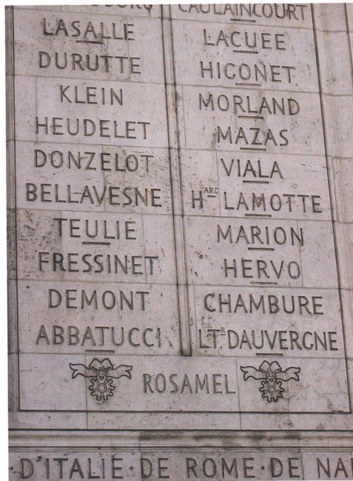
Arc de Triomphe in Paris, Demonts Name figuriert auf der Ostseite des Triumphbogens.