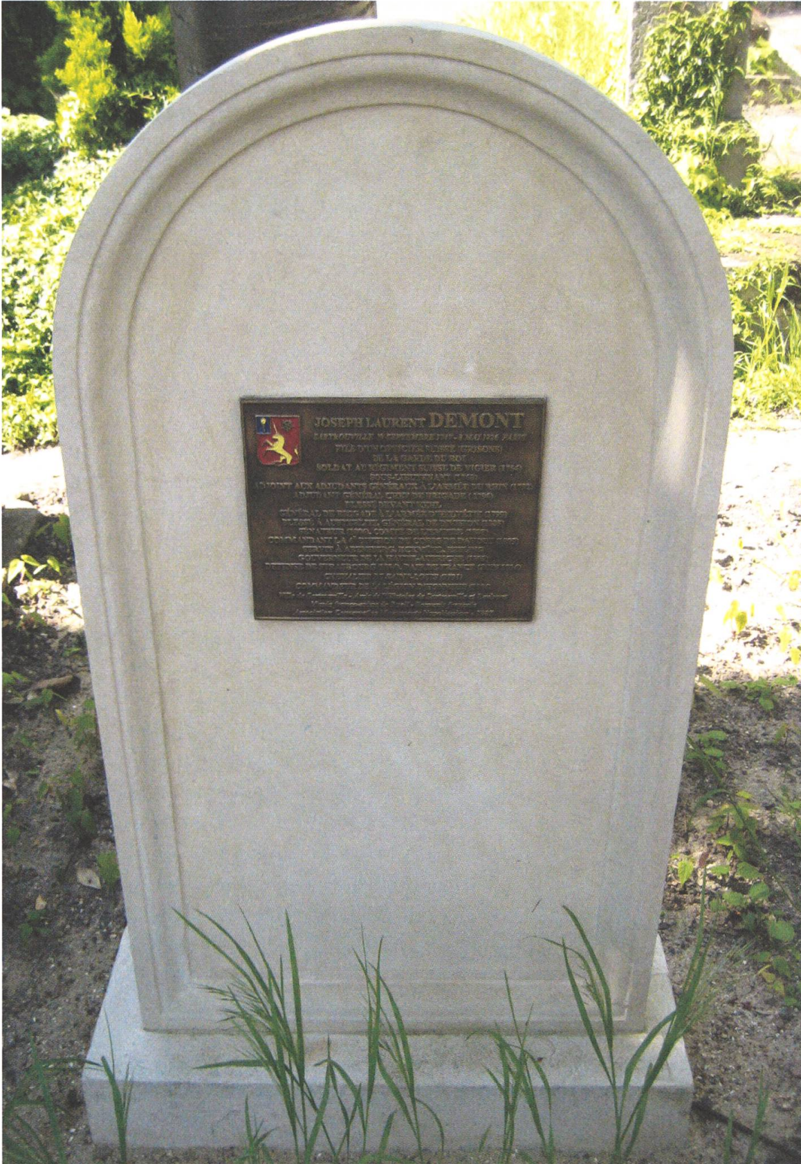
Gedenktafel für Joseph Laurent Demont auf dem Friedhof Père Lachaise in Paris, 2007.