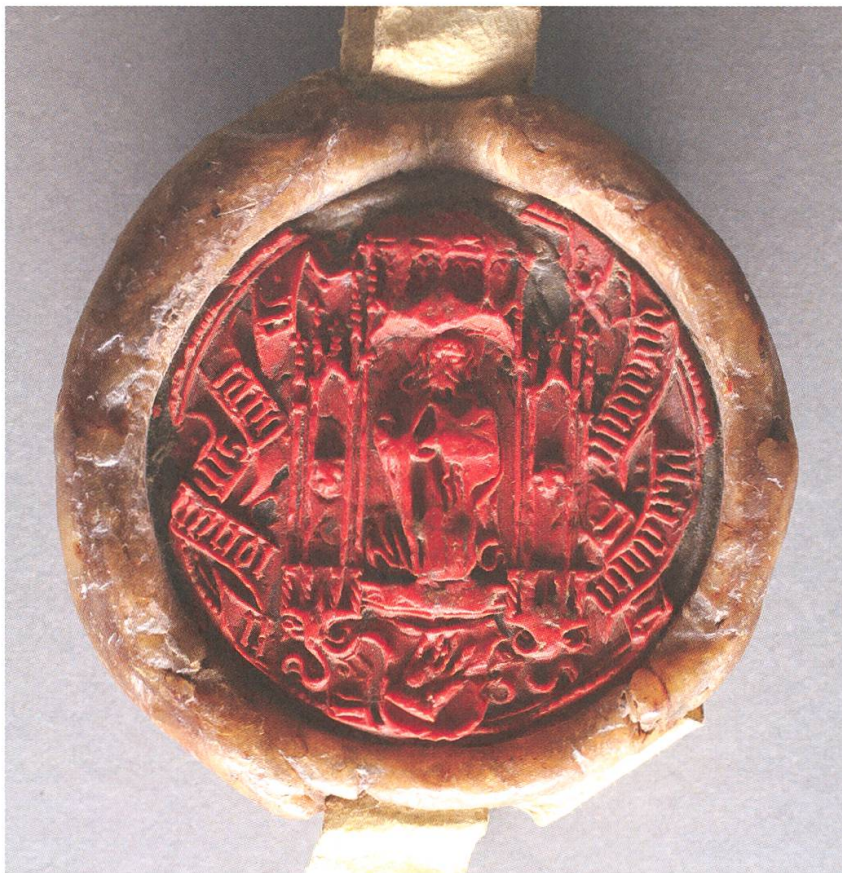
Abb. 6. Siegel der Äbtissin Angelina Planta (1478/79–1509). KAM, VIII/41.

Herzog Sigmund von Österreich als Kastvogt die von ihm unterstützte Clara von Salis mit Waffengewalt als Äbtissin einzusetzen sucht. Schliesslich lenkt Herzog Sigmund ein, erzwingt allerdings Sonderrechte für Clara von Salis. 3 Während der Amtszeit von Angelina Planta erfolgen zwischen 1480 und 1509 zahlreiche Handänderungen. 4 Der Konvent einschliesslich der Äbtissin zählt 1493 lediglich fünf und 1506 sogar nur noch vier Frauen. 5 Am 29.5.1492 wird das Lehensgericht des Klosters umgeordnet 6 und im Vertrag von Glurns vom 2.2.1499 die Kastvogteirechte geregelt. 7 In ihre Amtszeit fällt zudem eine erste Umstrukturierung der kirchlichen Organisation im Val Müstair: Von der Talpfarrei mit dem Zentrum Müstair löst sich Sta. Maria ab und konstituiert sich 1492 als selbständige Pfarrei. 8 Von 1488 bis 1492 wird die bisherige karolingische Saalkirche durch den Einbau von zwei Säulenreihen, Netzrippengewölben, spitzbogigen Fenstern und einer Nonnenempore zu einer dreischiffigen spätgotischen Hallenkirche umgestaltet. Kurz vor der Jahrhundertwende wird als Reaktion auf die Bedrohungslage mit dem Bau einer neuen Klostermauer und der heutigen Tortürme begonnen. 9 Der Schwabenkrieg unterbricht die Bauaktivitäten abrupt: Vom 11.2.1499 bis zum Jahresende werden die Äbtissin und drei Konventualinnen von Müstair im Dominikanerinnenkloster Steinach bei Meran festgesetzt, 10 während das Kloster Müstair geplündert und durch