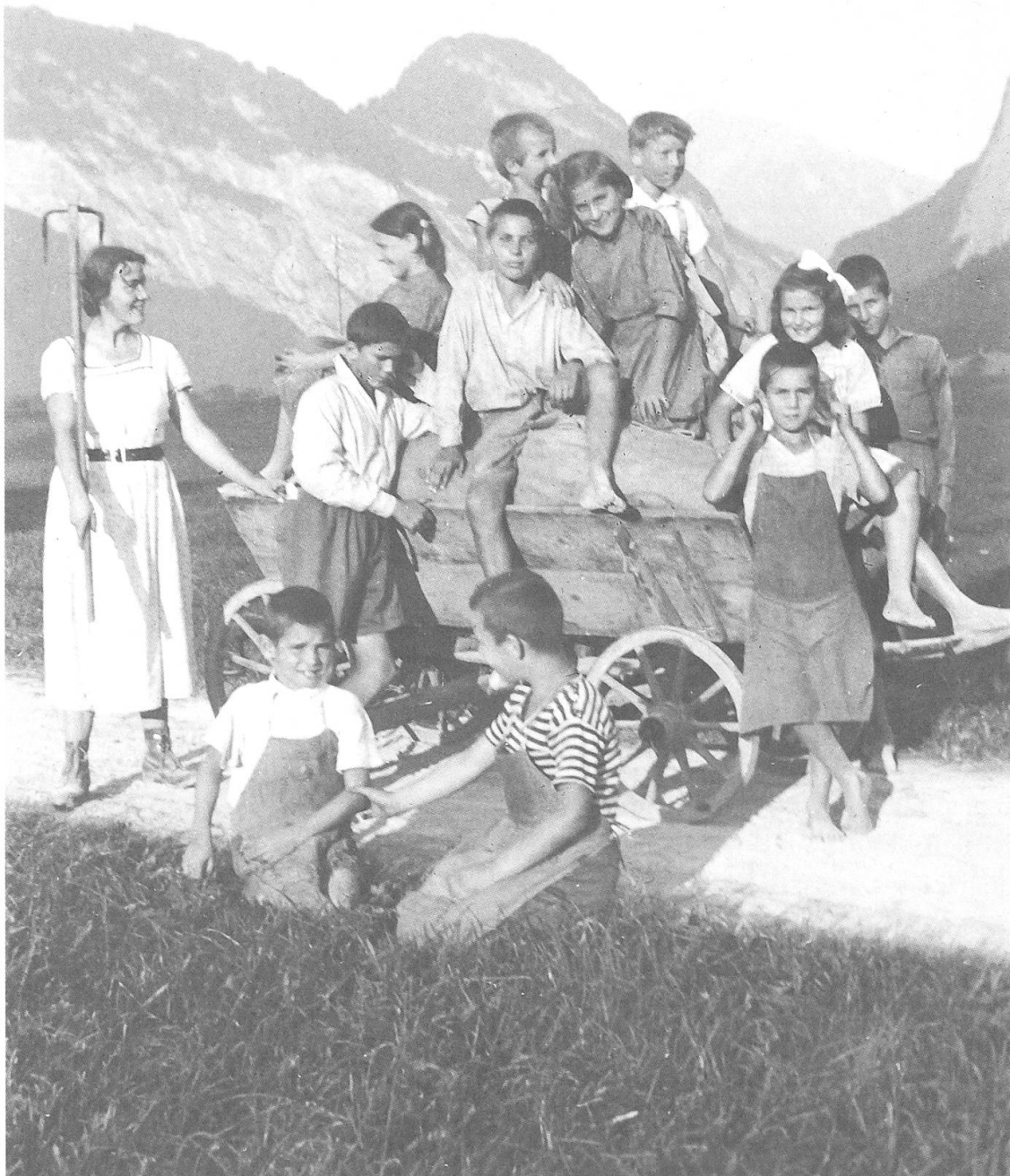
Zizerser Heimkinder kehren mit einer jungen Betreuerin von der Feldarbeit zurück. Nicht alle lachen in die Kamera (Aufnahme um 1930).