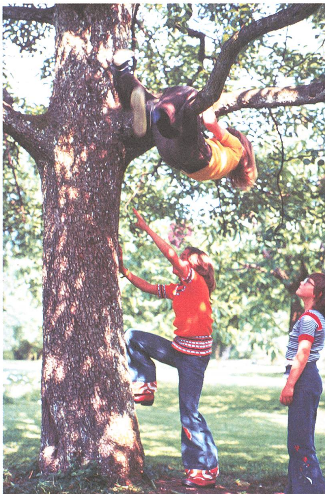
Das Spiel ist selbstverständlich geworden: Kinder beim Seilspringen vor dem Heim in Scharans und beim Klettern (Aufnahmen um 1980 bzw. 1970).