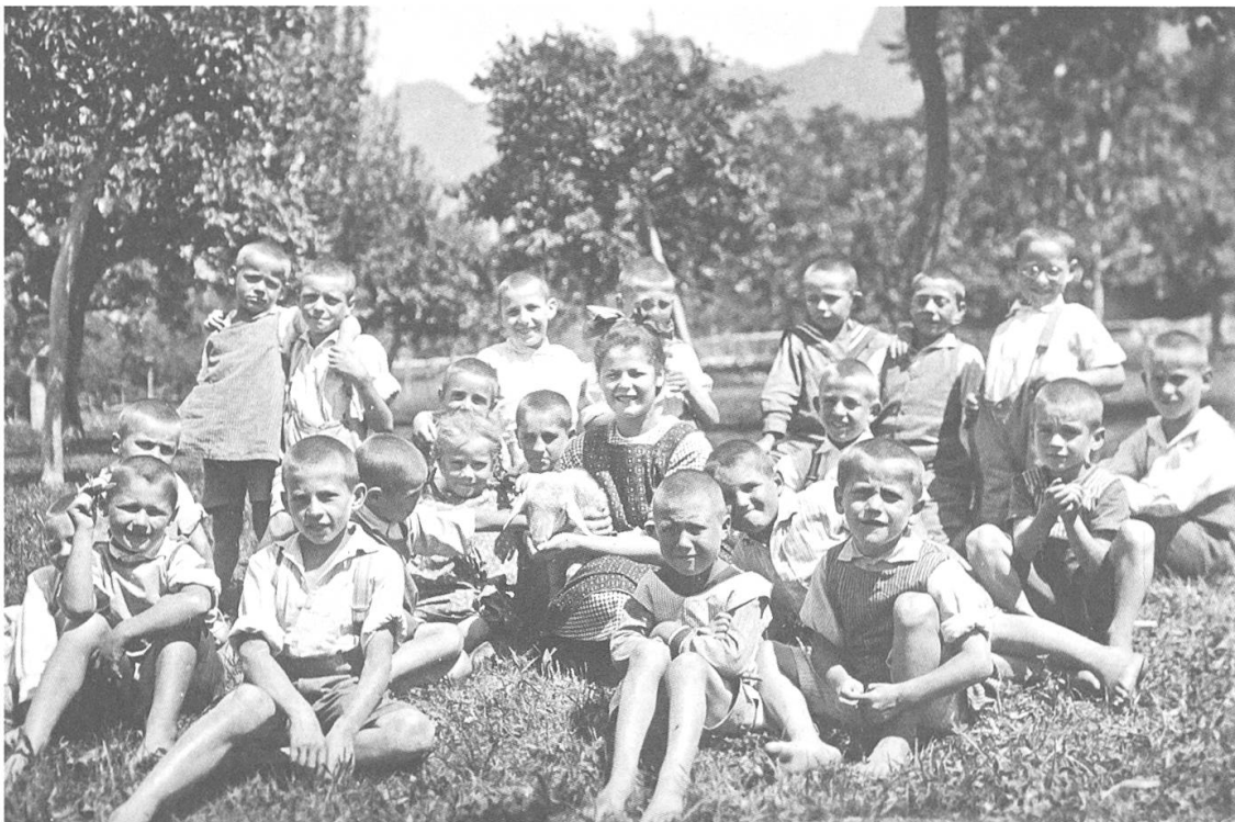
In den 1920er-Jahren wurden Buben und Mädchen meist getrennt erzogen. Die Mädchen posieren vor ihrem Heim in Felsberg, die Buben im Obstgarten des Hauses Marin in Zizers (Aufnahmen um 1925).