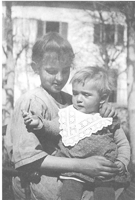
Die Arbeit der Kinder war streng und verantwortungsvoll: Heimknaben auf einem Kartoffelfeld in der Rheinebene und Heimmädchen mit einem «Stümperli» im Arm (Aufnahmen um 1920).