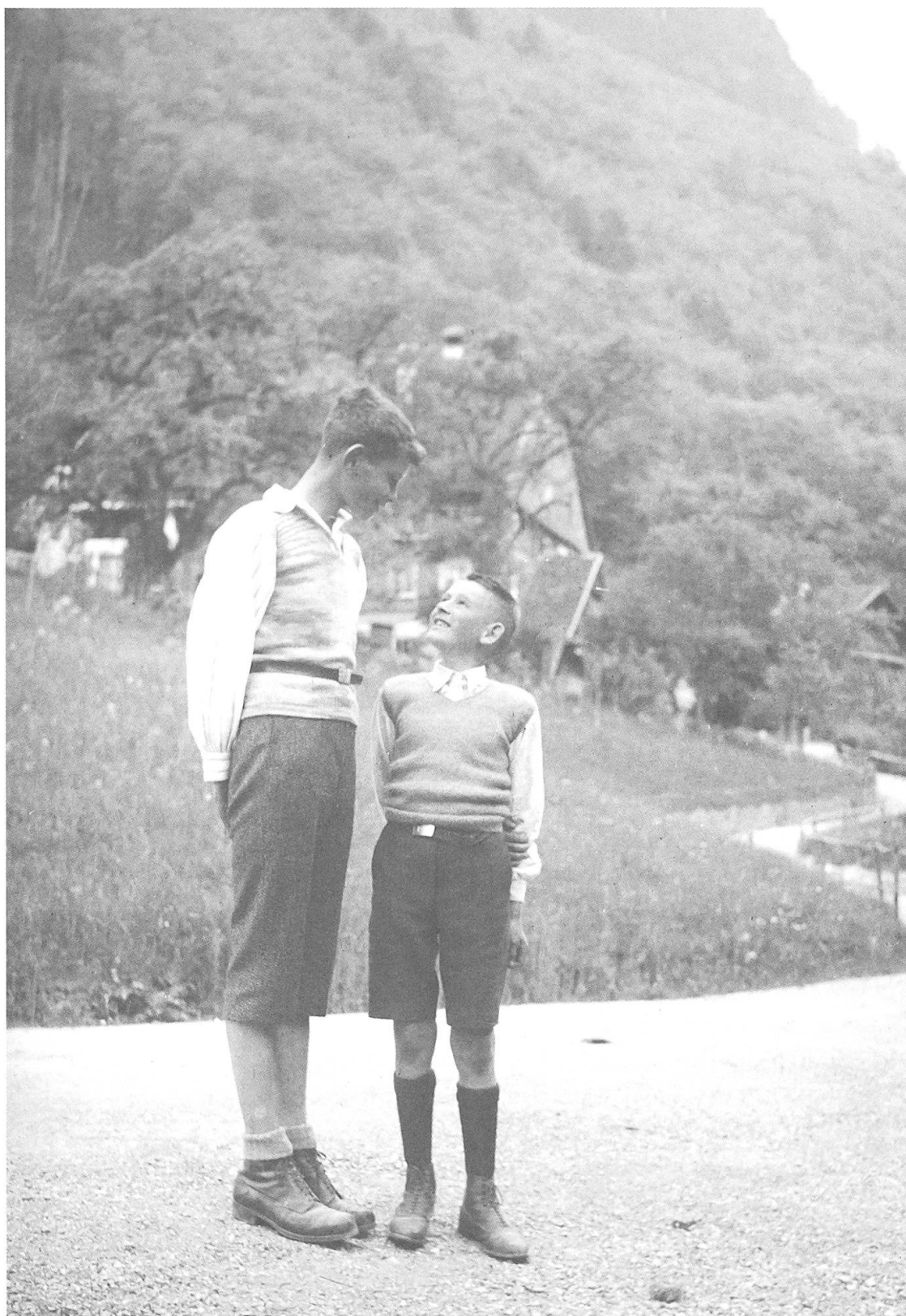
In den Kinderheimen kam und kommt es zu Freundschaften zwischen Kindern mit grossen Altersunterschieden (Aufnahme um 1940).