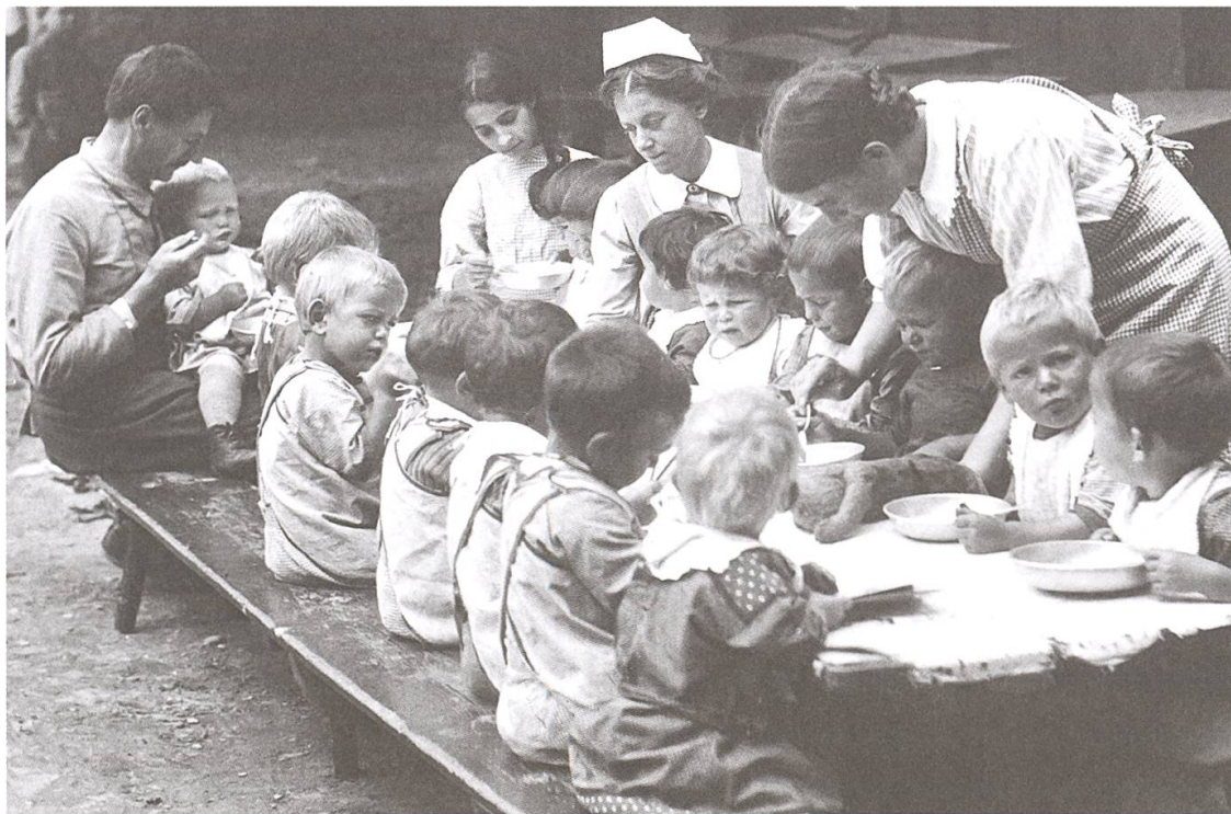
Anfangs der 1980er-Jahre gestaltete der Junge sein Zimmer individuell und dem Zeitgeist entsprechend, mit sichtbar drapierter Kinderbibel. Die Zeiten des Essens aus Blechtellern war seit 15 Jahren endgültig vorbei (Aufnahme unten um 1920).