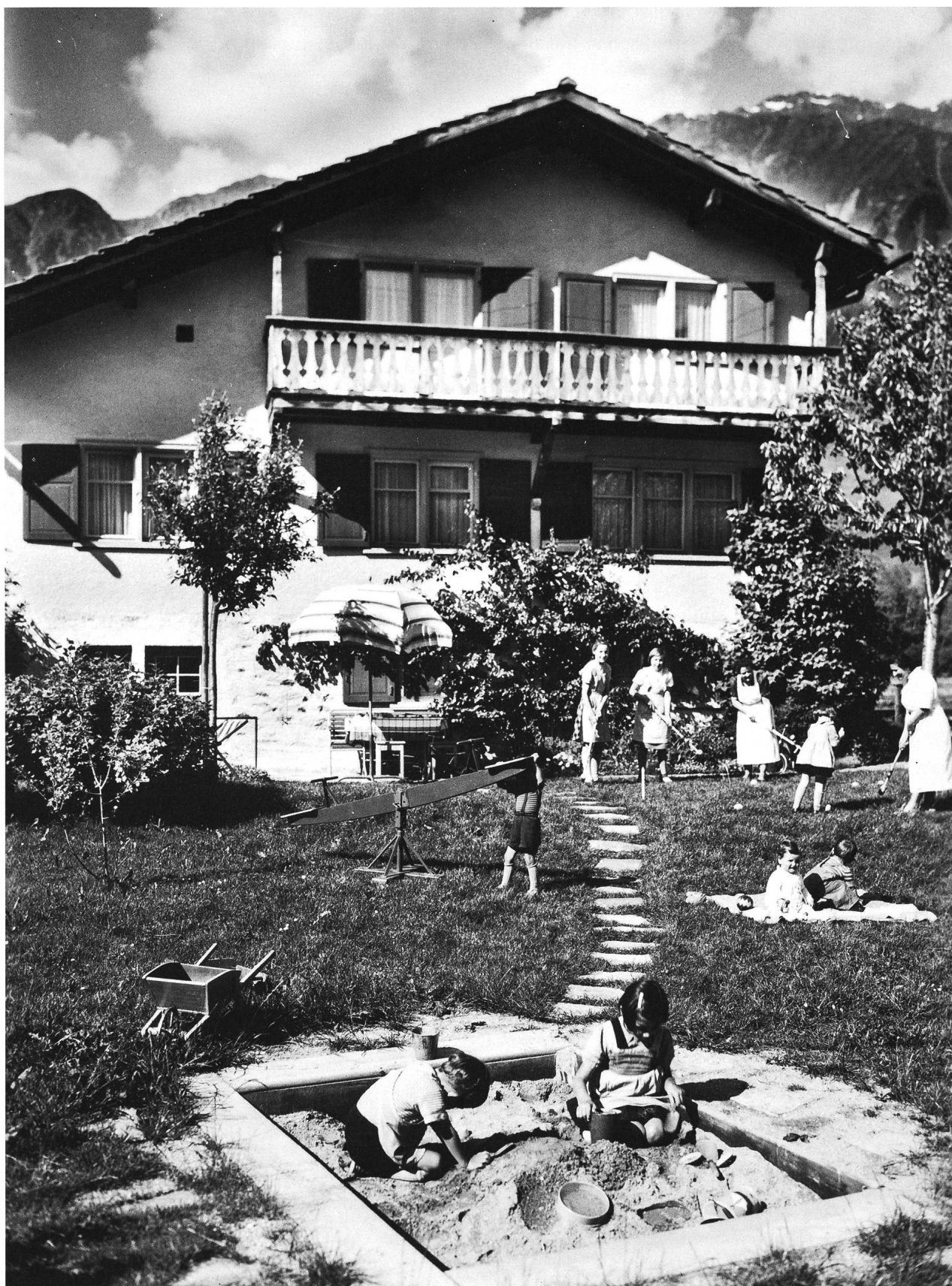
Abb. 19: Postkarte des Kinderheims «Cappwald», Klosters (um 1950).

Die Idylle trügt. Während Jahren wurden Kinder in diesem Heim misshandelt (Quelle: StAGR V 12 f 5).