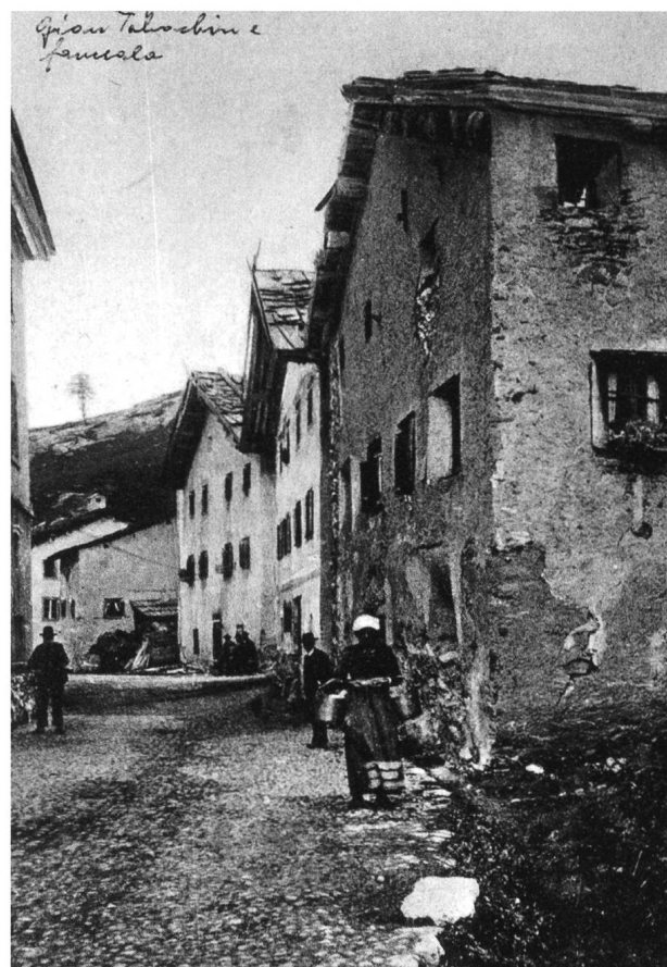
Abb. 15 und 16: Wohnhäuser in Guarda und Alt-Marmorera.

Links: Eingangstreppe zu einem Wohnhaus in Guarda, Foto 1910er- oder 1920er-Jahre (Quelle: Fundaziun Planta, Samedan).